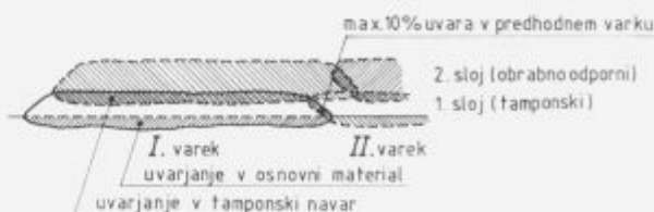
Slika 4: Shema navarjanja ploskev (Primer: navarjanje 1. in 2. sloja - tamponskih in obrabno odpornih navarov - z večžično elektrodo pod legiranimi aglomeriranimi praški)