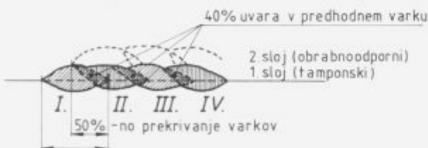
Slika 2: Shema navarjanja ploskev (Primer: Navarjanje 1. in 2. sloja - tamponskih in obrabno odpornih navarov - z elektrodami)