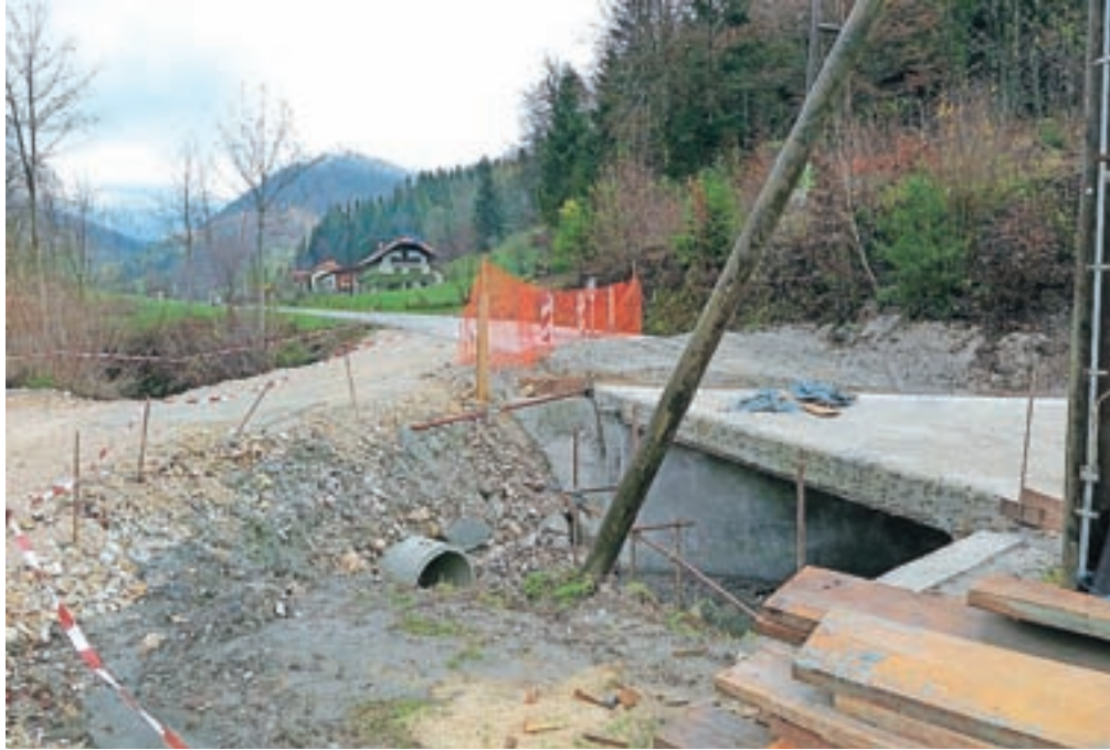
Med najbolj dotrajanimi mostovi v občini Kamnik je bil most preko Hruševke, ki ga v teh dneh že obnavljajo.

»Pri pregledu je bilo ugotovljeno, da je na krajnem levem oporniku mostu večja razpoka, na oporniku so vidne sledi zamakanja in odlom zaščitnega sloja, poškodovani so robni venci mostu in opažena je bila korodirana armatura. Zaradi zagotovitve ustrezne varnosti in prenašanje prometne obtežbe je predvidena temeljita sanacija levega opornika, izvedba hidroizolacije mostne plošče, izvedba prehodnih plošč, zamenjava zgornjega ustroja ceste na območju premostitve, sanacija robnih vencev ter