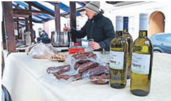
Obiskovalcem je bila na voljo pestra izbira vin.