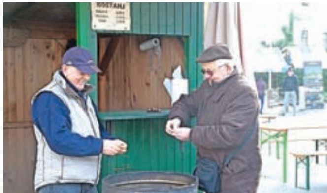
Kostanj je med najbolj priljubljenimi jesenskimi priboljški.