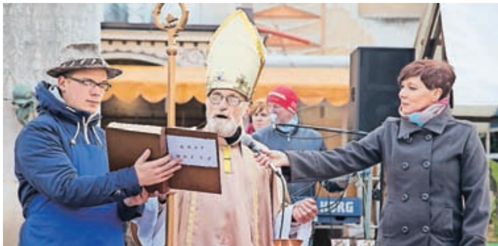
Tržnico je obiskal sv. Martin, ki je mošt spremenil v vino.

Obiskovalci tržnice so se lahko okrepčali s številnimi dobrotami iz nabora Okusov Kamnika ter tradicionalne