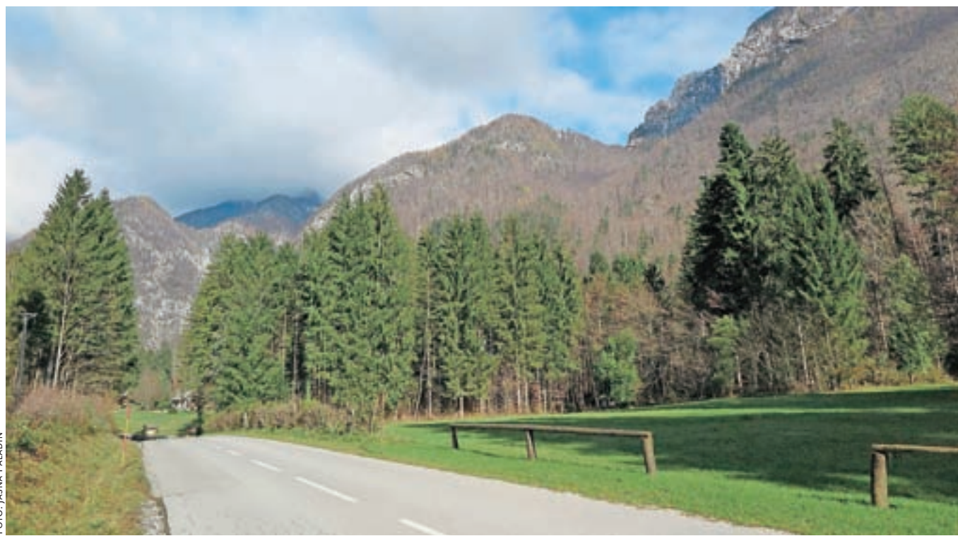
Okoli 2300 hektarov gozdov v Kamniški Bistrici je bilo vrnjeno agrarni skupnosti Meščanska korporacija Kamnik.

Upravna enota Kamnik je v zadevi vrnitve podržavljenega premoženja in pravic članom nekdanje Meščanske korporacije Kamnik izdala prvo delno odločbo, ki Meščanski korporaciji po petindvajsetih letih pravedno vrača nacionalizirana zemljišča v Kamniški Bistrici.