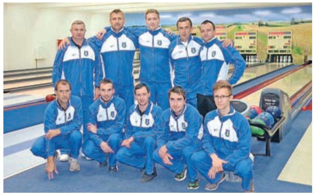
Ekipa KK Calcit Kamnik, ki je nastopila na Pokalu Evropa v Srbiji.

Pöhlten (Avstrija). Tekma z Avstrijci je bila sprva dokaj izenačena, toda avstrijski kegljači so bili na tej tekmi boljše ekipa in zmagali z rezultatom 2:6 (3444:3523). Poraz proti Avstrijcem je pomenil, da se bodo Kamničani pomerili za 3. mesto drugega polfinalnega obračuna, to pa so bili člani madžarskega kegljaškega kluba Zalaegerszeg. Tekma, ki je po prvi polovici kazala na zmago Kamničanov, saj so