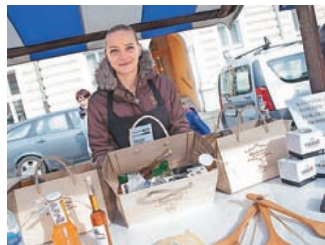
Na tržnici so predstavili tudi Kamniško košarico lokalnih dobrot.