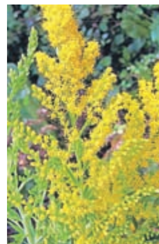
Kanadska zlata rozga