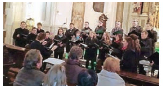
Pevci MePZ Cantemus