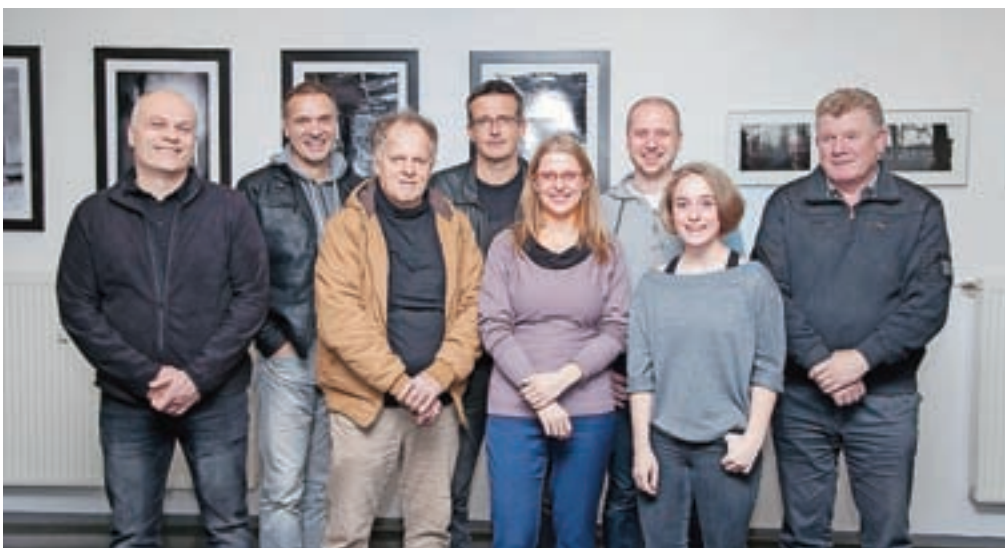
Avtorji razstave FKK OFF!

Razstava je na ogled do začetka prihodnjega leta.