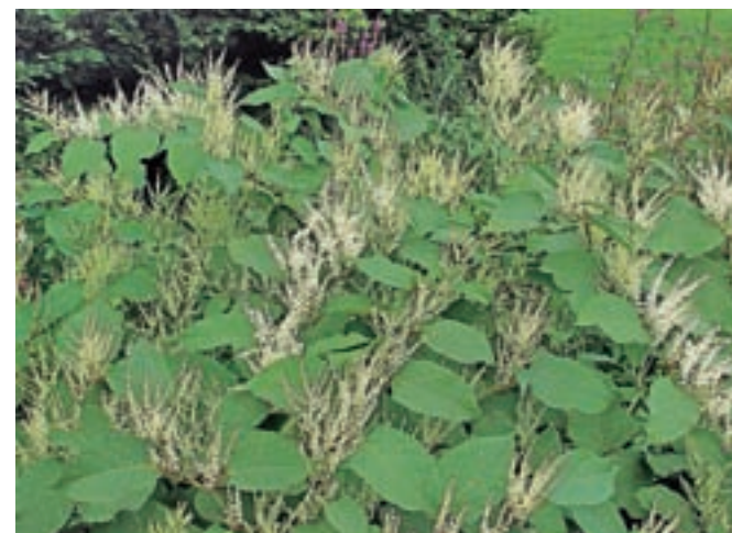
Japonski dresnik