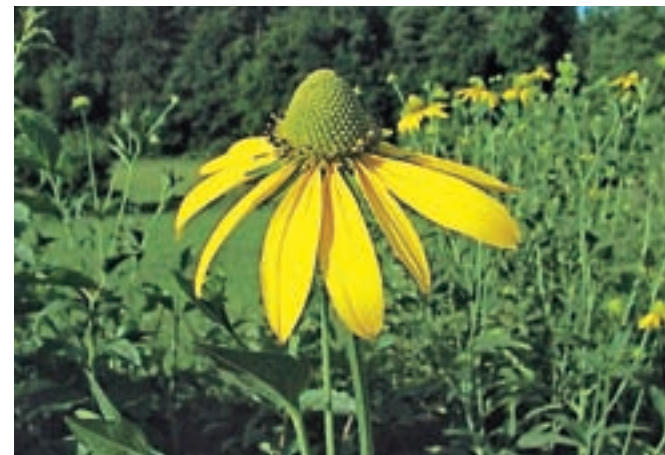
Deljenolistna rudbekija

Z upoštevanjem nekaterih pravil vsakdo lahko pripomore k ohranjanju pestrosti rastlinskega in živalskega sveta. V jesenskem času veliko ljudi čisti svoje vrtove, na žalost pa mnogi med njimi