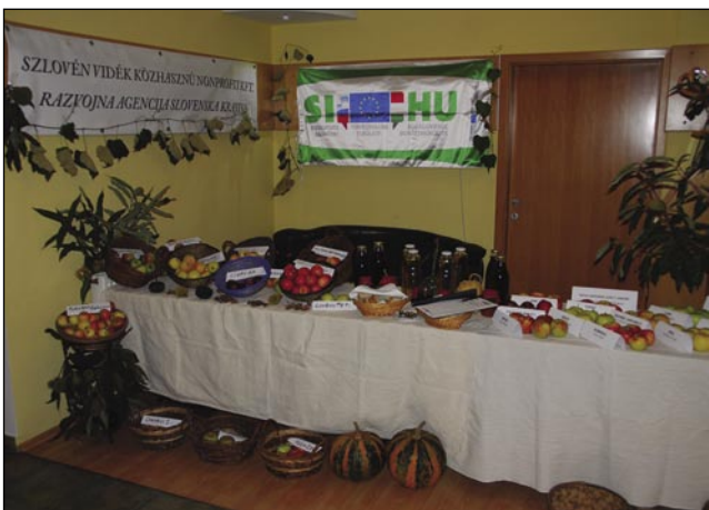
Razstavo je pripravila RA Slovenska krajina v okviru projekta »Upkač«