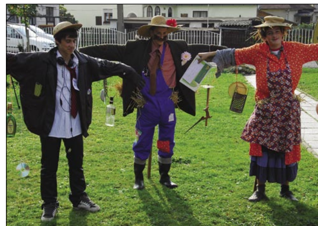
Živa stršila so se najbolje vidla publikii