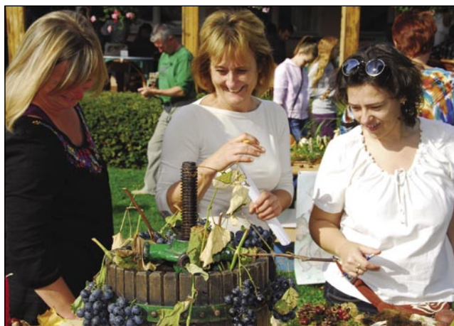
Komisija je vse skrbno poglednila

mesto dobili nagrado Term Monošter, karte za kopanje. Prvo mesto za najlepšo gesensko dekoracijo je pa dobila ekipa »Gospočke tikvi« iz šaule na Gorenjom Seniki. Za nagrado je poskrbela restavracija