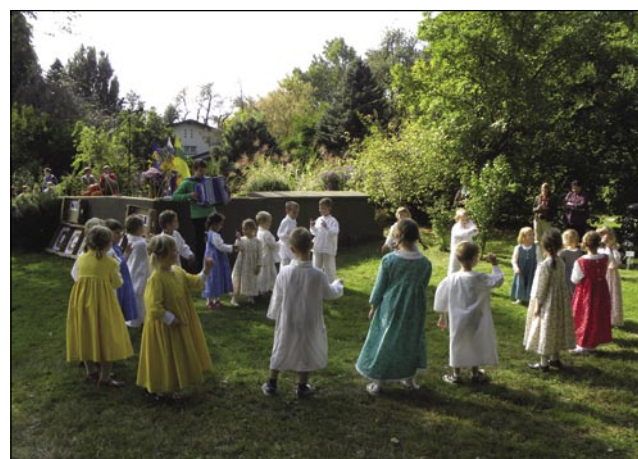
Obiskovalce so z ljudsko Špic polko navdušili otroci iz Vrtca Plavček pri Osnovni šoli Tišina.

li vseh 38 pomurskih osnovnih šol in 8 srednjih šol ter dobili 32 prispevkov osnovnošolcev in 10 prispevkov, ki so jih napisali srednješolci. Idejo za temo je dal akademik