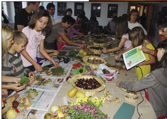
Na delavnici je vsakši leko napravo zasé kakšen gesenski okras

(ötlet) o živi stršilaj, v stere so se oblejki dijaki Srednje strokovne šaule Béla III.