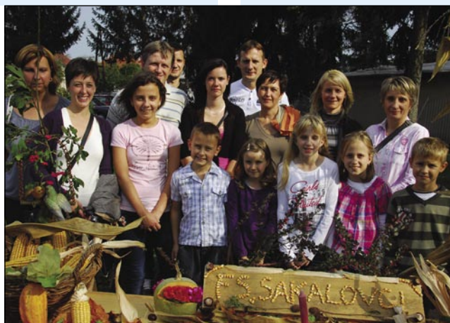
Od sakalovske folklore so prišli stariške pa mlajši tö

Lejpi tau programa so pripravili sodelavci Razvojne agencije Slovenska krajina pa porabski sadjarge, steri so meli v okviru projekta »Upkač« delavnice. Na njini razstavi so se mlajši pa starejši leko spoznavali s sortami djabok, stere so gnauksvejta rasle po stari (viski) djablana, dapa pokazali so nauve sorte tö, stere zdaj pauvajo porabski sadjarge. Na terasi je zadišalo po grauzdjomom čaji, ništrna deca je kumik čakala, ka bi se sküjo. Najbole se je pa mlajšom dopadnilo, ka so vidli, kak se preša djabolčni mošt. Dapa nejsa samo gledali, liki so flajсно pomagali tö djabke so stučli, prešo so punili pa prešali, sprešani mošt so v gläze