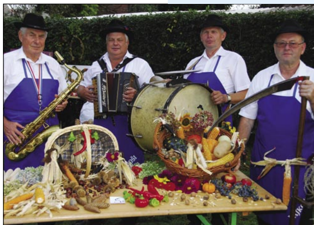
Za dobro volau so skrbeli Gorički lajkoši

gesenske dekoracije, aranžmaže. Eden od pogojev je bijo, ka naj se pri tom ponüca vse, ka se najde v naravi; v graci, na travniki, v gauški, na njivi... Etak smo pa na staulaj leko občüdovali rejsan vse