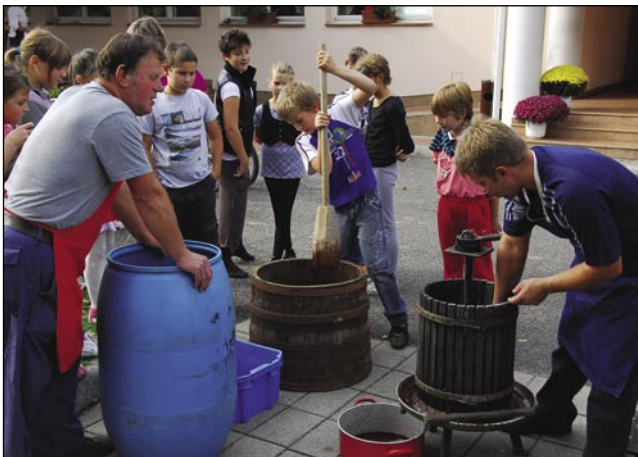
Vidite, mlajši, tak se sok dela

V zadnjem desetletju je za več kot 200 tisoč upadlo število ljudi na Madžarskem, v državi živi 9 milijonov 982 tisoč prebivalcev. Za kakih 250 tisoč je manj otrok kot pred desetimi leti in za kakih 245 tisoč je več ostarelih. Naraslo je tudi število žensk, le-teh je za 550 tisoč več kot moških. Temeljite spremembe so se zgodile tudi v družinah. Upadlo je število družin, medtem pa je naraslo število gospodinj. V vsakem tretjem gospodinjstvu živi en sam človek. Hkrati se je popravila izobrazbena struktura prebivalstva, to velja predvsem za žensko populacijo. Lani je živelo za kakih 200 tisoč več diplomiranih žensk v državi kot moških.