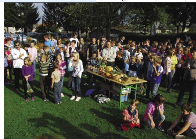
Mlajši so trno čakali, naj zvejo, sto je grato najbaukši