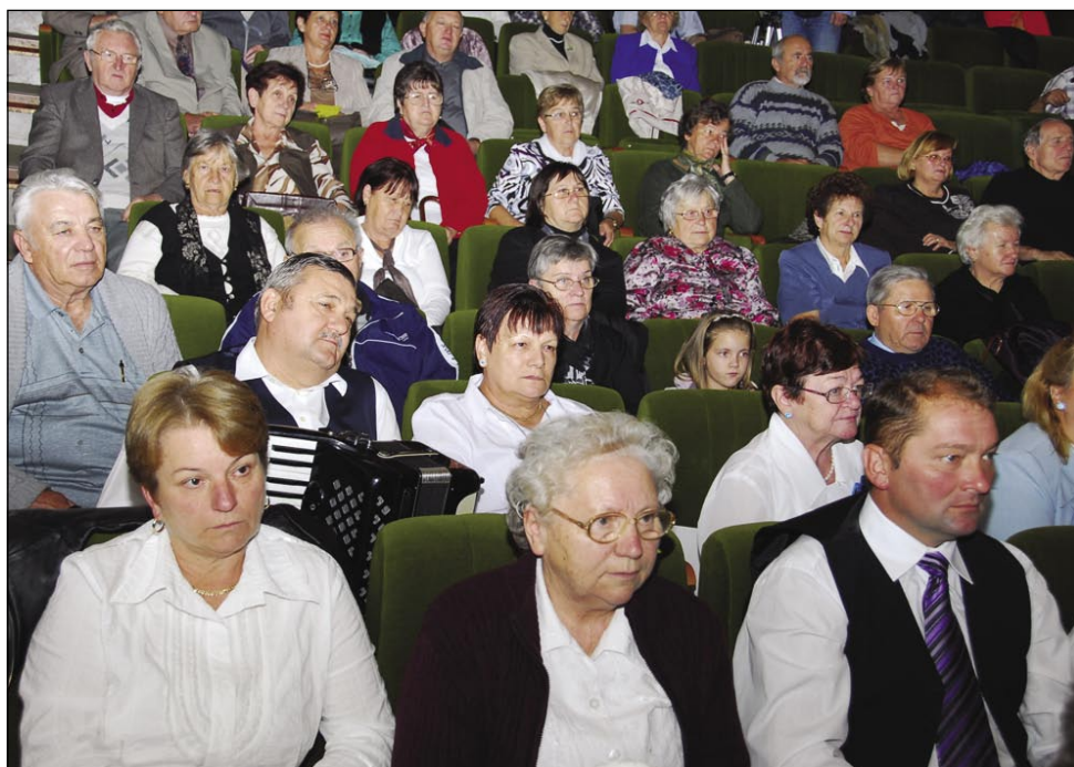
Gledalci, med njimi so bili člani Slovenske konference SSK tō

prišli pesmarge Ljudski pevcov Slovenskoga društva v Budimpešti, šteri eške samo menje kak dve leti vküper spejvajo, vsikdar pa donk pokažejo, ka etakši pojbov »nejga več«. Ljudski pevci in godci Porini pa počini so prišli iz edne vesnice nej daleč od prlečkoga Ormoža, pa so s fudami, lončenim basom pa lesenov škerjauv pokazali, kak je »Matjažek pujčeka klau«. Ljudske pevke ZSM Števanovci so s svojov mentoricev pokazale, kak leko edna vogrška melodija grata s slovenskimi rečami istinska porabska pesem (»Na brejgi trnina«), Ljudska pevška skupina Taščica KUD Rače pa je zaspejvala slovenske pesmi, brezi šteri prej nega Slovincov. Gorički lájkošov je nikomi nej trbōlo nutpokazati, so pá pokazali, kakša je šega na Goričkom, od štiri malo starejši moškov iz skupine Fantje od Male Nedelje smo pa leko čüli, ka eške itak vejo tak štiriglasno spejvati kak v legénski lejtaj. Ljudski pevci ZSM Gorenji Sinik so za tau srečanje s sebov pripelali bole žalostne pesmi, skuzé pa so poslušalcom za gvüšno dojpobrisali veseli, koražni pesmarge pa goslarage Kultur-noga društva godcev in pevcov Vinski bratje s Prekmurja.