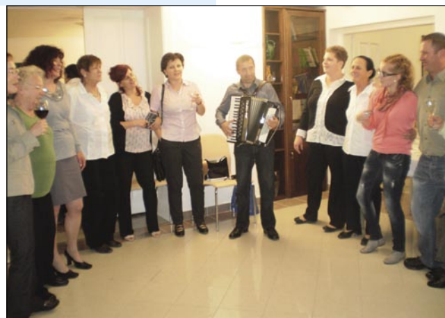
Tej edni so nej mogli taknjati spejvanje, tak so se dobro počütili

Gornjeseničani so pozno potovali domau, s člani Društva Triglav smo še po večerji šli na Citadelo. Drugi den, v nedelo je biu ogled mesta. Bili smo na Gradi, v baziliki, mimo smo se peljali trga Herojev, zaradi maratona tam nismo se mogli staviti. To je biu naš slovenski den letos, Vüpamo se, da tüdi drugo leto ga bomo priredili.