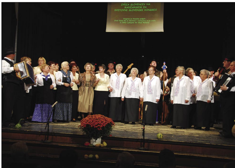
Na konci programa je bilau na odri više 60 pesmarov pa goslarov, steri so namesto ene spopejvali 3-4 slovenske pesmi

V zadvečerskom programi smo čüli dosta veseli, depa dosta žalostni pesmi ranč tak. Sombotelske spominčice so se nutpokazale na priliko s pesmimi o mrtvom sodaki pa betežnoj materi, Ljudske pevke ZSM Monošter pa – štere spejvajo vküper že 20 lejt – s trejmi porabskimi nautami. Venak so najbole daleč