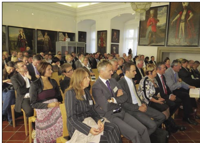
Poslovne konference se je udeležilo približno sto podjetnikov iz Nemčije, Avstrije, Madžarske in Italije

V nadaljevanju poslovne konference, ki se je udeležilo približ-