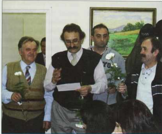
Pišeu moškov z gučom in klinčeci

Den žensk je takši svetek, šteri je samo vaš. Materinski den je več nej za vsako žensko. Den žensk je za najmlajšo »žensko«, štera eške nosi plenice, pa za najstarejšo tō, štera odi s klūkavo palico. Za lejpe mlade, štere nosijo na vsakšom prsti po dva zlata prstana. Pa za tiste tō, štere odijo z motkov na plečaj, pa majo žulnato prgišče. Na den žensk si edno raučico pa poljubček, edno lejpo besedo zasluži vsakša ženska.