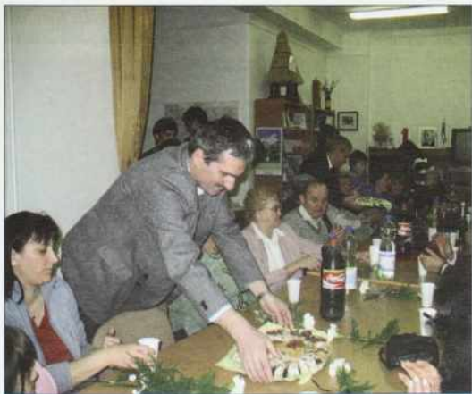
Moški so ponijali reteše

Tau tō ne pozabite, ka den žensk brez moškov nega. Tē svetek vam mi damo. Eške tau vam dopistimo, ka vam frigaš zgori ali pogačice v redlini – zato, ka mujs morete gledati televizijo. Gnauk se leko zej – pravimo mi moški. (Včara se je rejsan tak zgodilo.)