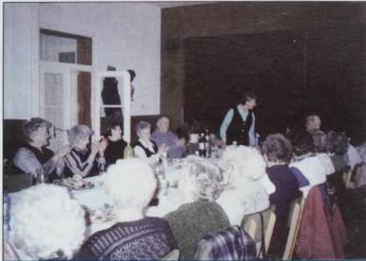
Člani kluba smo radi vküper, ne glede na tau, če smo Slovenci, Nemci ali Madžari

Znano je, ka na Dolenjom Seniki živejo tri narodnosti, Slovenci, Nemci in Madžari. V našom klubu se ne pozna, šteri je Slovenec,