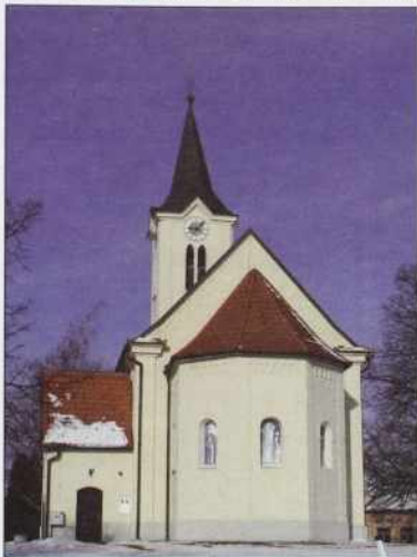
Cerkev sv. Benedikta v Kančevcaj/Bedeniki od vzhoda

O njoj lepau spominja cerkevna vizitacija iz 1778, zatok mislimo, ka je vse glavne forme zadržala do gnes. Zvün toga, kakpa, ka