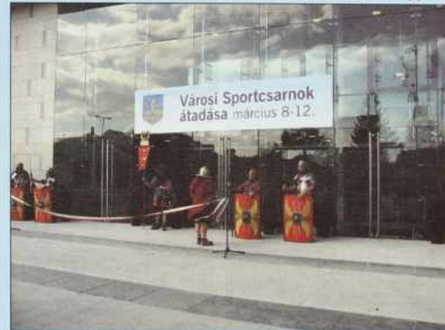
Legionarji pred dverami

V Somboteli so 8. marcüša prejkдали nauvo športno dvorano. Pred glavnimi dverami so stali legionarji (rimski sodacke) iz stare Savarie. Pred njimi je biu vötegnjeni pantlik s farbami madžarske zastale. V lejpom sončnom vrejmeni so mlajši in starejši vküprišli