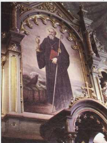
Glavni oltar s kejpom patrona sv. Benedikta v kančevskoj/bedeničkoj cerkvi

so jo te prenovili ešče ednok v leti 1896. S kraja 19. veka more biti tuj glavni oltar z olnatim kejpom patrona sv. Benedikta . Videti je v redouvniskom, črnom habitu starejšoga, že malo pišlivoga moškoga, s sivov kecov