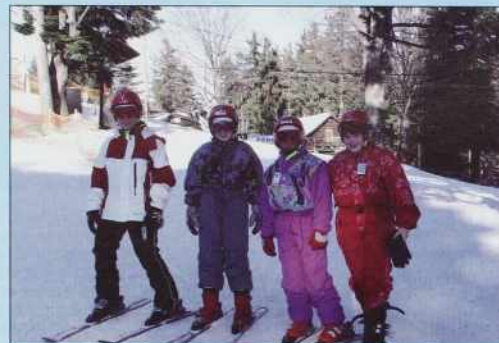
Smo že prave smučarke