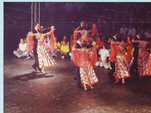
Plesci iz svetašnjoga programa

Sombotelški župan je pozdravo navzoče – posebj predsednika vlade in ženske. Ferenc Gyurcsány je biu eške minister za šport, gda je 2003. leta v Somboteli odo in dojdjau fundamentni kamen