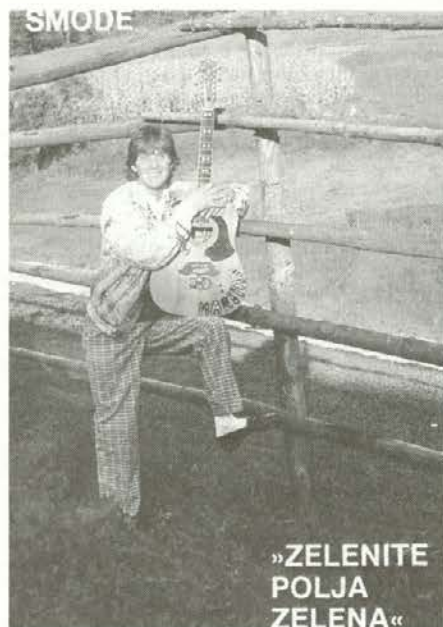
»ZELENITE POLJA ZELENA«