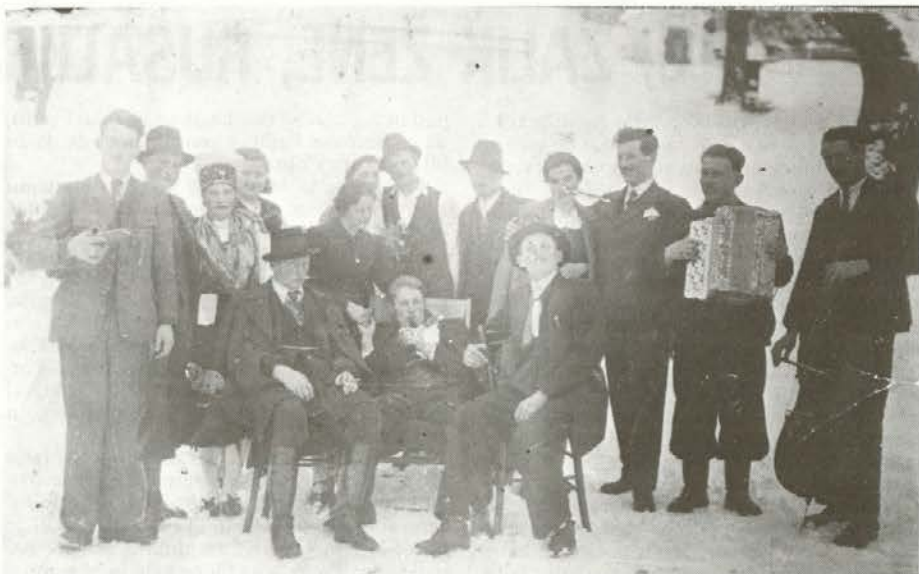
Igralci veseloigre »Zamotana snubitev« v Razboru leta 1941.