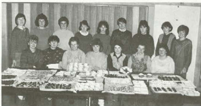
Udeleženke tečaja na Muti