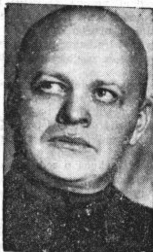
Kosior, eden izmed bivših stebrov rdečega režima v Rusiji, ki je padel sedaj pred Stalinom v nemilost in bil odstranjen.

se je izkazala kot neprekosljiv mojster v vodstvu zunanje politike. Ko je ves svet drgetal v nervozni napetosti zaradi postopanja in nastopa nekaterih sil, je ona čisto na tihem mobilizirala, toda ne toliko z orožjem kakor z nakupom živil. Svetovna vojna je namreč pokazala, da ne zmaguje tisti, ki ima najboljše orožje, ampak oni, ki more svojo vojko in prebivalstvo nasititi.