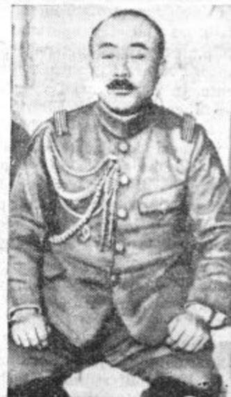
Nov japonski vojni minister general Šejširo Itagaki, ki se je bojeval doslej na Kitajskem bojišču.

bo vojna po izjavah maršala Čangkajška še dolgo trajala. Kitajska vojska se bo odslej izogibala večjim bitkam in bo skušala tako Japonce prisiliti, da se izčrpajo v naporih brez velikega preliivanja krvi. Japonske letalske napade na neutrjena in nezavarovana mesta obsoja vsa Azija. Morda bo prav to divjaštvo, ki ga v duhu svojih voditeljev uganjajo Japonci, njihov grobokop.