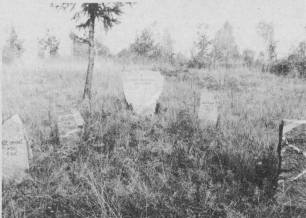
Ob dnevu mrtvih se bomo še posebej spomnili mnogih padlih za našo svobodo. Spominska obeležja padlim partizanom v Zg. Pristavi