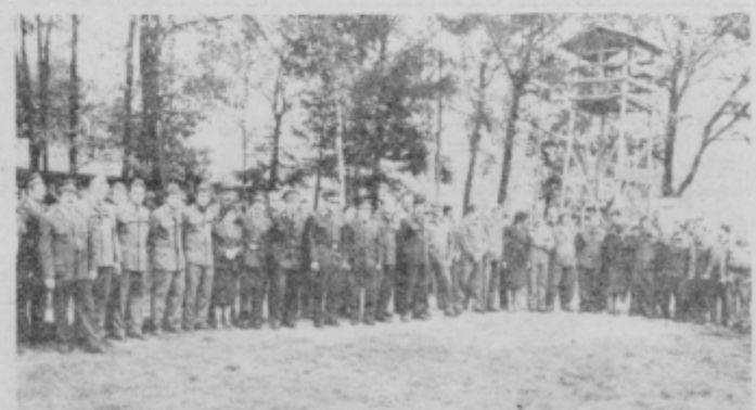
Udeleženci gasilskega srečanja v zboru po zaključku tekmovanja.

V paradnih uniformah so se gasilci zbrali že dopoldne in se med drugim pogovarjali o aktivnostih v mesecu požarne varnosti. Popoldne pa so se na športnem igrišču v Gerečji vasi udeležili še gasilskega tekmovanja, kjer so se najboljše odrezali člani IGD iz Impola in TGA pred člani IGD iz Ruš, Ravne in Köflacha. Po svečani razglasitvi rezultatov v prostorih lovskvega doma Kidričevo go gostitelji-gasilci iz TGA Kidričevo izročili vsem sodelujočim društvom spominska darila, gostje iz Avstrije pa so domačinom podarili tudi svoj znak.