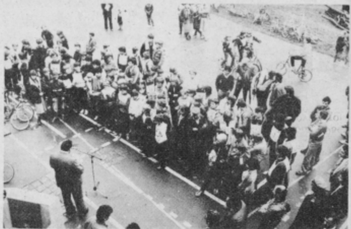
Udeleženci tekmovanja s svojimi mentorji, zbrani na prometnem poligonu pred samim pričetkom.

Tekmovalci so se najprej pomerili v izpolnjevanju pisnih testov o znanju cestno prometnih predpisov, zatem pa so dokazali še svoje znanje