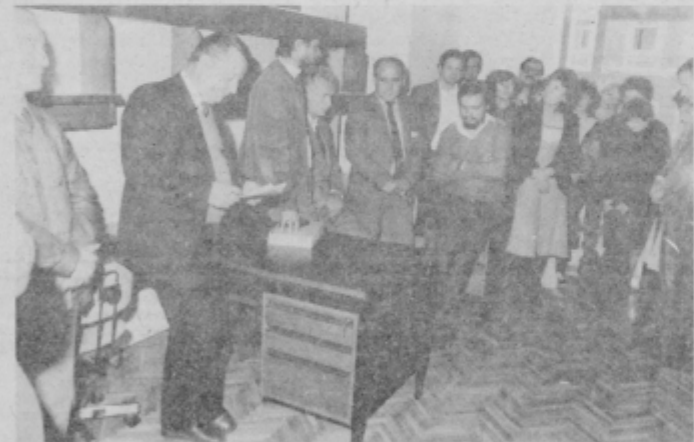
Slovesnost v prostorih novega dopisništva