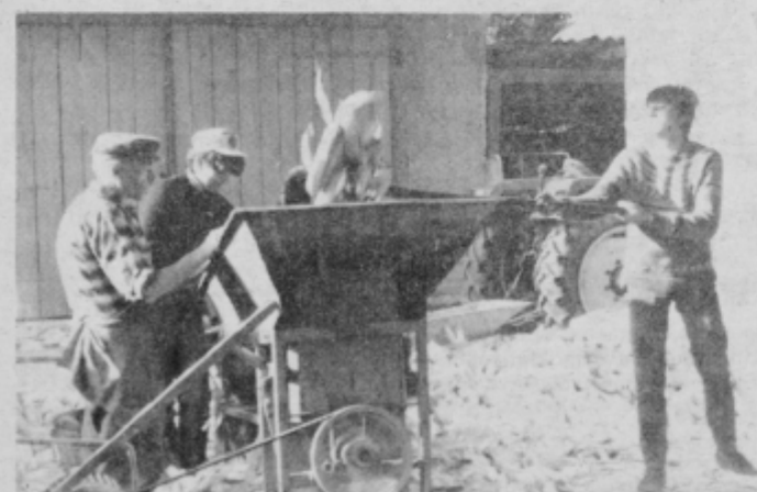
Stroj za ličkanje koruze — koristen in nevaren pripomoček.

Mehanizacija se je že krepko vrnila tudi v kmetijstvo. Brez nje si sodobnega kmetovanja seveda ni mogoče predstavljati. Poleg nedvomno ljubljenih koristi pa prinaša kmetovalcem tudi precej gorja. Predvsem stroji za ličkanje koruze, ki so lahko ob nepravilni uporabi zelo nevarni. Letos smo zvedeli že za dva primera, ko je stroj neprevidnim »strežajem« zmečkal ali potrgal prste. Ponovno opozorilo, da je potrebna previdnost, torej ne bo odveč. JB