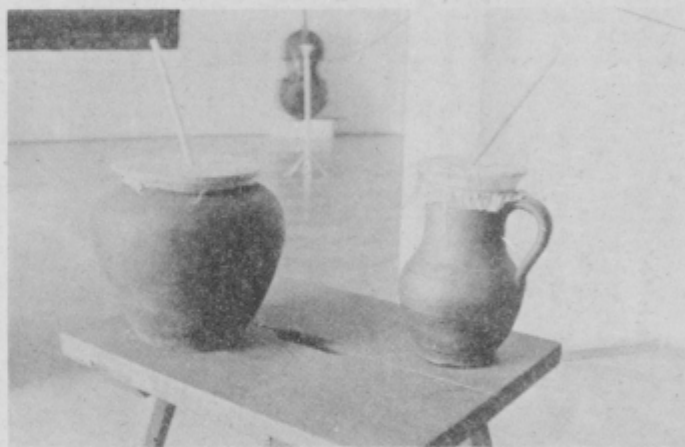
Lončena basa, fototeka etnološkega oddelka, foto Ralf Ceplak.

To glasbilo je bilo razširjeno skoraj po vsej Evropi. Tudi na Slovenskem je bilo v preteklosti precej v rabi, na kar kaže cela vrsta različnih imen po pokrajinah. Narejen je iz glinastega lonca, ki ima čez odprtino