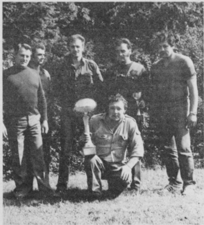
Ne samo na športnih tekmovanjih, enako uspešni so bistriški lovci tudi pri skrbi za gozdne živali in razvoj lovnega turizma

Skupno 43 lovskih družin, ki pokrivajo kar 155.703 hektarov skupnih površin lovišč, se združujejo z delom Gojitvenega lovišča Pohorje, ki opravlja lovsko strokovno delo in usklajuje gospodarjenje z divjadjo, kamor je vključen tudi lovni turizem. Kar 2545 lovcev je združenih v 43