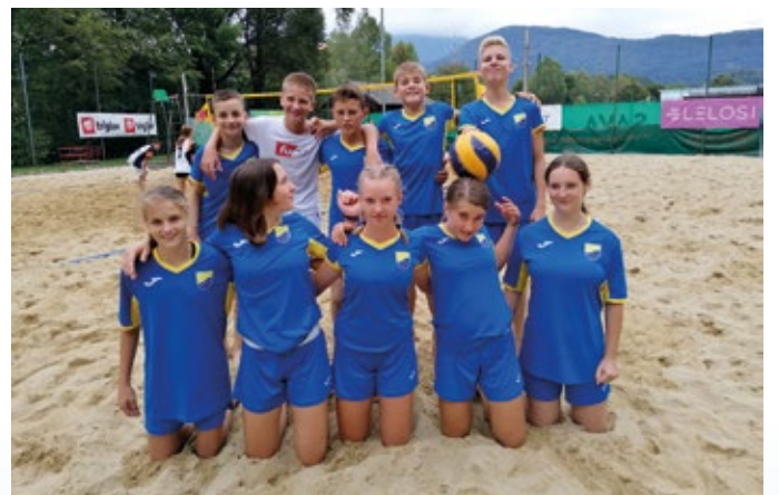
Dečki in deklice, odbojka na mivki

Ekipa nepopustljivih, borbenih in izjemno motiviranih učencev je osvojila naslov medobčinskega prvaka. V skupinskem delu so rumeno-modri suvereno premagali