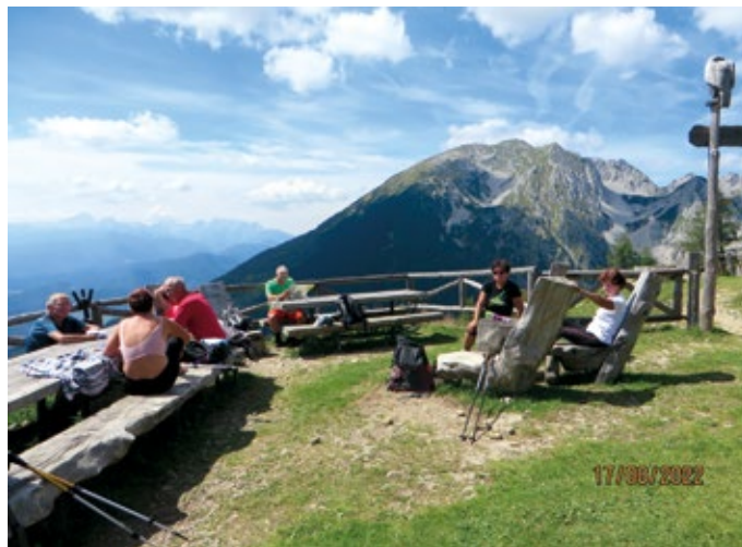
Kratek počitek pri Roblekovi kočici, zadaj masiv Stola

Nekaj dni pozneje nas je pot vodila na območje Begunjščice. Za izhodišče smo izbrali dolino Drage nad Begunjami. Računali smo na prijetno pot vsaj do planine Preval(a), pa smo se uštel. Zanimiva planinska pot je v zadnjih letih