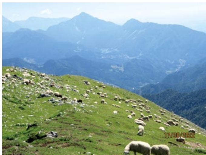
Trop ovac na pobočjih Begunjščice, zadaj Storžič, Tolsti vrh in Križka gora