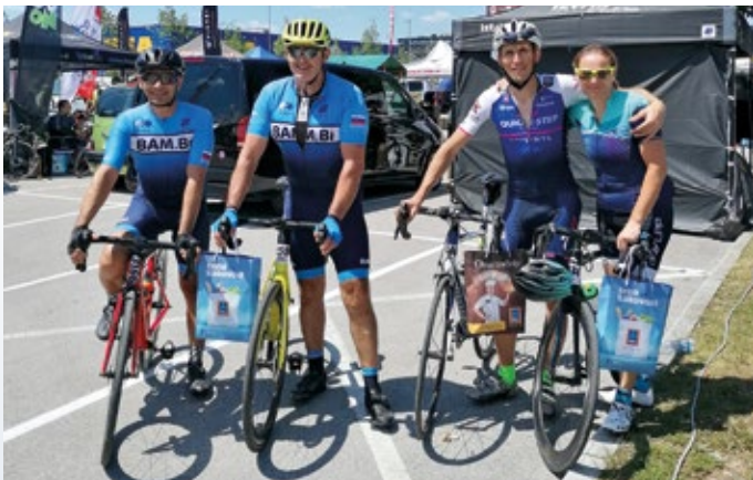
Občani Vodice na cilju Maratona Franja

Kolesarska sezona gre počasi h koncu. Večina tekmovanj in rekreativnih prireditev je izpeljanih. Kolesarji imamo sedaj pomembno nalogo pred novo sezono. Spočiti kolesarske mišice, servisirati kolo in z različnimi vadbami ohranjati kondicijo. Pri pripravi telesa se kolesarji najraje lotimo hoje v hrib, teka na suhem in teka na smučeh. V zadnjem obdobju pa so izjemno aktualni trenažerji, ki omogočajo virtualno vožnjo ali celo dirko. Se nam v prihodnji sezoni pridruži še kdo?