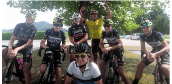
Učitelja športa z učenci OŠ Vodice na poletni vožnji