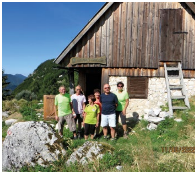
Pred lovsko kočo na planini nad Sočo