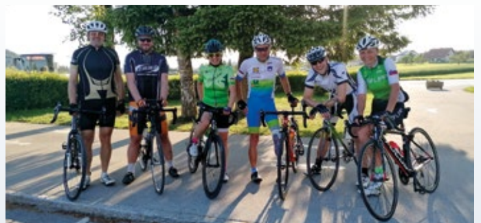
Vodiška runda 2022