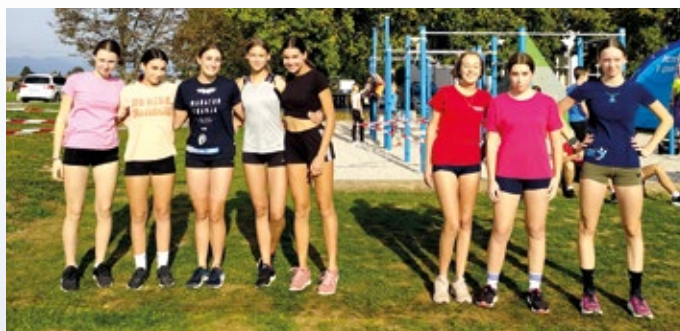
Kros, devetošolke pred štartom