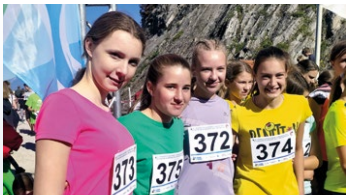
Starejše deklice pred startom gorskega teka