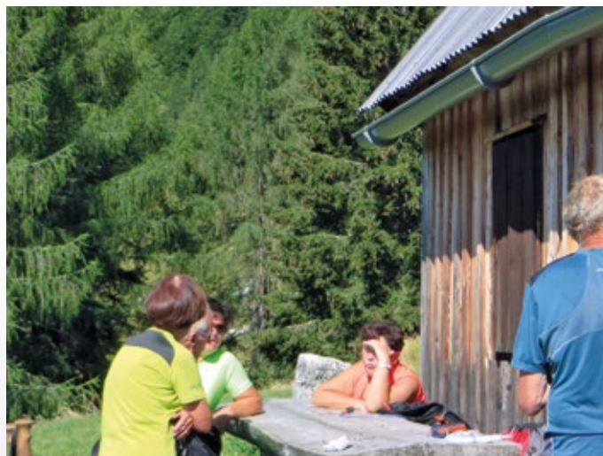
Lovska kočica z lovцем in zadovoljnimi pohodniki iz Vodice na planini nad Sočo