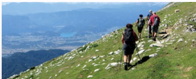
Prečanje proti vrhu Begunjščice, zadaj Blejsko jezero, Pokljuka in Julijci

Jesen je že tu in če bo vreme primerno in ne bo drugih obveznosti, bomo še nekajkrat letos obiskali, verjetno nekoliko nižje, a vendar zanimive vrhove, ki nam jih do sedaj še ni uspelo obiskati. Lahko se nam pridružite. Ko bo kaj novega, se znova oglasim.