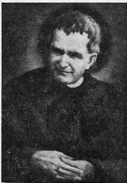
SV. JANEZ BOSKO (Božidar Jakac)

Ustanova je rasla. Rasli so tudi dečki. Nekateri so postali izvrstni delavci in pošteni državljani; drugi so postali duhovniki in se pridružili ustanovniku; še drugi, četudi ne duhovniki, so stopili v njegove apostolske vrste kot bratje pomočniki. Z ene strani ga je navduševal njegov spovednik, danes sv. Jožef Cafasso; z druge strani pa minister Rattazzi, ki je bil sicer hud antiklerikalec. Spodbujal ga je tudi papež. Don Bosko je pridobil na spoštovanju in ugledu pri vseh, ustanavljal je zavode izven Turina in pozneje tudi izven Italije. Je pa res, da mu tudi sedaj ni manjkalo težav in trpljenja; polena, in kakšna polena, so mu metali pod nogo celo tisti, od katerih bi bil po pravici pričakoval razumevanja, pomoči in podpore. Komodnejem in tradicionalistom je bil njegov novi način apostolskega dela kakor trn v peti.