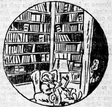
—Pri telefonu je vodja izposojevalne knjižnice, Vaše knjige terja nazaj!...

Lisjak je sklical kongres za rešitev zakonskega problema. Vsa bitja so prišla, samo človek ne. Poslal pa je brzojavko. Lisjak je podal poročilo. Zasukal je stvar tako, da se je dala različno razlagati: z da ali ne. Pričela je debata. Jegulja je zaklicala: „Najbolje je, se izmuzniti!“ — Pajklja je zamrmrala: „Jaz dedca snem, ko se ga naveličam.“ — Srnjak se je smejal: „Moja jih dobi po rebrih, če ne uboga!“ — Osel je dejal: „Najpametneje je, ne se oženiti.“ — Oglasila se je ovca: „Zakaj pa ne, gospod osel?“ — Osel je odgovoril: „Ker ne smemo biti tako neumni kakor človek.“ Na koncu je Lisjak prebral človekovo brzojavko: „Zal ne morem priti. Stop. Zena mi ne da dopusta. Stop. Sploh smatram vprašanje za nerazumljivo.“