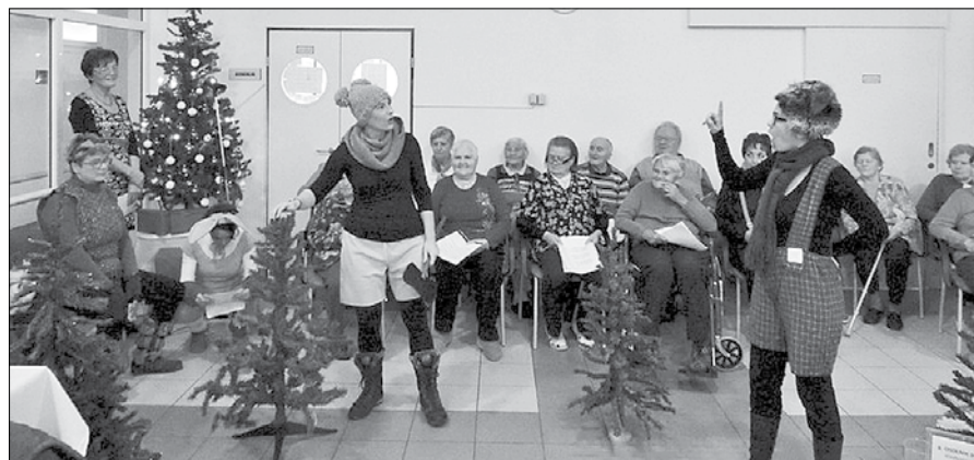
Pred božično večerjo so v jedilnici doma nastopile vzgojiteljice iz gornjegrajskega vrtca z igro.

December je bil za stanovalce centra starejših v Gornjem Gradu pester z raznimi dogodki. Nastopi številnih pevskih zasedb so stanovalcem popestrili kar nekaj popoldni. Med drugimi so pred božičnimi prazniki nastopili člani ansambla Mika Nas, ki so s svojo mladostjo in živahnostjo poskrbeli, da so marsikoga zasrbele pete.