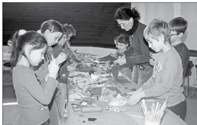
Otroci so ob animatorjih izdelovali novoletne okraske in dekorativne predmete iz naravnih materialov.