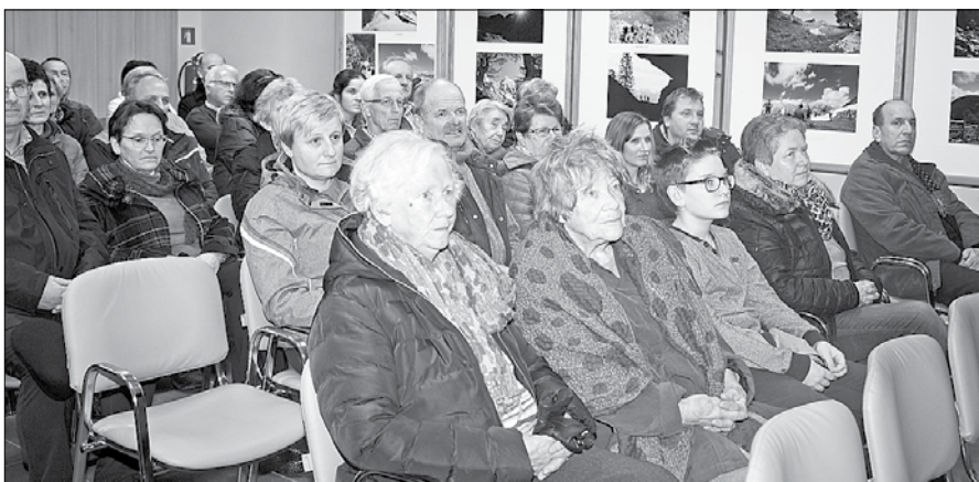
Številni obiskovalci so si ogledali potopisni film o Rdeči poti po Alpah preko osmih držav.