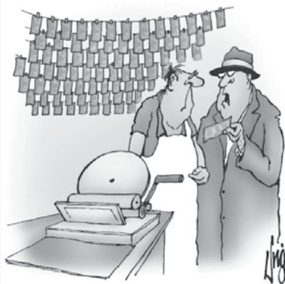
Euro na bankovcih se ne piše z v, sploh pa ne z w.

Goljuf v Nemčiji: „Kaj mi svetujete, da ne bom s finančnimi malverzacijami prišel v zapor?“