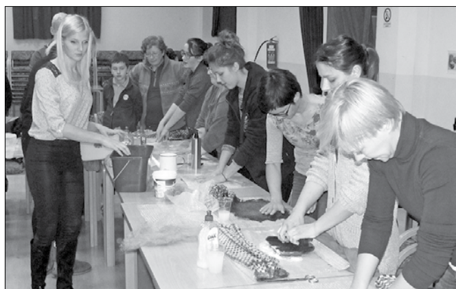
Delavnica filcanja je bila odlično obiskana.

Delavnica filcanja je s polno udeležbo potekala s pomočjo treh mentoric. Marjeti Fale sta priskočili na pomoč njuni hčerki Manca in Zala. Jezersko-solčavska volna je bila zastopana v barvah temno rdeče, sive in rjavo črne, v hladnem tonu je bila na izbiro še turkizna. Ob milu in vodi so nastajale polstene plasti za izdelavo prijete