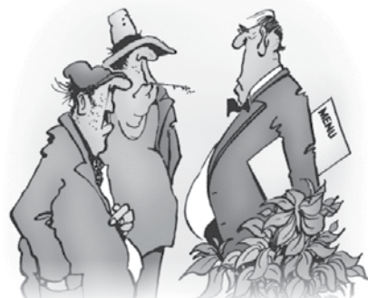
Ali imate mizo za dva blizu izhoda?

Tašče, ki so jezne na može, ki so vzeli njihove hčere, naj ne bodo, saj bi njih, a so bile že poročene.