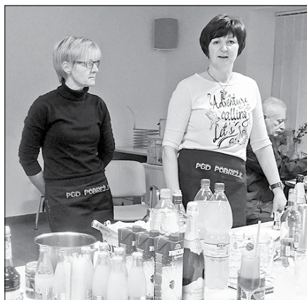
Članice PGD Pobrežje ob Savinji so predstavile nekatere recepte brezalkoholnih in alkoholnih koktajlov.

V CDM Rečica ob Savinji – Medgen borzi, kjer so v letu 2015 pripravili večje število dogodkov, ki so obogatili preživljanje prostega časa občanov in drugih, so lanskoletne aktivnosti zaključili 28. decembra s prikazom mešanja koktajlov.