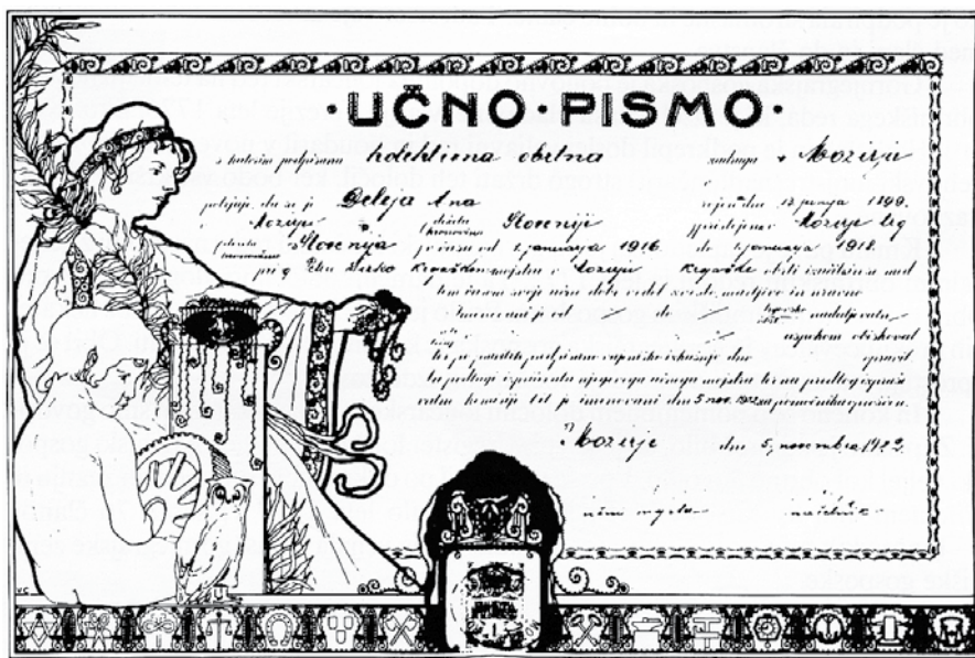
Učno pismo Kolektivne obrtne zadruge Mozirje iz leta 1922

Takoj po končani prvi svetovni vojni so obrtniki spet pričeli redno opravljati svoje posle. Številni od njih so padli v vojni, zato marsikje ni prišlo do obnove obrtne dejavnosti. Pa vendar je gospodarstvo do konca dvajsetih let postopno spet oživilo. V naših krajih je občutno upadlo tkalstvo, barvarstvo, usnarstvo, hitro pa se je razvijala kovinarska stroka.