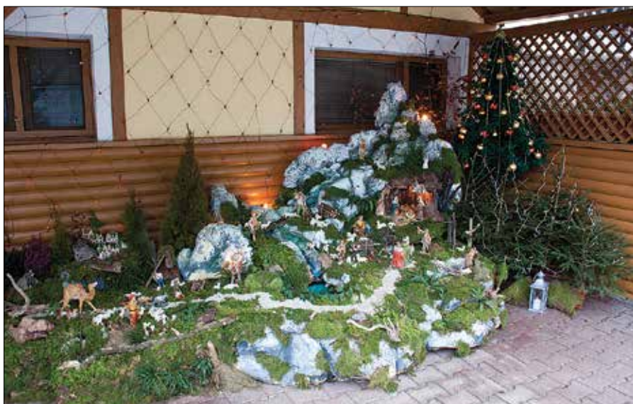
Jaslvice Ane Škotnik so impresivne, saj tekoča voda v bistrem potočku, strma »skalnata« pobočja, mah in drugo vzbujajo občutek resničnega naravnega okolja.