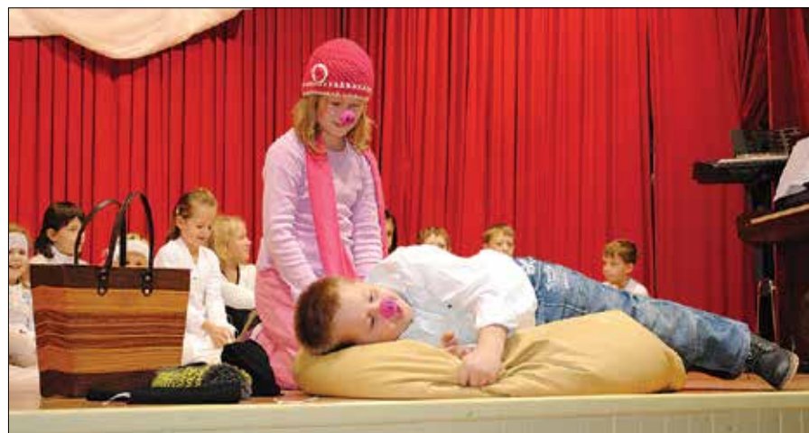
Šolarji so pripravili prijeten program, med drugim so odigrali igrico.

skega zbora, moškega pevskega zbora in članice ženskega pevskega zbora, vsi trije iz Bočne. Petje ima namreč v Bočni bogato zgodovino. Zbori so izvedli pester repertoar cerkvenih, slovenskih ljudskih pesmi in priredb.