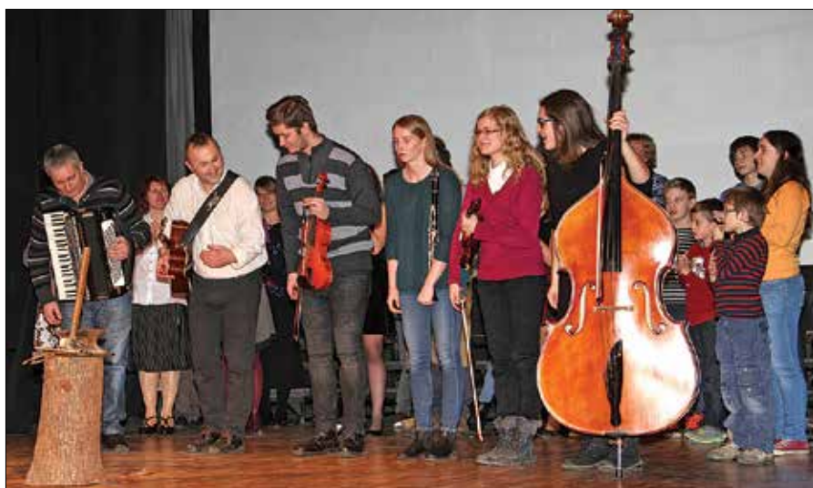
Dogajanje so glasbeno oplemenitili glasbeniki zasedbe Sekstet Zagatto.