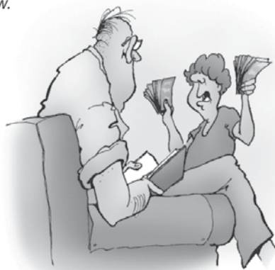
Rekel si mi, naj bom samoiniciativen, če bom potreboval denar, zato sem prodal tvoj avto.

Policist: „Prav, bom zapisal, da so cestarji po nemarnem skrajšali vašo vzletno stezo, da ne boste vi krivi.“