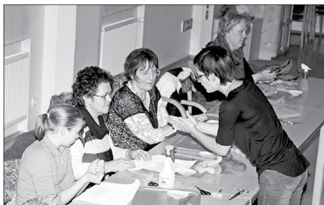
Prednovoletno ustvarjalno dogajanje v Lučah je zaključila delavnica izdelovanja nakita.

liko ogrlice. Uporabili smo sivo ali belo domačo volno, barvna je bila tokrat kupljena merino volna, ki je mehkejša na otip oziroma za kožo. Udeleženci so si izbrali vsak zase primerno barvno kombinacijo; prejo, nit in perlice ter se lotili šivanja. Izbrali so še nekaj lesenih perl,