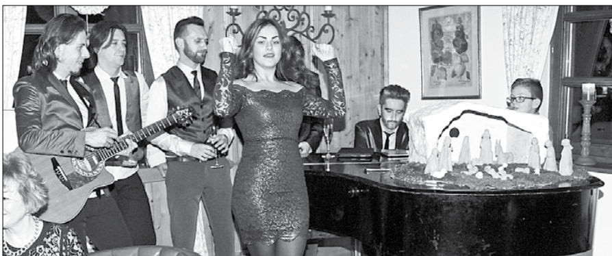
Goste, pretežno iz tujine, so v hotelu Plesnik na silvestrovo zabavali člani glasbene skupine Zodiac band.

Goste je zabavala glasbena skupina Zodiac band, kuhinja pa je za silvestrski meni ponudila zelo inovativen izbor kulinaricnih dobrot. V