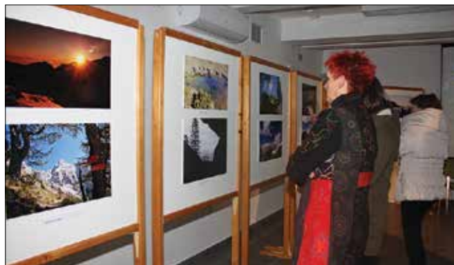
Fotografije, ki so nastale na izletih članov Planinskega društva Rečica ob Savinji v letu 2014, so si ogledali številni obiskovalci.

to, 26. decembra, v Medgen borzi je bilo zadnje dejanje fotografskega natečaja Lepote slovenskih gor. Razstavljenе fotografije so nastajale na različnih izletih društva v letu 2014. Svoja dela je na natečaj poslalo devet avtorjev.