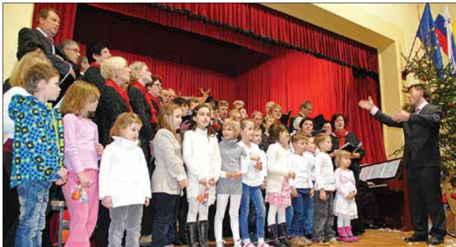
Nastopajoči so za zaključek koncerta skupaj odpeli dve skladbi.

Dogodek so popestrili člani cerkvenega pev-