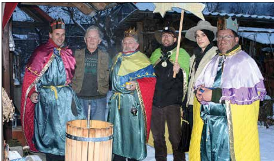
Svoje dni je mozirske kolednike na njihovi poti spremljal naš fotograf Ciril M. Sem (drugi z leve), letos je bil on deležen njihovega obiska.