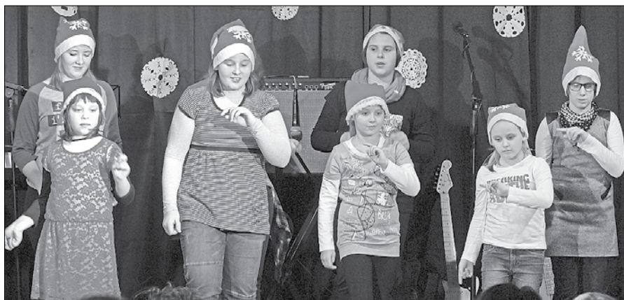
Najmlajši so na odru zapeli in zaplesali pesem Mi delamo snežaka.

programom, ki so ga pripravile članice društva, predstavili leponjivski osnovnošolci. Zaigrali so predstavo o Sneguljčici, ki so ji sledili številni plesni in pevski nastopi ter igranje na harmoniko in bobne. Zbrani so tako videli, koliko glasbenega talenta premorejo najmlajši.