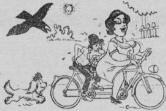
Raje bolj pritisni na pedale in ne išči vedno ročice za plin ...