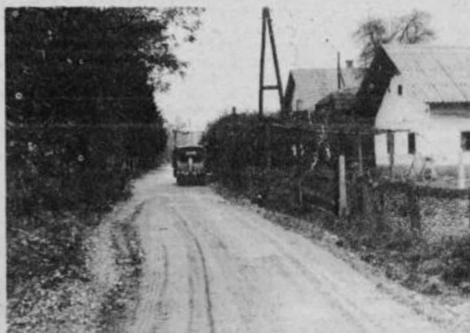
Modernizacija ceste v Lancovi vasi

Te dni so v zaključni fazi dela pri asfaltiranju vaške ceste v Lancovi vasi, v krajevni skupnosti Videm pri Ptuj. Dela izvaja tozd Nizke in hidrogradnje oziroma delovna organizacija Komunala, gradbeništvo in