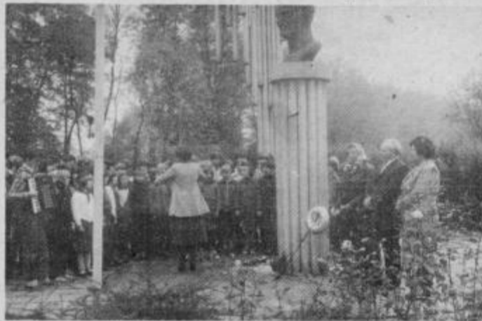
Učenci OŠ Boris Kidrič med izvajanjem kulturnega programa.