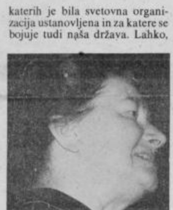
Na osrednji slovesnosti je klubovce pozdravila Vida Tomšič