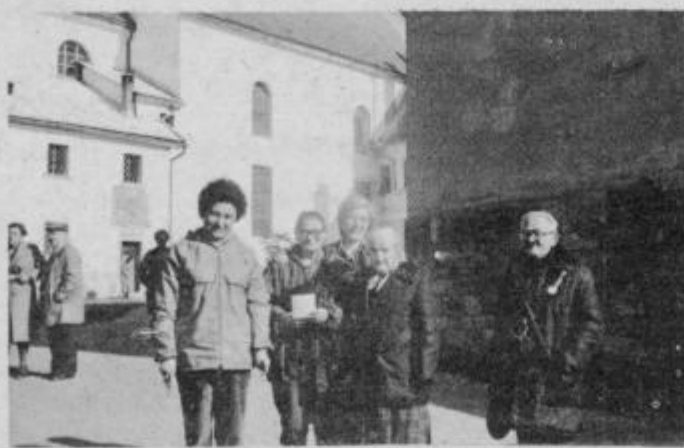
Planinci med postankom v Gradišču.

katere je bilo videti višje ležeči Lenart, Gradišče, Cerkvenjak. Na kraju kjer stoji novi razgledni stolp je osvoboditelj Maribora in Koroške, general, pesnik Rudolf Maister-Vojanov občudoval lepote okolice in goric ter zložil več pesmi, med njimi »Završki fan-