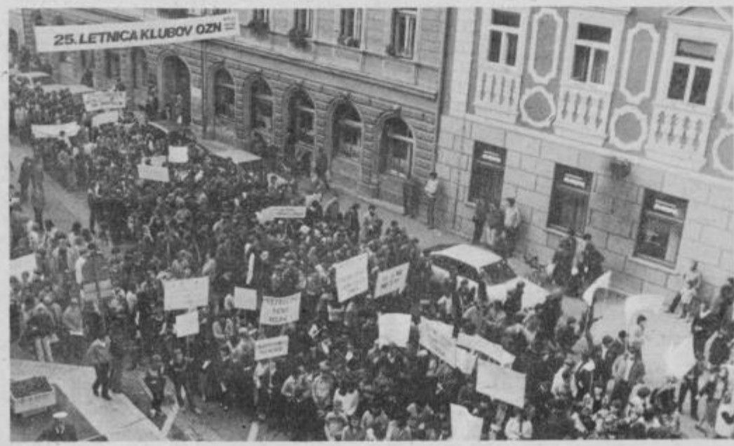
Med množičnim protestnim mirovnim pohodom, ki je potekal pod geslom „za mir in enakopravno sodelovanje med narodi“, so se udeleženci ustavili na Trgu mladinskih delovnih brigad v Ptuj.

V soboto, 30. oktobra je bil Ptuj dobesedno preplavljen z okoli 2000 udeleženci množičnega protestnega shoda članov klubov OZN iz vse Slovenije. Pred ptujsko pošto so se ob desetih razen predstavnikov klubov iz raznih krajev republike zbrali tudi pionirji — člani klubov OZN iz osnovnih šol in dijaki CSUI v Ptuj. S številnimi transparenti v rokah so v povorki krenili proti Trgu mladinskih delovnih brigad, kjer jih je pozdravila Diana Bohak, predsednica občinske konference ZSMS Ptuj. V imenu udeležencev shoda pa je pionirka Karmen Vinter prebrala protestno pismo, ki so ga naslovili na republiško konferenco SZDL. V pismu mladi odločno protestirajo proti vsem oblikam nasilja v svetu, proti apartheidu in vse nevarnejši oboroževalni tekmi. Odločno so obsodili tudi nedavni pokol Palestincev v Beirutu in se zavzeli za miroljubno politiko v svetu.