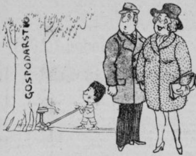
Pravi, da bo po svojih umskih sposobnostih in tehnični domiselnosti pomagal dvigniti ...

Če bi bil kdo nam gozdarjem povedal, da bo letos pomanjkanje kuriva, bi bili pravočasno načrtovali posek lesa za drva.