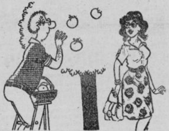
Ne vlagaj dela v obiranje, so sed, saj bodo kmalu same popadale dol; pa tudi ceneje je, če segnijo na tleh kot pa na kupih.