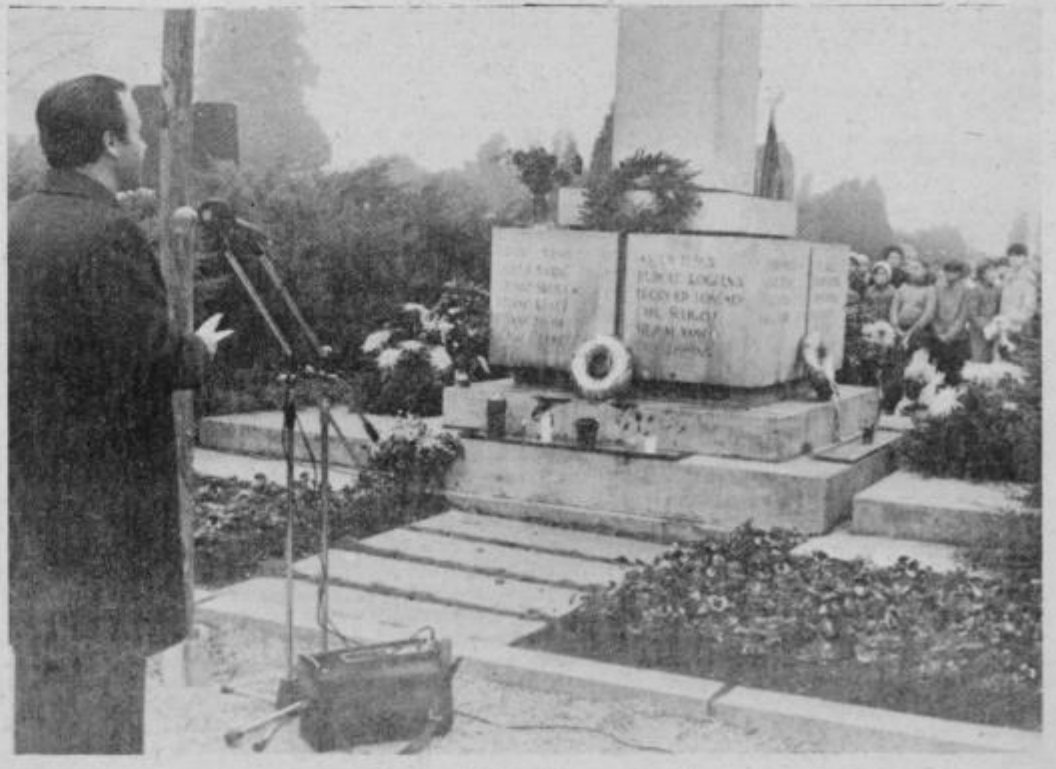
Ob spomeniku padlim na starem mestnem pokopališču med komemorativnim govorom Edija Kupčiča.