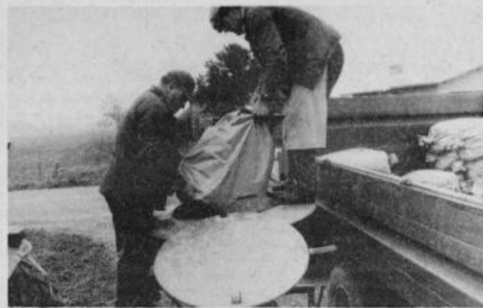
Kvalitetno seme in dobro opravljena setev — pogoj za dober pridelek.

Z nekajdnevno zamudo, pa vendar v ugodnih vremenskih pogojih je letošnja setev zaključena. V kmetijskem kombinatu so posejali pšenico na vseh predvidenih 1100 hektarih. Za zasebni sektor seveda ni povsem natančnih podatkov, lahko pa rečemo, da so tudi tu posejane precejšnje površine in to predvsem s kvalitetnim semenom. Zanimiv je tudi podatek, koliko kmetovalcev je sklenilo pogodbo o tržnem pridelovanju pšenice. V