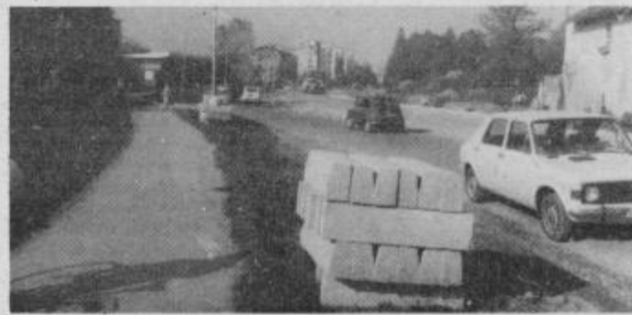
Pomankanje denarja ob obnovi Partizanske ceste je povečalo nevarnost prometa, saj niso zgradili steze za kolesarje in motorna kolesa.

Najbolj obremenjena, s tem pa tudi izpostavljena možnostim prometnih nezgod je Partizanska cesta, ki vodi od delovnega kolektiva IMPOL skozi novo naselje mesta, ki je tudi najbolj naseljeni del občinskega središča, do križišča s Titovo, to je v dolžini 2 km. Kljub temu, da so pred nedavnim Partizansko cesto renovirali ostaja za sedanji promet ozko grlo. Še posebno zato, ker pri obnovi niso upoštevali potreb kolesarjev in voznikov motornih koles po svojem pasu. Ti se morajo sedaj brez možnosti umikanja vključevati med oseb-