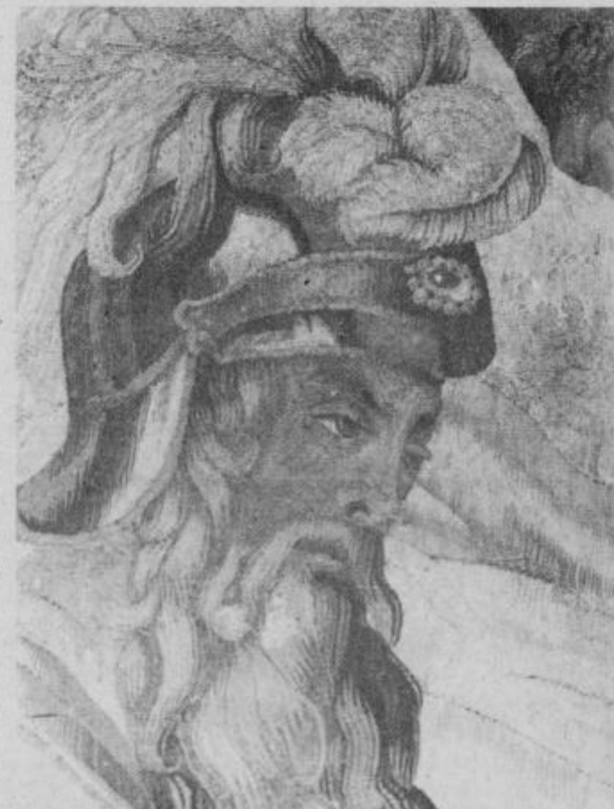
Detajl flamskega gobelina „Odisej ponuja Polifemu pijačo“ (inv. št. UO 488 T) iz Pokrajinskega muzeja Ptuj; fototeka kulturnozgodovinskega oddelka F 1100, foto Stanko Kos 1982