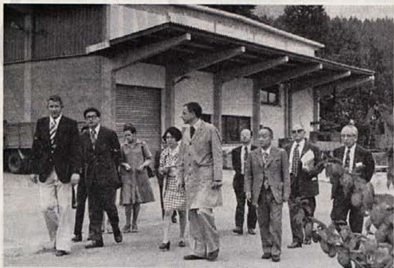
Japonska gospodarska delegacija v Elanu. Edino podjetje, ki so ga obiskali v Jugoslaviji, je bil »Elan«