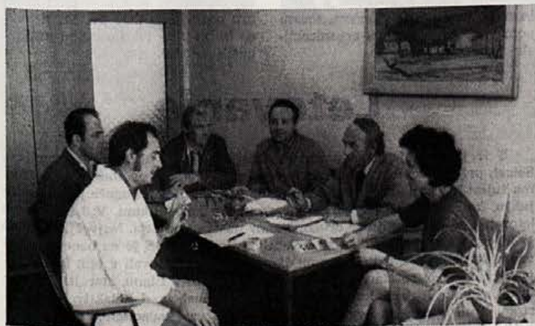
Uredniški odbor »Naše smučine« pri delu