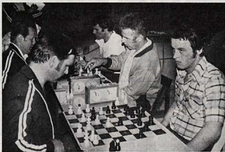
ŠAH – FINALE MOŠKI