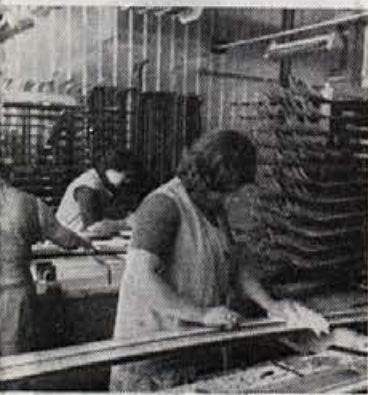
Pridne roke pri delu

Da bi bili stroški čim manjši, ne bodo vabljeni domači poslovni partnerji temveč kot že rečeno le inozemski. Ti naj bi že na dan pred proslavo ogledali podjetje v obratovanju, ta obisk pa naj bi obenem zamenjal vsako-letna posvetovanja, ki bodo to pot že v petek zvečer na Bledu ob navzočnosti svetovno znanih tekmovalcev — smučarjev, kjer si bodo izmenjali izkušnje in se med seboj strokovno posvetovali. To bodo v glavnem predstavniki večjih naših inozemskih odjemalcev smuči od katerih mnogo zavisi tudi naš obstoj.