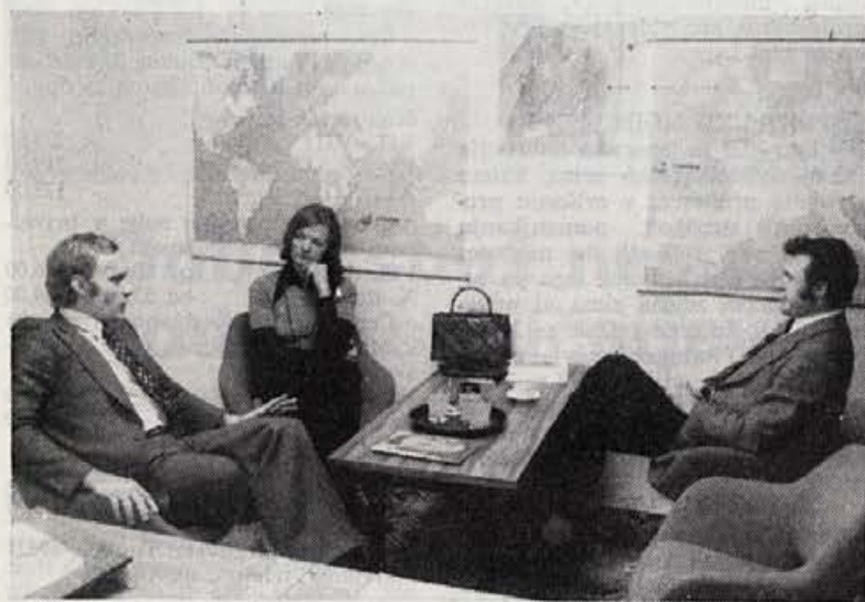
Poslovni razgovori so občutljivi in zahtevni. Od njih zavisi mnogo, kako, kaj in za koga bomo proizvajali