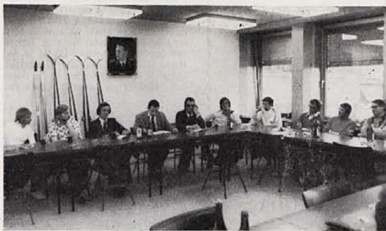
Začelo se je s tekaškimi smučmi na samem vrhu. Ali bo vendarle šlo?