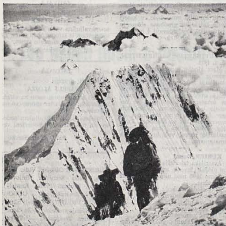
Gore nad 2000 m mamljivo vabijo tudi poleti. Na sliki so vrhovi kot otočki morja