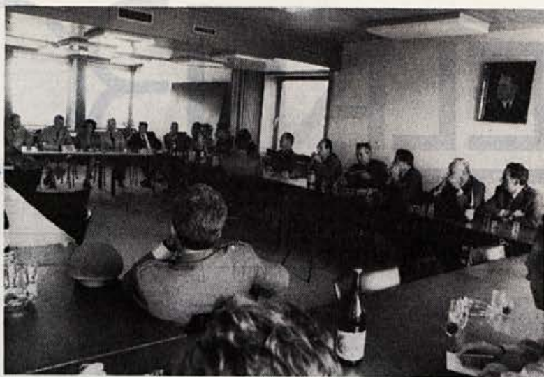
Predstavniki armije v razgovoru z našimi strokovnjaki

Splošna ocena dela naše organizacije v zvezi z aktivnim družbeno-političnim in gospodarskem življenju v podjetju je pozitivna. Vsekakor pa je nujno pristopiti k akciji, da se ugotovljene pomanjkljivosti, ki so bile nakazane v politični oceni in v sami diskusiji v zvezi z politično oceno, odpravijo. Ponovno je potrebno napraviti program dela in tudi pristopiti k izvajanju tega programa.