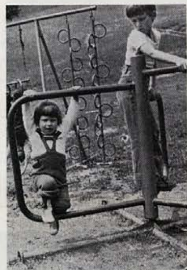
Detalj iz trim steze v Krplnu

— Člani DS podjetja se strinjajo, da prvi začno sami z udarniško akcijo za ureditev parkirnega prostora in apelirajo na vse ostale delavce, da se jim pridružijo.