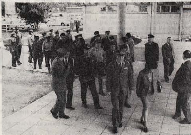
Predstavniki JLA ob prihodu v Elan. Skupina je štela 30 višjih oficirjev