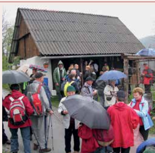
Pri Sikovškovih na Ojstrem se je porodila ideja o Pohodu po Anzekovih poteh, kjer je sedaj tudi prva postojanka pohoda. Iz 10. jubilejnega pohoda 2012.

Na poti nas pozdravijo prijazni in gostoljubni domačini. Za nekaj minut se ustavimo najprej kakopak pri Sikovškovih na Ojstrem, nekajkrat smo se ustavili tudi pri Štiglovih na Reki, kjer nas je