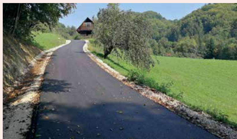
Do Žikovškovih oziroma Planinškovih na Ojstrem.

Brstnika, Doblatine in Požnice. Na tem področju bo občinsko vodstvo moralo storiti bistveno več kot sicer, saj je pravica do pitne vode ustavna pravica vsakega državljana (70.a člen).