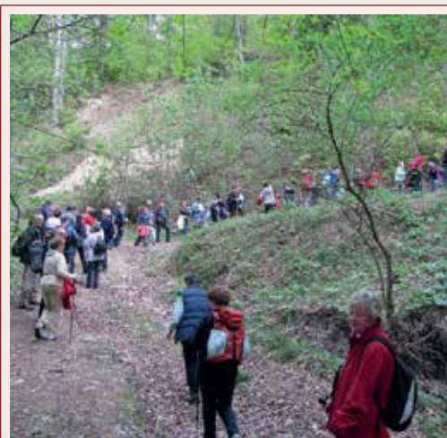
Pot nas vodi po strmih poteh proti Svetini. Posnetek iz 5. pohoda leta 2011.