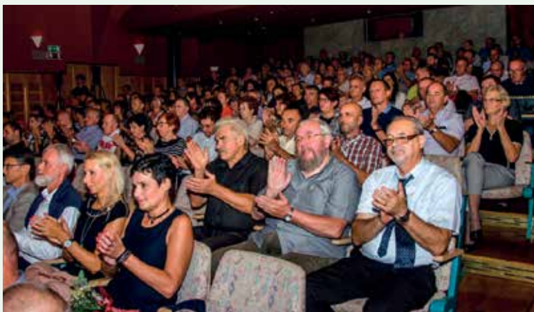
Vzdušje v dvorani Kulturnega centra Laško

Kot že pred nekaj leti, je tudi tokrat Komunala Laško ob soglasju Občine Laško in nadzornega sveta simbolično predala ključke starega komunalnega vozila za odvoz odpadkov kolegom iz pobratene srbske občine Trstenik.