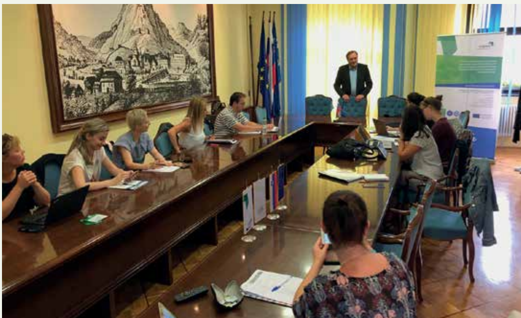
Skupina partnerjev projekta Interreg Clean v Laškem na delovnem posvetu z izmenjavo izkušenj ter dobrih praks.

le obstoječe materiale z visokim ogljičnim odtisom ob enakih oziroma boljših lastnostih. Namen projekta CLEAN je 4 odstotno zmanjšanje uporabe energije v javnih zgradbah ter zmanjšanje skupne