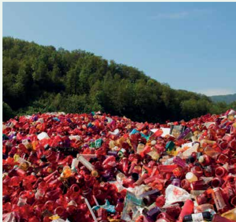
Vse večja grmada odpadnih sveč