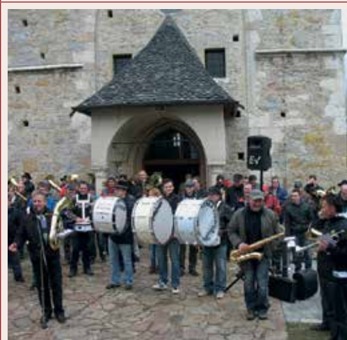
Pri cerkvi Marije Snežne na Svetini nas od leta 2012 pričakajo godbeniki iz Laškega, Štor, Šentjurja in Svetine.

pozdravila njihova, t.i. »Štiglova godba«, pa pri Slapšak v Kanjucah in na Velkem vrhu pri Pesjak, kjer je rodni dom Ivana Ulaga - Vrhovskega Anzeka.