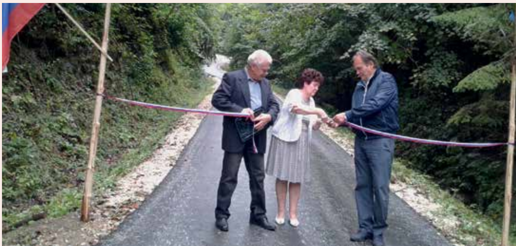
Otvoritev ceste Jepihovca-Kunšek-Lavrič

Na tej svečanosti se je zbralo okoli 50 udeležencev. V popoldanskem času je športno društvo organiziralo že 26. tradicionalni turnir v malem nogometu na igrišču osnovne šole, katerega se je udeležilo več nogometnih ekip iz bližnje in daljne okolice.