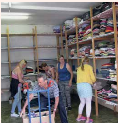
Iz skladišča z oblačili smo morali najprej izprazniti vse police.

Letošnje leto je za Območno združenje Rdečega križa Laško-Radeče in njen sedež tudi leto potrebnih obnov, ki pa so za naše skromne razmere povezane z velikimi finančnimi stroški. Med drugim smo tudi zaradi njih z deli kar nekaj časa odlašali. Po zamenjavi dotrajane plinske peči za centralno ogrevanje letos spomladi smo se v sredini septembra lotili prenove skladišča, v katerem imamo oblačila, obutev in posteljnino za naše upravičence, ki potrebujejo tovrstno pomoč. Skladišče s površino dobrih 30 kvadratnih metrov je dobesedno klicalo po obnovi, saj so se v njem že pričele nagibati police in je vse bolj postajalo nevarno za kakšno nesrečo. V njem so še namreč police, ki smo jih v skladišče v stavbi Rdečega križa pred 33 leti preselili iz nekdanjega objekta Perdihovih, v katerem so naši predhodniki že imeli skladišče z oblačili za pomoč upravičencem. Dela se postopoma zaključujejo in pred nami bo še en velik zalogaj, da vanj razvrstimo in zložimo več tisoč kosov oblačil na nove police in regale.