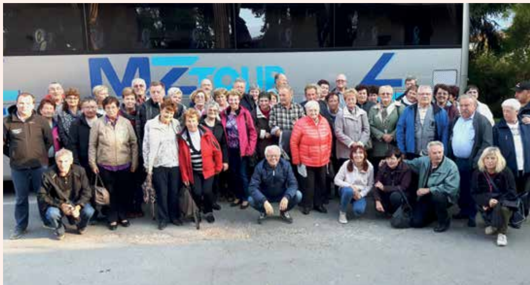
Spominska fotografija iz letošnjega druženja na ekskurziji članov RK Rečica.