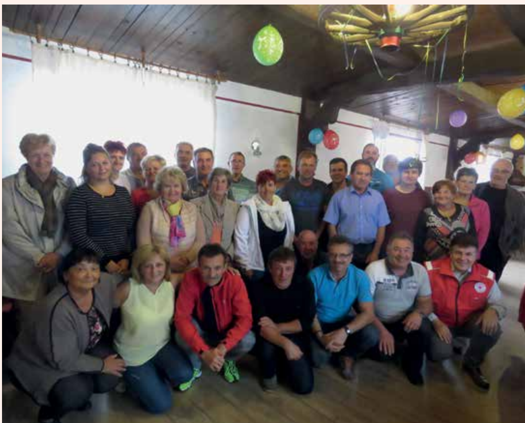
Krvodajalke in krvodajalci Rimskih Toplic in Sedraža po prejemu priznanj