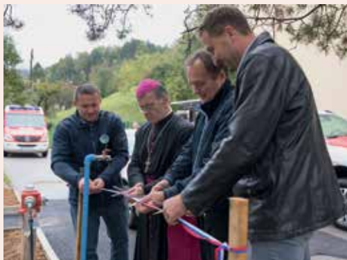
Nove investicije so bile predane namenu ob praznovanju krajevnega praznika.

Čas jeseni je čas darov in v letošnjem letu lahko opazimo, da se je narava do-dobra potrudila in nas bogato nagradila s pridelki. Lahko pa tudi opazujemo zaključek večjih investicij, ki so se odvijale v naši krajevni skupnosti. Zaključena je obnova lokalne ceste Deb-ro-Gratex , zaključuje se izgradnja vodovoda Zg. Rečica , zaključena je obnova dela javne poti Jager-Zagorišek in skladno s finančnimi možnostmi obnavljamo posamezne od-seke makedamskih javnih poti.