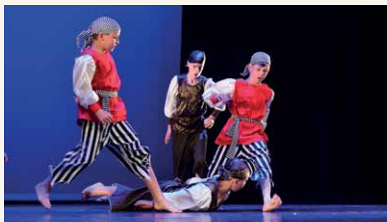
Gibalnica za fante – »Potopljeni pirati«

Uvrščeni so bili plesalci 2. razreda sodobnega plesa s koreografijo »Meduzasto« in skupina Gibalnica za fante s koreografijo »Potopljeni pirati«. Uvrstitev na državni nivo pomeni izbor najboljših plesnih skupin iz cele Slovenije in prejetje zlatega priznanja.