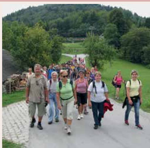
Še malo, pa smo na cilju - od pokopališča proti cerkvi na Svetini iz leta 2013.