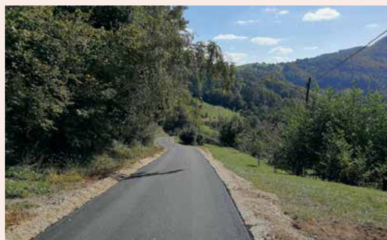
Do Jakoba Ojsterška v Rifengozdu.

Prav tako tudi sodelovanje z Rdečim križem Laško, kjer sodelujemo na področju pozornosti do naših ostarelih krajanov starih 80 in več let. Dobro deluje tudi naveza s Stikom Laško in Komunalo Laško, kjer smo našli skupni jezik pri več projektih. Sicer pa se trudimo vzdrževati primerne kontakte z vsemi zainteresiranimi, saj menimo, da se v naši družbi in v našem okolju vse premalo pogovarjamo. Marsikatero zadevo in načrt bi dosti lažje izvedli, če bi se pristojni ljudje in ostali krajanji znali ustrezno pogovarjati. Saj je vsak dogovor dober šele takrat, ko sta obe strani zadovoljni.