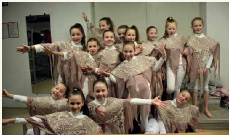
Sodobni ples 2. r. – »Meduzasto«

V začetku oktobra je v Velenju potekala državna revija otroških plesnih skupin »PIKA MIGA 2018«.