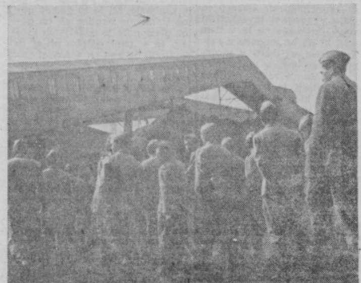
Obisk iz ptujске garnizije JA v Kidričevem

ktivna za še več podobnih srečanj in razgovorov, ki bodo koristili starejšim in vojakom JA pri njihovem delu. VJ