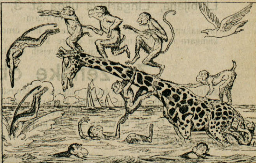
Slika h kopalni sezoni v Kamniški Bistrici.