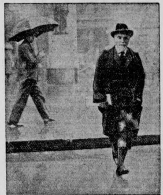
Guverner »Angleške banke«: Montague Norman na vsakdanjem potu v urad. Kakor vidimo, se Norman tudi v dežju ne vozi z avtomobilom na delo, marveč si obleče nepremočljiv plašč in podviha hlače.

Zaradi ogromnega dela nemala romarjev v Rim je sv. oče odločil, da ceremonijo poljubljanja roke odpravi. Da zadosti temu doseadanemu običaju, je moral sv. oče obhoditi vse dvorane, kjer so čakali nanj romarji. Nestrpni romarji se tudi tesno zgrinjajo okoli njega. Vse to je za sivolasega moža zelo utrudljivo. Poslej bo sprejemal sv. oče romarje le v velikih dvoranah in govoril z njimi s prestola.