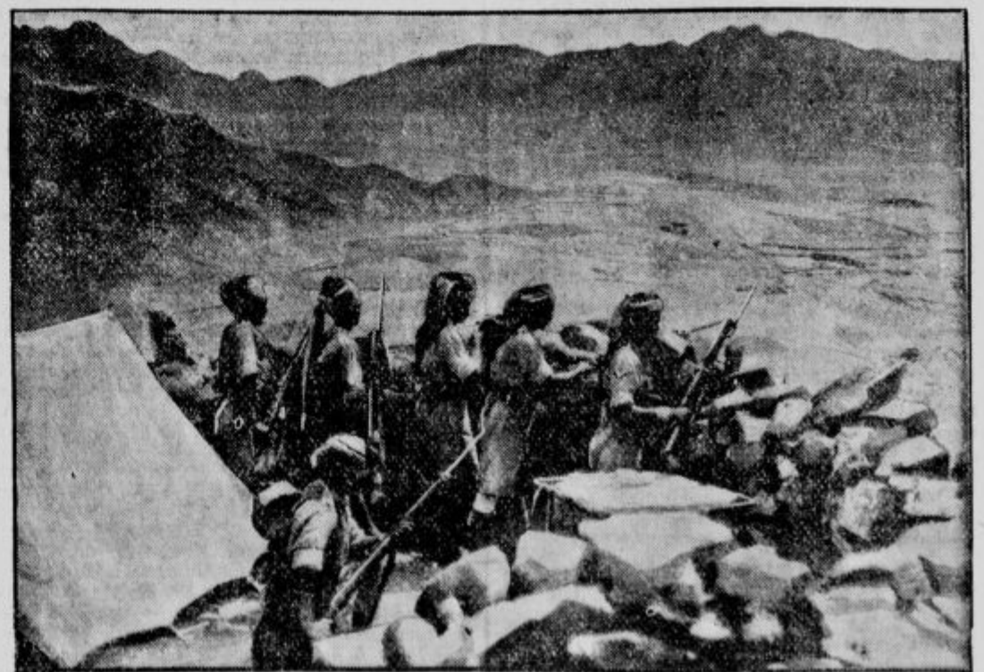
Novi krvavi upori v Indiji: Britako-indijski ostrostrselci obvladujejo dolino blizu prelaza Khaiber na severozapadni indijski meji.