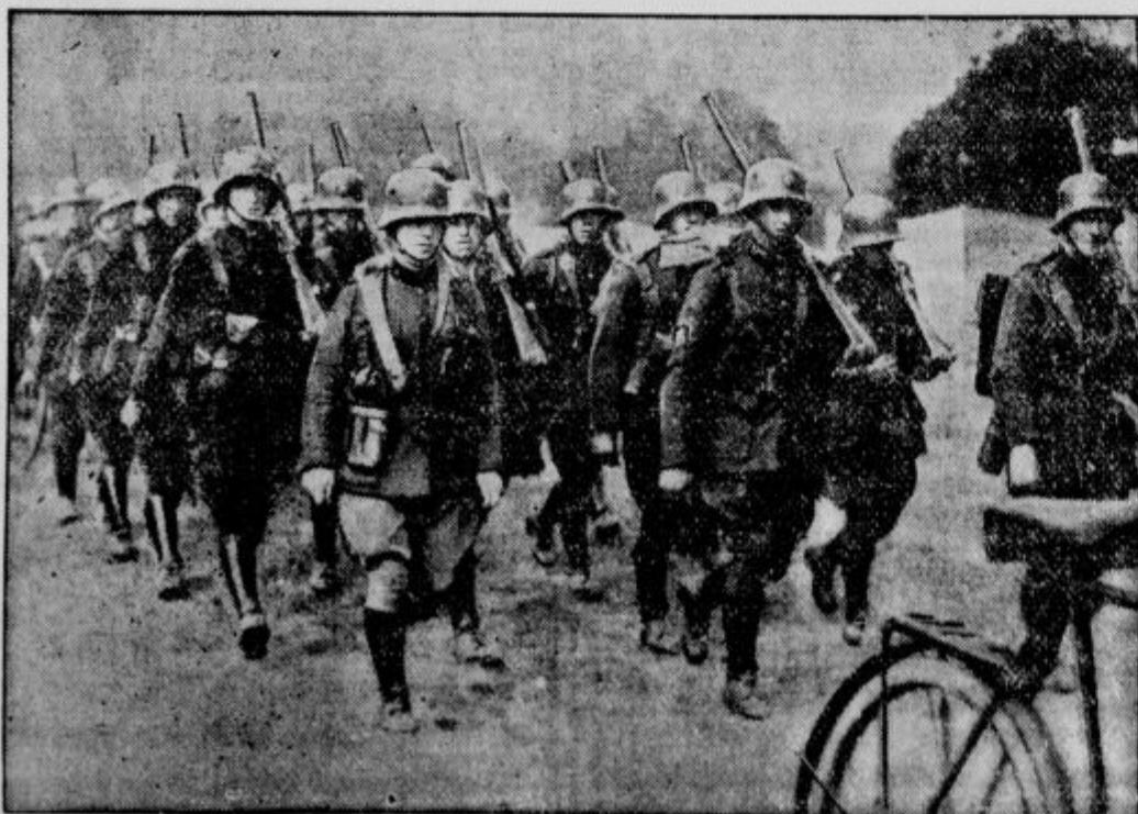
Prvi manevri irske armade: oddelek pehote v vojni opremi.