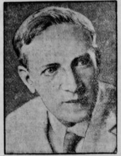
Upton Sinclair, znameniti ameriški romanopisec, ki kandidira za guvernerja Kalifornije. V svojih spisih se včasih približuje že komunizmu, a sedaj kandidira za demokratsko stranko.

Usoda teh beguncev je bila strašna, smrt in vsakršna poguba, lakota in mraz so neumljeno redile njihove vrste. Koliko jih je ostalo na poti — nihče ni štel in nihče ne ve. Ena izmed skupin je dospela v Harbin v nepopisnem položaju. Pa tudi tu jo je še čakalo zasledovanje sovjetskih straž in stotero drugo gorje. Usoda te skupine na harbinskem prizorišču je ovekevečil film »Begunci«.