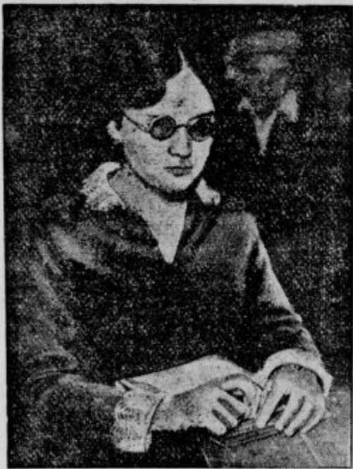
Slepa tipkarka — zmagovalka na tekmi: 14-letna slepa deklica, ki je na pariških tipkarskih tekmah dosegla prvo nagrado. Ni le tipkala najbolj hitro, marveč tudi najbolj točno.

Eno je bilo vsem nemškim naseljencem na Ruskem lastno: nemirna popotna kri in neutušljiv pohlep po grudi. Če jim je postala domača vas pretesna, se je del mlajšega rodu izselil, da le ne bi postal doma nemanič. Izprva so našli dovolj zemlje v bližini prvotne naselbine; in res je vsaka stara vas ustanovila po nekaj novih vasi. Ob koncu 19. stoletja so se pa začeli seliti dalje in dalje od domačije: v Sibirijo, kjer je nastalo na stotine nemških vasi, pa tudi v Kanado, Združene države, Brazilijo in Argentino. Zemlje, veliko, zelo veliko zemlje se je hotelo tem Hesencem, Palatonom in Švabom, da so ji s svojim plugom komaj prihajali na kraj. Ni je nemške naselniške skupine, ki bi bila s toliko gorečnostjo, tako obsedeno trebila in kolonizirala kakor ruski Nemci. Pri