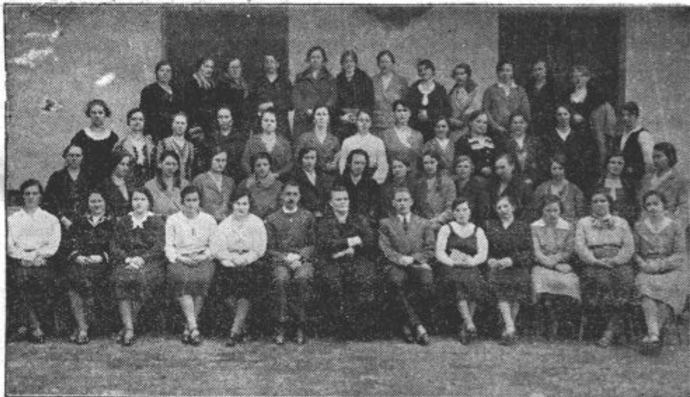
Udeležence prosvetno-organizatoričnega tečaja, ki se je z odličnim uspehom zaključil 13. t. m.

Zborovanje se je vršilo v najlepšem redu, udeležilo se ga je nad 80 članov, članic in njihovih