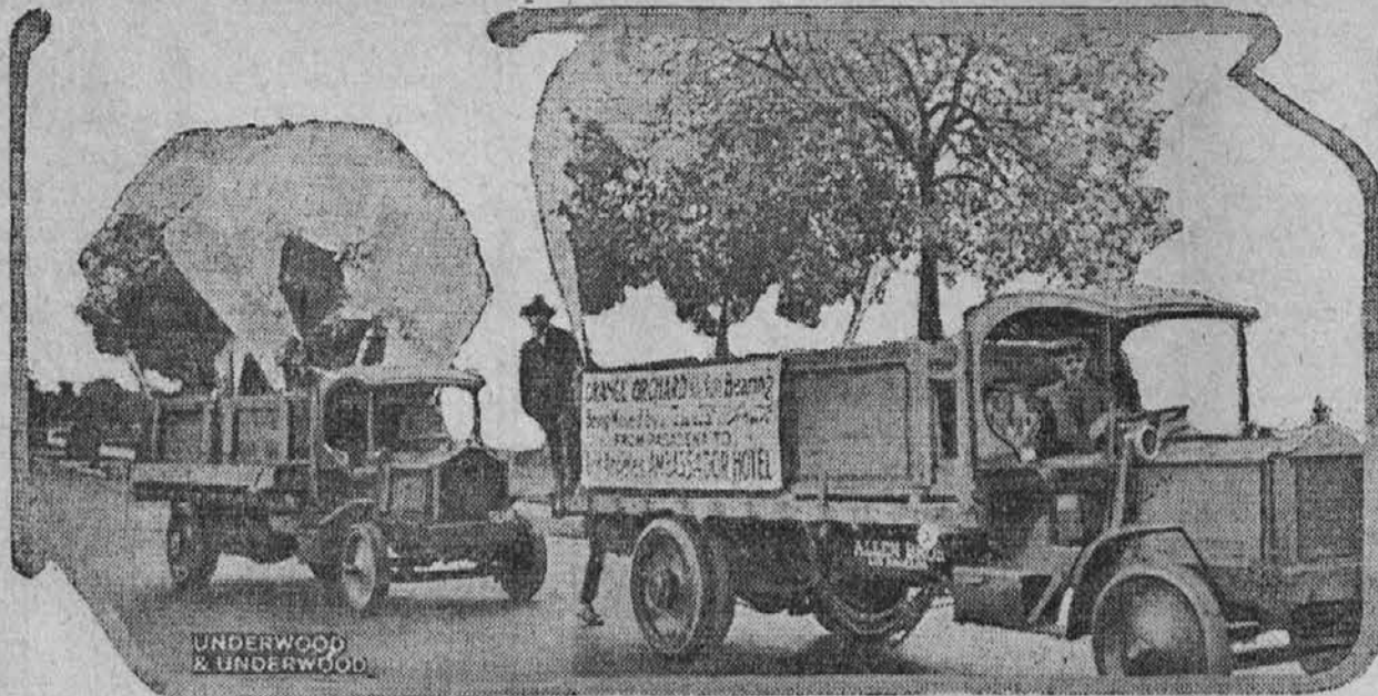
V južni Kaliforniji je bilo pred kratkim dokazano, da se more popolnoma dorasla oranža drevesa presaditi...