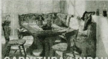
GARNITURA LINDAU komplet 135.700 SIT