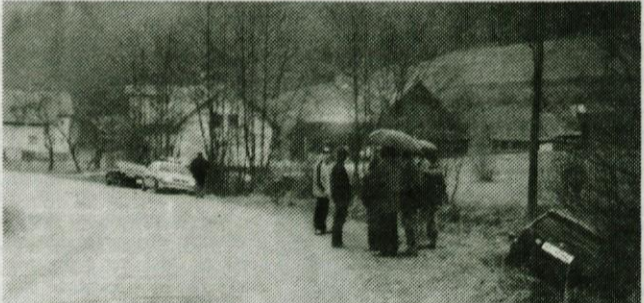
PAST POD KAVRANOM - marsikateri voznik, ki od Kavrana navzdol proti Soteski preveč pritisne na plin in na levem ovinku, zlasti v dežju, zleti v graben. To se je dogodilo tudi na deževno nedeljo, 5. aprila, okrog poldneva neprevdnu vozniku iz Murske Sobotle.

Da morajo naši gorski reševalci posredovati tudi na našem najbližjem hribu - Starem gradu, kaže dogodek, ki se je zgodil 3. marca, ko je starejši možki na poti na Stari grad padel in se tako poškodoval, da se sam ni bil sposoben vrniti v dolino. Pomagali so mu policisti, gorski reševalci in reševalci iz kamniškega zdravstvenega doma. Nekaj dni kasneje, 6. marca, zvečer pa je pri pokopališču na Žalah obležalo 14-letno dekle, ker je zaužilo preveč alkohola. Tokrat opitosti niso bili krivi gostilničarji. Policisti so ugotovili, da se je dekle napilo iz svoje steklenice, ki jo je prineslo s seboj od doma. Reševalci so jo onemoglo odpeljali na zdravljenje na Pediatrično kliniko v Ljubljano.