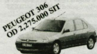
PEUGEOT 306 OD 2.275.000 SIT

POSEBNO UGODNE CENE ZA MODELE NA ZALOGI!