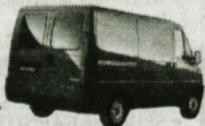
PEUGEOT BOXER OD 2.583.000 SIT (s 5% PD)