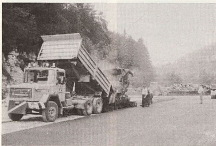
Asfaltiranje je bilo opravljeno v dogovorjenem času.

V TOZD TPI in žaga Soteske so se v zgodnjih jesenskih dnevih pojavili stroji Cestnega podjetja iz Novega mesta z namenom, da pripravijo in prevlečejo z asfaltno maso cca 6000 m 2 površin. Že dalj časa so TOZD pestile težave, kako se izkopati iz preostalega blata, ki se je ustvarjalo predvsem na skladišču hlodovine ter prenašalo na ostale asfaltno površine. Na skladišču hlodovine so bili vsled tega sila slabi delovni pogoji, tako za krliščne delavce kot za delavni stroj VOLVO, katerega nenehno lahko vidimo na temu delu TOZD-a. Zaradi tako slabih delovnih pogojev je DS TOZD v začetku leta 1980 sprejel plan investicij in investicijskega vzdrževanja v katerem je tudi plan ureditve navedenih delov TOZD. Na osnovi sklepa, je bila podpisana pogodba s Cestnim podjetjem za asfaltiranje planiranih površin v znesku 1.800.000,00 din. Tako kot je bilo dogovorjeno in zapisano se je Cestno podjetje, kljub slabim govoricam katere krožijo v zvezi s tem podjetjem, izkazalo z dogovorjenimi termini kakor tudi z ažurnim izvajanjem del. Pri sami pripravi terena so se pokazala nekatera dodatna dela oziroma nepredvideni izkopi, kateri bodo povzročili tudi dodatno finančno obremenitev za TOZD.