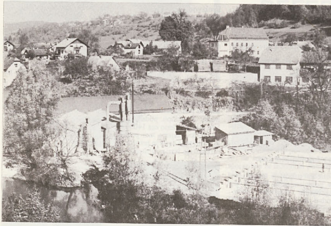
Pogled na TOZD TG Dvor. Bodoča ribogojnica je „tik ob plotu“ TOZD.

Današnji obisk smo namenili TOZD TG Dvor. Tovarna gugalnikov na Dvoru pri Žužemberku je ena od manjših TOZD v naši delovni organizaciji. Da bi izvedeli, s kakšnimi težavami se srečujejo pri svojem delu, smo zaprosili vodilne in družbeno-politične delavce, da nam opišejo svoje delo in težave s katerimi se srečujejo. Ljubezljivo so se odzvali na našo prošnjo in povedali