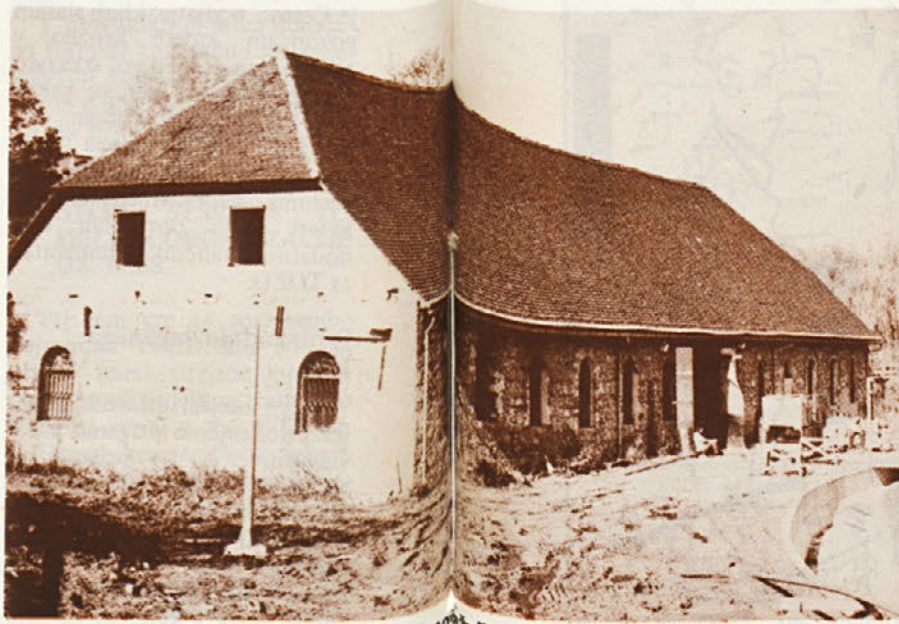
Zunanost proizvodnih prostorov.