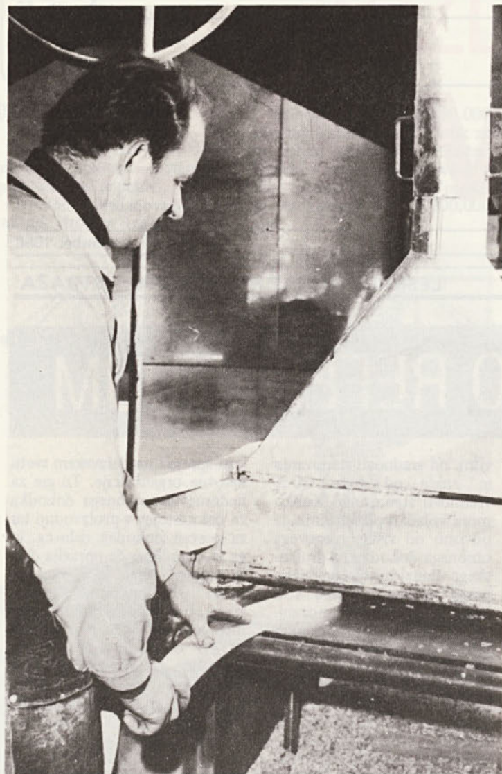
Delavec ob stroju v TOZD TG Dvor. V šali je bilo rešeno, da je stroj še iz „francjožefovskih“ časov.