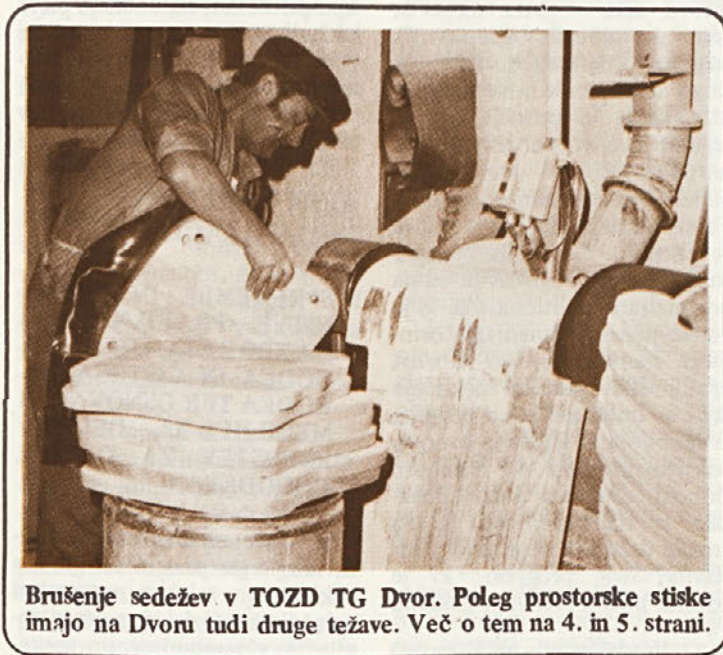
Brušenje sedežev v TOZD TG Dvor. Poleg prostorske stiske imajo na Dvoru tudi druge težave. Več o tem na 4. in 5. strani.

Ta samoupravni sporazum ureja vse prejemke, ki jih delavci prejemamo iz sklada skupne porabe, kot so: regres za letni dopust, jubilarne nagrade, nagrade ob odhodu pokoj, vprašanje izgradnje in nakupa počitniških kapacitet, regres prehrane na delu, razne dotacije in pomoči, kulturno življenje v TOZD in razvoj kulture, športno rekreacijske dejavnosti itd. Do sedaj smo imeli deloma to materijo urejeno v samoupravnem sporazumu o skupnih osnovah in merilih za