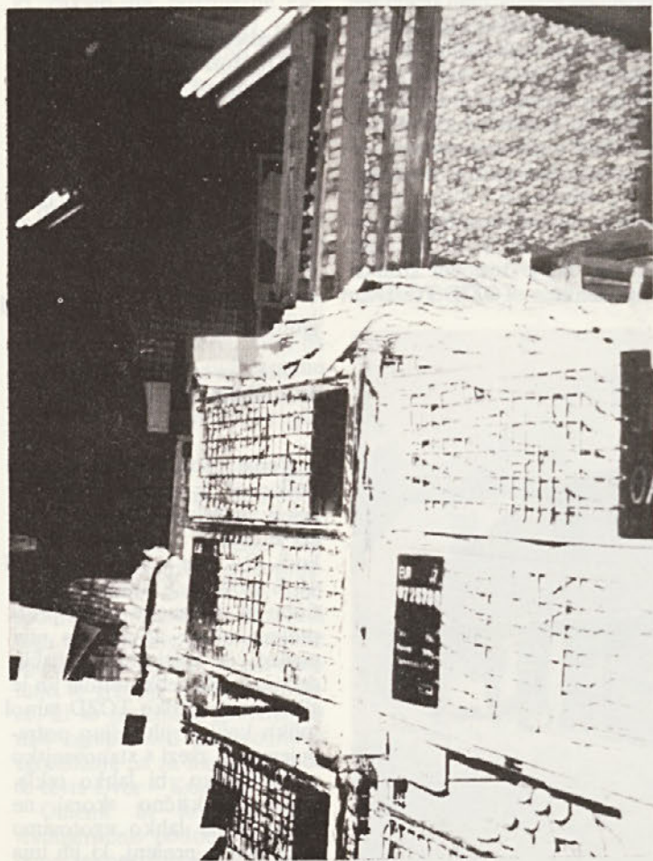
Mnozica elementov čaka na kompletacijo. Posnetek je iz preutesnjenega skladišča v TOZD TG Dvor.

Ti tova misel in delo sta bila dosledno razredno opredeljena. Kot komunist – revolucionar je navdihoval in vodil ves naš družbeni razvoj. Njegovo delo živi in mora živeti, da bi, kot je dejal o pomenu 5. državne konference KPJ Stevan Doronjski, lahko na svoj lastni revolucionarni na čin živela naša družba in naša zveza komunistov.