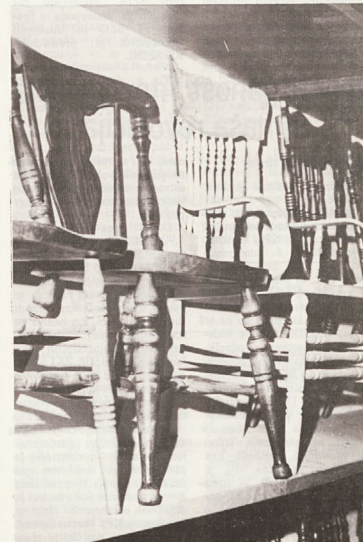
V skromnem razstavnem prostoru si obiskovalec lahko ogleda proizvode TOZD.