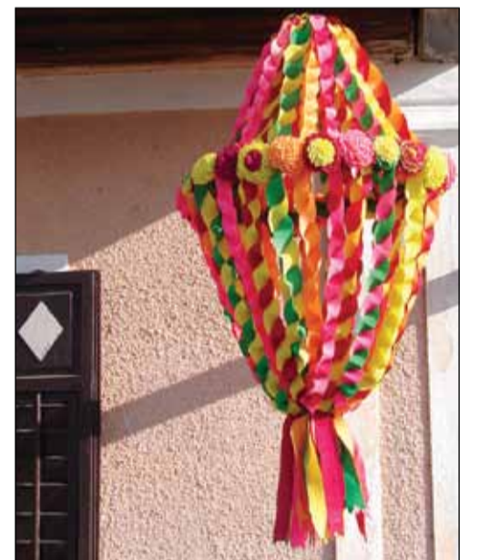
Kot vsako leto, so bile tudi letos domačije lepo okrašene.

Osrednja predstavitev vseh nastopajočih je bila v središču vasi pred Mercatorjevo trgovino, zaključek pa v večnamenski dvorani. Tam je bila pripravljena pogoštitev, organizatorji pa so podelili tudi denarne (od prvega do četrtega mesta) in praktične nagrade (za peto in šesto mesto). Nagrado za prvo mesto je prejela skupina Grozdje Juršinci, za drugo mesto pa skupina Turški napad na Ptujsko Goro KTD Soviče Dravci. Tretje mesto je pripadlo Medvedkom Pujem iz Stojncev in četrto Nagošejskim picekom. Nagrado za peto mesto so podelili skupini Safari tour Haloze, za šesto mesto pa Čebelarju in njegovim čebelicam. Podelitvi