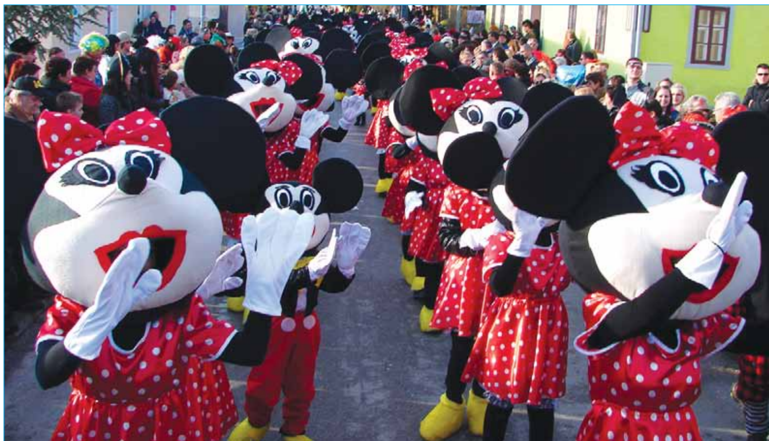
Miki miške in Miki mausi iz stojnskega Sigeta – zmagovalna skupina 21. markovskega fašenka

Tudi to leto je bila povorka vsebinsko razdeljena na tri dele (šolske skupine, etnografski in karnevalski del). Na čelu so bili učenci osnovne šole Markovci in