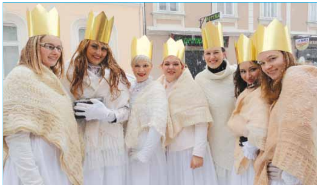
V FD Markovci se je poleg kopjašev letos organizirala tudi skupina vil.