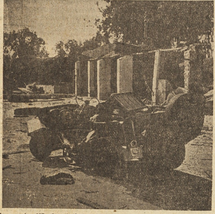
Gaza, prizorišče številnih incidentov na izraelsko-egiptovski meji, ki resno ogrožajo mir v tem delu sveta in koristijo le sovražnikom narodov, ki živijo na Blžnjem vzhodu

Spor med Japonsko in Ameriko, ki ga je povzročil Dulles s svojim arogantnim nastopom, bodo po vsej verjetnosti kmalu ugledili, toda japonski delovni ljudje, ki so sedaj na lastni koži spoznali, kakšni odnosi vladajo med državami v »svobodnem svetu«, se ga bodo še dolgo spominjali.