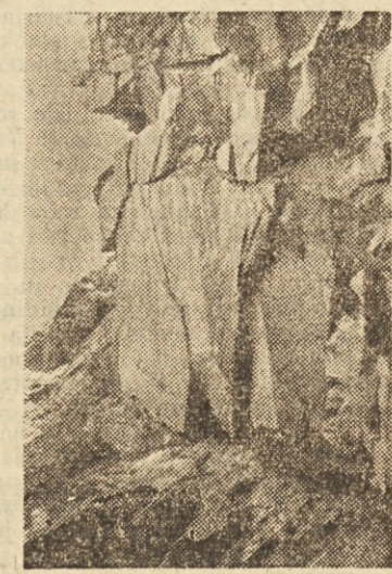
Poglejte, kako nevarne skale. In tu delajo delavci vsak dan.

Poglejmo, kakšno pripombo so zapisali takrat predstavniki podjetja k temu zapisniku. Dobe-sedno tole: »Z ozirom na ugotovitve vzrokov nezgode, s katerimi se podjetje v celoti strinja,