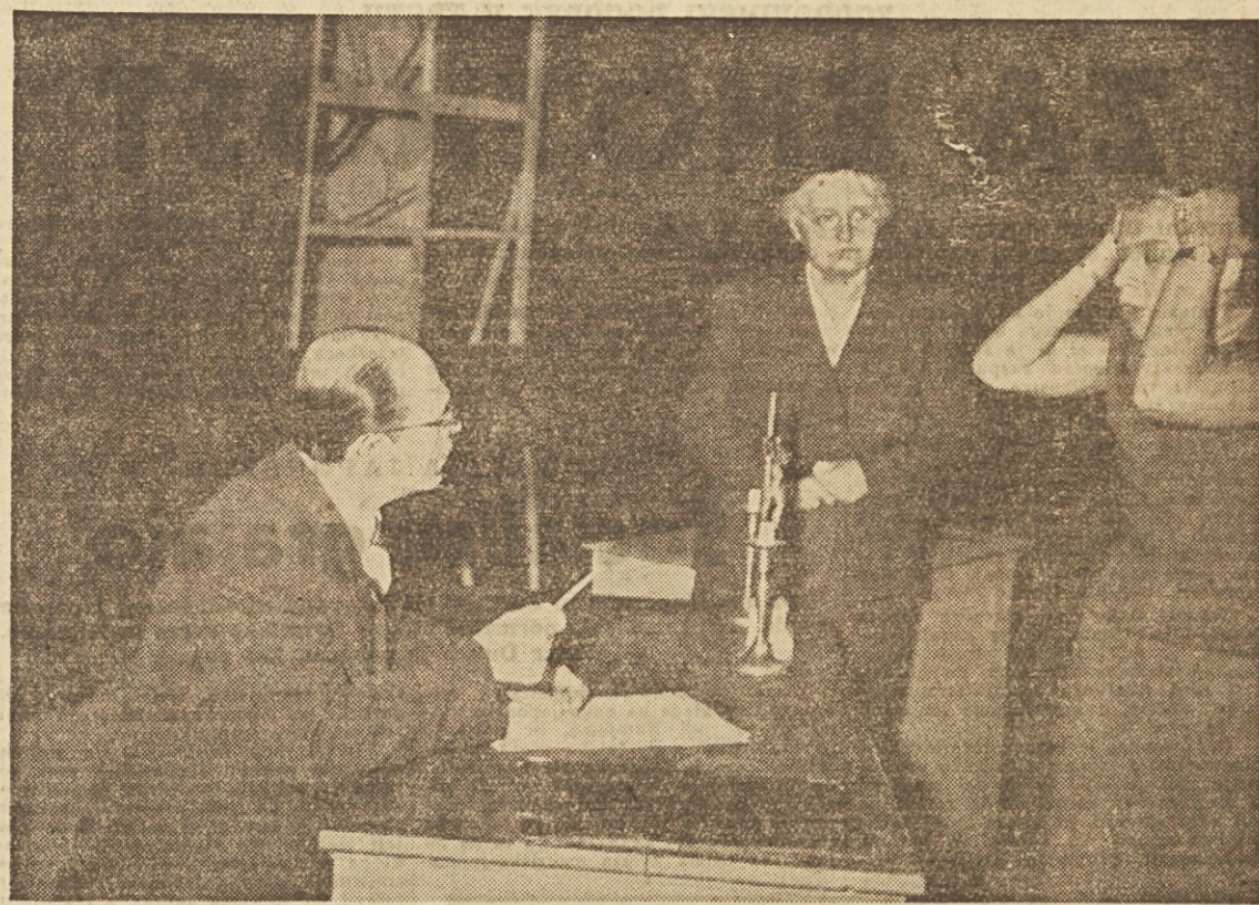
Ze 29-krat je dramska družina »Svoboda« v Zgornji Šiški uprizorila Tiemeyerjevo »Mladost pred sodiščem«. Dne 18. t. m. pa jo bodo uprizorili še v ljubljanskem Mestnem gledališču. S tem je dramska družina dobila veliko priznanje in želimo ji, da bi jo tudi tokrat uspešno zaigrali.

Nekaj bolje je v Hrastniku, vendar tudi tam izobraževalno delo kljub trudu nekaterih tovarišev še ni v pravem razmahu. Po vsem tem je mogoče ugotoviti, da se društva niso dovolj zavzemala za razširitev izobraževalne dejavnosti in izgleda, da jim tega pre ne bo mogoče doseči, dokler ne bodo temu delu posvetili tolikšne pozornosti, kot jo posvečajo na primer razvoju ostalih društvenih sekcij. Kajpak, kot rečeno: vsega tega ni moč opraviti v nekaj mesecih in do tega še in še proučevati gradivo kongresu in obeh posvetovanjih iz tega izluščiti najprimernejše oblike in jih uveljaviti v njihovih krajih.