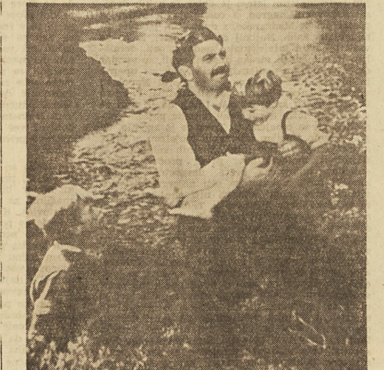
Prizor iz filma »Ugrabitelj«

»Svoboda« v Lobnici-Smolniku je kot ena sama družina. Vsi okoliški delovni kolektivni ji radi pomagajo, ker se zavedajo, da se v društvu najbolj vzgajajo. In še to: Za knjižničarja novoustanovljene knjižnice so postavili mladega človeka-delavca. Morda je še neizkušen, toda kot se je 76 mladincev naučilo peti, nastopiti na odru, igrati na glasbilo, tako se bo tudi mladi knjižničar naučil urejati knjige in kar je najvažnejše, svetovati bralcem, kaj naj čitajo.