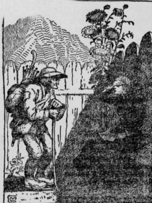
Bliskoma mu je iztrgala pismo iz rok in zaupila: »Jezus, Marija, Jožef! — sam pošilja — to je njegova pisava!«

zasledovati naprej. In iznova so šli na svoje delo. Nekoliko globlje v gozdu so našli zopet sledove Francetovih velikih čevljev; z vso svojo izvedenostjo so mogli iz teh spoznati le toliko, da je France šel navadnih korakov v smeri proti stezi, ki vodi k »slepemu Bogu«. Za lučaj kamna daleč od tega mesta je ležal na tleh košček bele svile. In na tem mestu, kjer vodi ravno pot skozi gozd, so prenehali vsi sledovi. Možje so iskali še pol dne, prebrskali so vsak grmiček, pretipali vsako skalno votlino, vsako razpoko v kamnu so pogledali, duplino pri »slepem Bogu« so preiskali do zadnjega kotička celo večkrat; vse Špikove skale, vse njegove kamnite klopi jim niso mogle dati odgovora, nemí Špik je molčal in možje, ki so prišli v gozd z nado, da najdejo Franceta ali vsaj pot do njega, so morali zapustiti gozd zopet sami, negotovi, kaj se je zgodilo z Bregarjem.