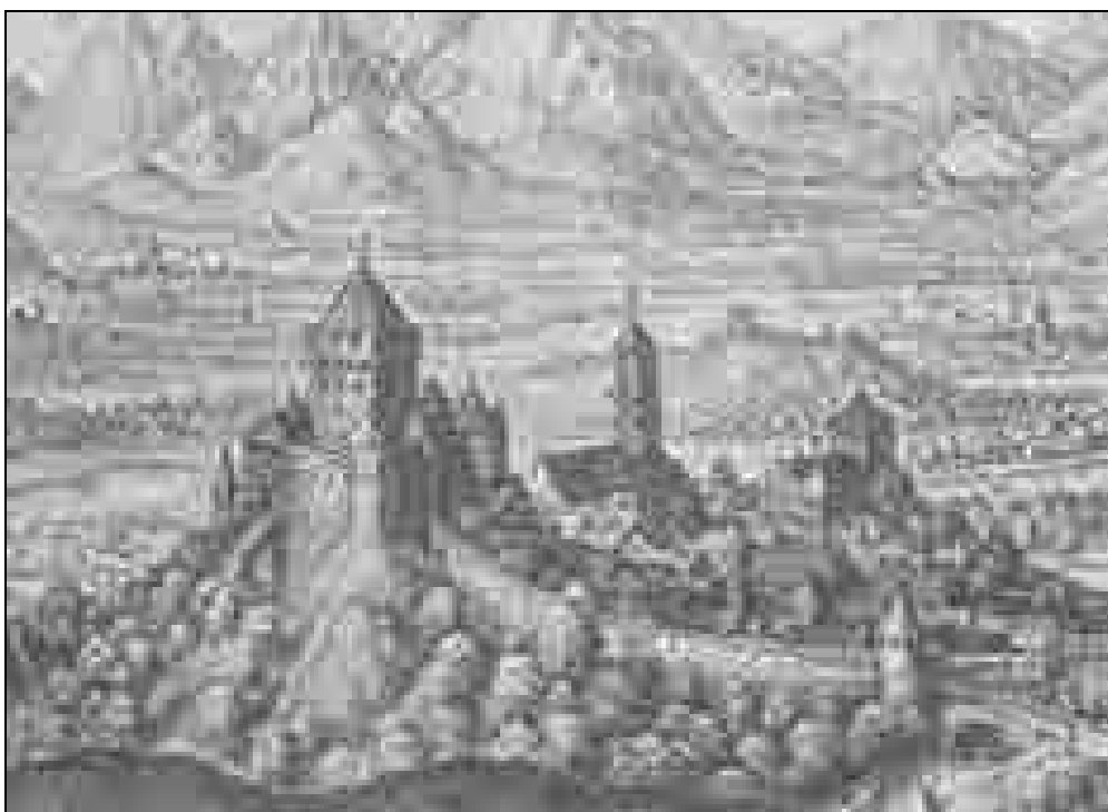
Matthäus Merian, Škofja Loka (izrez), 1649, bakrorez.

oziroma prikazovanje značilnosti zemeljskega površja, zlasti s kartami in zemljevidi (beseda izvira iz grščine: topos – kraj, latinsko: topographia – krajepis, topographus – krajepisec). Umetnostna topografija pa zajema sistematični popis krajev, naselij, lokacij ali arhitekturnih spomenikov, tudi njihov slikovni prikaz oziroma prikaz v obliki upodobitev.