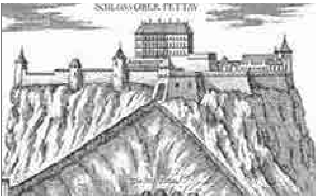
G. M. Vischer, Grad Gornji Ptuj , 1681, Topographia Ducatus Styriae , bakrorez, okrog 1681.

Nobena likovna upodobitev ne more biti povsem enaka resničnemu videzu oziroma realnemu stanju arhitekturnega objekta. Izdelana je po prevladujočih merilih svojega časa, sledi vizualnim konceptom, konvencijam in vrednostnim merilom, ki so veljali za običajne v določenem kulturnem okolju, nastala je na podlagi vzorov ... Umetnostna zgodovina se zato poslužuje različnih postopkov formalne, motivne in slogovne interpretacije likovnih del. Pogosto se povezuje tudi z drugimi strokami. V ospredju umetnostnozgodovinskih raziskav so preučevanje motivike, provenience, avtorstva, slogovne analize, umetniške kakovosti in stanja ohranjenosti likovnih del. Za opredeljevanje, interpretacijo, analizo in kritiko likovnih del je razvila posebni metodi – ikonografsko in ikonološko interpretacijo, ki se v dobršnem delu lotevata predvsem pripovedne komponente likovnih del. 10 Tovrstne načine kritičnega ovrednotenja lahko s pridom uporabimo tudi v primeru, ko nas likovna upodobitev zanima predvsem kot zgodovinski dokument.