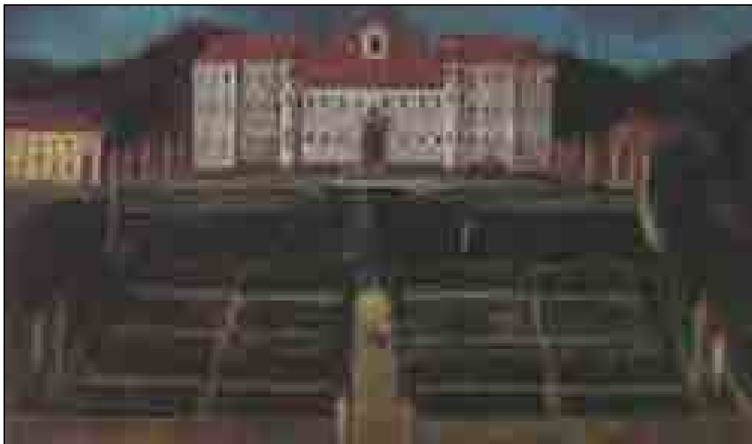
Valentin Metzinger, Grad Goričane pri Medvodah, 1759, olje na platno (sign. na hrbtni strani: V. M. / a 1759) (hrani: Narodna galerija v Ljubljani).

Baročni slikar Valentin Metzinger (1699–1759), ki je na svetniških podobah slikal fantazijske krajine, je naslikal tudi nekaj vedut. Signirana je samo upodobitev gradu Goričane z vrtno strani, s parkom, vodomatom in dvema vrtnarjema, ki je naslikana rahlo naivno realistično. Slikar je frontalni pogled na grajsko stavbo dopolnil z rahlo perspektivo, ki je vidna zlasti pri prikazu geometrijsko urejenega parka. 13