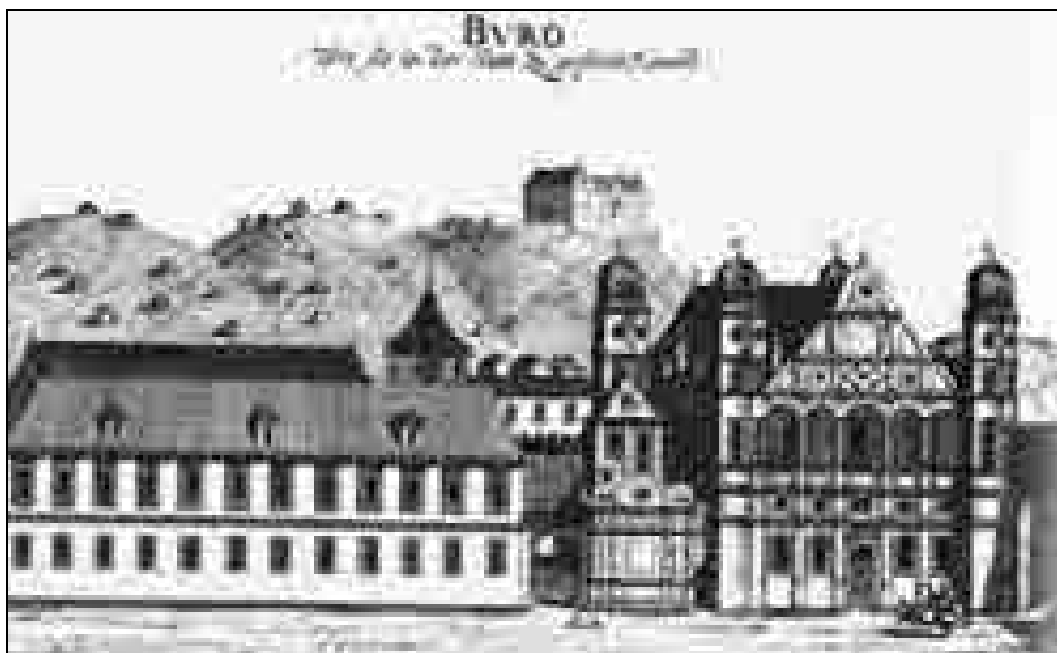
G. M. Vischer – A. Trost, Mariborski mestni grad z juga, v ozadju grad na Piramidi, Topographia Ducatus Styriae, po 1686, bakrorez.