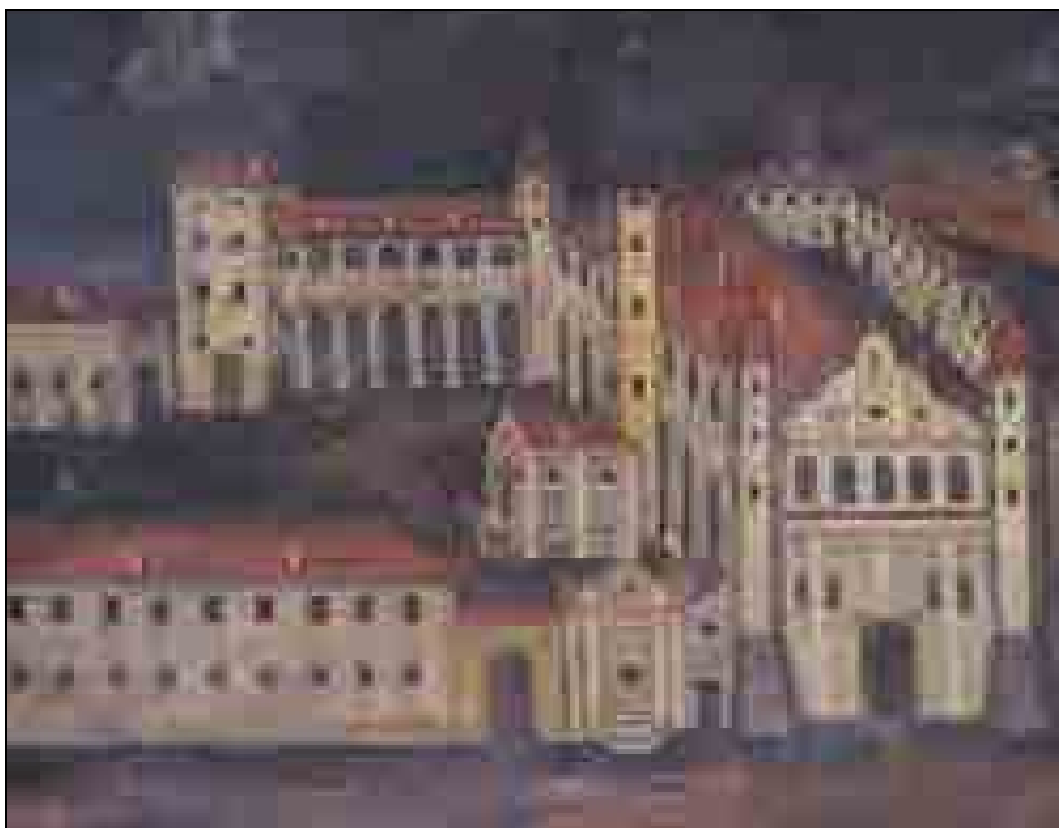
Neznani slikar, Mariborski grad, 1683, olje na platno (hrani: Pokrajinski muzej Maribor).