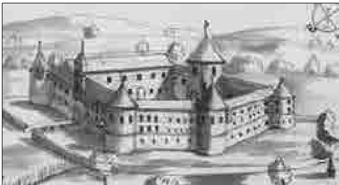
Krupa, 1678, Valvasorjeva Skicna knjiga za Topografijo vojvodine Kranjske, okrog 1678, lavirana perorisba (Metropolitanska knjižnica, Zagreb).