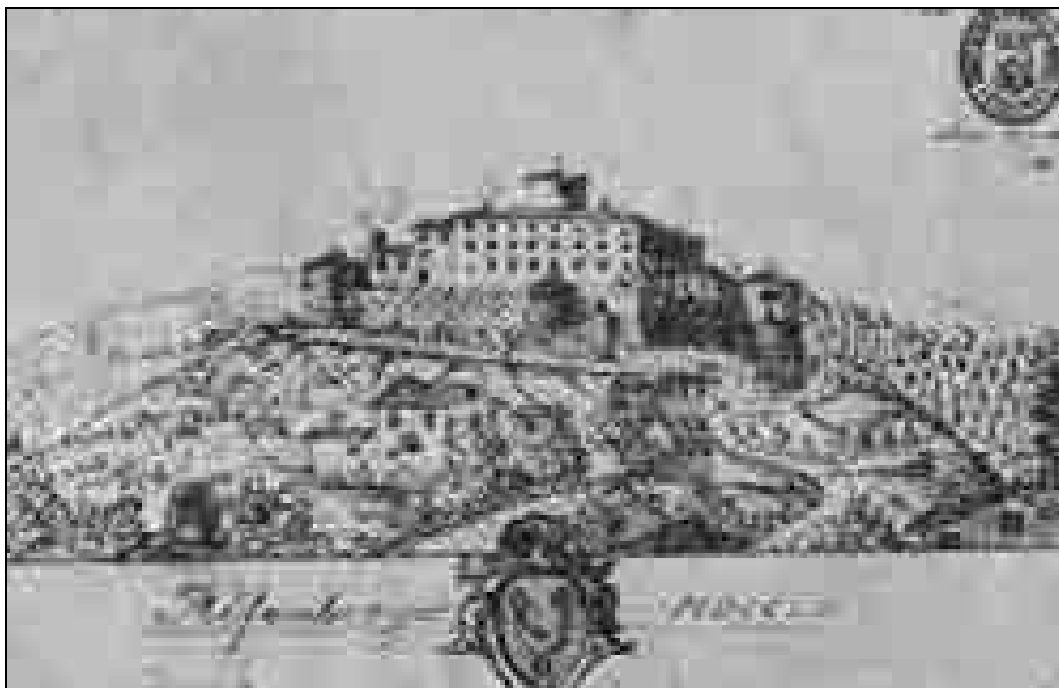
Giovanni Antonio Capellaris, Grad Rihemberk, 1752, risba (Gorica, Musei Provinciali).