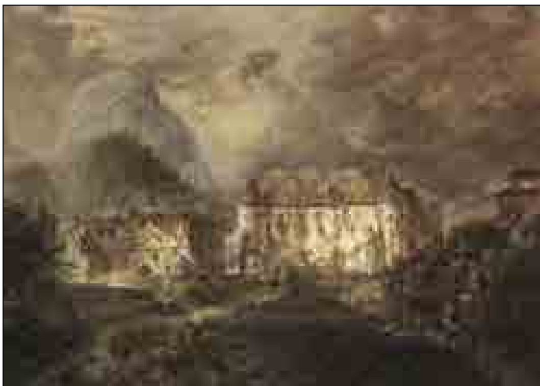
Joseph Kuwasseg – Heribert Lampel, Požar dvorca Ojstrica v Spodnji Savinjski dolini, Lamplova suita, 1841–1850, litografija z iglo (Štajerski deželni arhiv, Gradec).