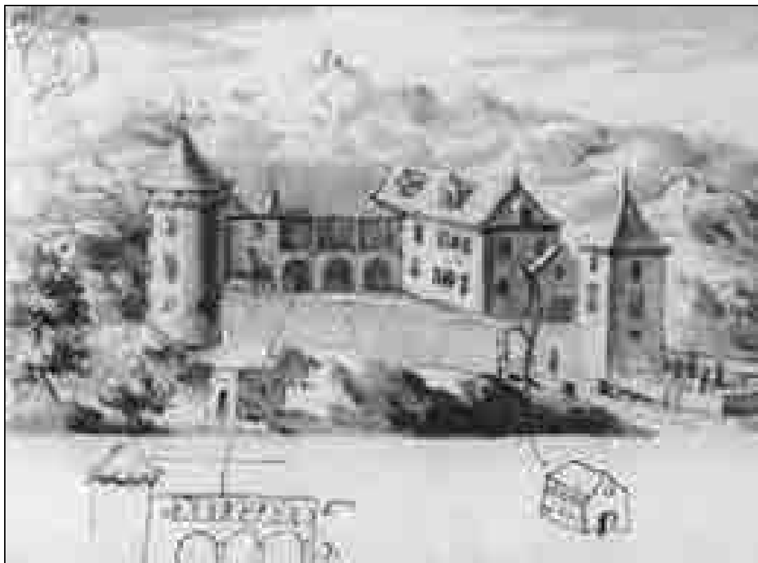
Grad Školj s severne strani, Valvasorjeva Skicna knjiga za Topografijo vojvodine Kranjske, okrog 1678, lavirana perorisba (Metropolitanska knjižnica, Zagreb).