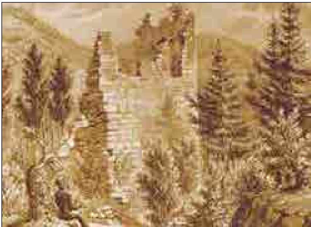
Franz Kurz zum Thurn und Goldenstein, Stara Soteska, okrog 1860, gvaš (Narodni muzej Slovenije, Ljubljana).