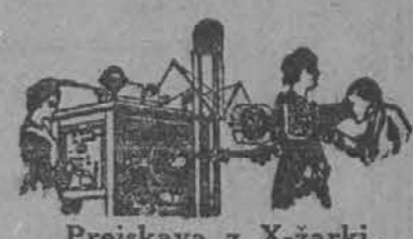
Preiskava z X-žarki.