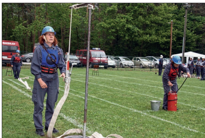
Letošnji tekmovalni utrinek