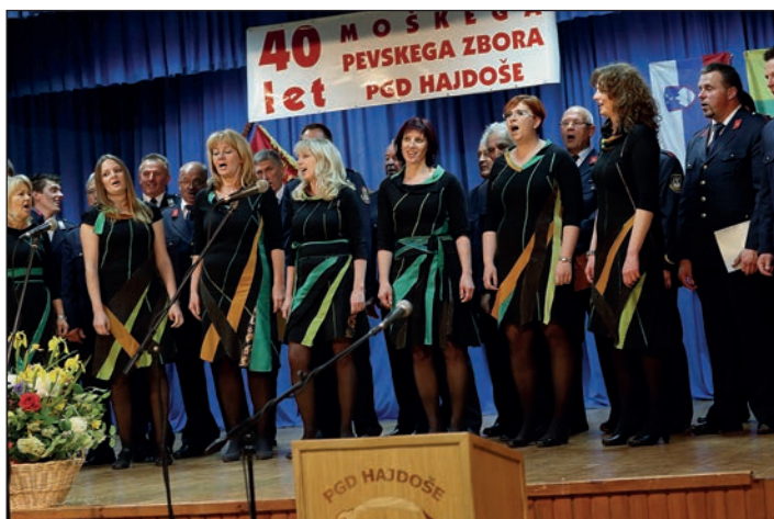
S slavlenci so zapele tudi pojoče hajdinske učiteljice in vzgojiteljice.