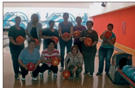
Po koncu tekmovalnega dela še gasilska fotografija

Ob spoznanju, da je bowling zelo sproščujoča in nezahtevna igra, bodo druženje ob stezah za bowling nadaljevale tudi v prihodnje, predvsem skozi zimske mesece, zagotovo pa