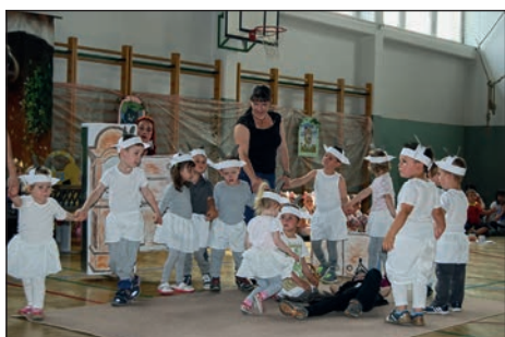
Otroci modre igralnice so se podali v pravljичni svet. Predstavili so pravljico Volk in sedem kozličkov.