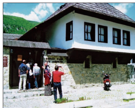
Rojstna hiša Iva Andrića

ne za sestanke, pisarne, predsedniški prostori, spalnice, prostori za bivanje 350 ljudi do 6 mesecev), z vsemi napravami. Sledila je vožnja ob Jablaniškem jezeru (35 km) do Jablanice, nato postanek pri porušenem mostu na prizorišču zgodovinske bitke v NOB na Neretvi in ogled muzeja bitke za ranjence na Neretvi.