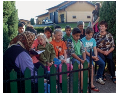
Kakor vsako leto so tudi letos otroci pridno sodelovali pri šmarničnih molitvah.