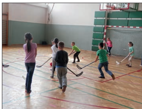
Skrbimo za zdravje.