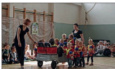
Najmlajši iz oranžne igralnice so se ob glasbi Prihaja Nodi pripeljali z novim prevoznim sredstvom (vozičkom za 6 otrok). V rokah so stiskali Nodije.