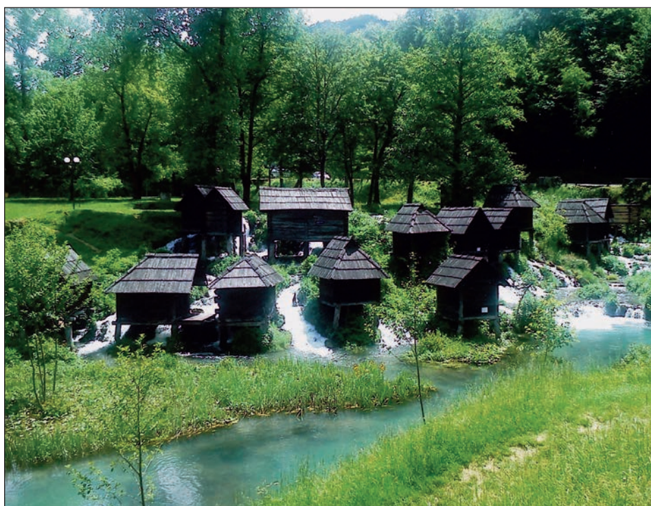
Mlinčič na Plivskem jezeru