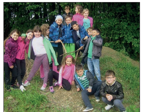
2. a v šoli in v naravi.

V našem razredu nas je petnajst. Osem deklet in sedem fantov. Naša učiteljica je prijazna. Sedimo po parih ali pa po štirje skupaj. Včasih gremo ven. Ko končamo pouk, gremo v podaljšano bivanje. V našem razredu je lepo.