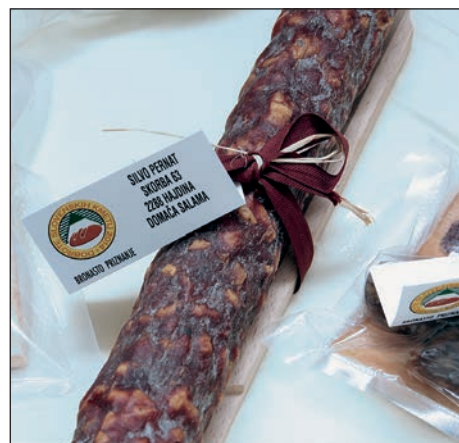
Tudi domače salame iz našega okolja dobivajo odlične ocene, kar dobro ve tudi Silvo Pernat iz Skorbe, ki se s tem že nekaj let ukvarja povsem ljubiteljsko.