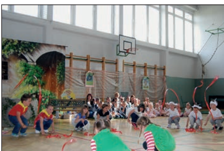
Otroci rdeče igralnice so na koncu odplesali miks pravljic, ki jih je ponovno obudila Viličica na princskino željo.