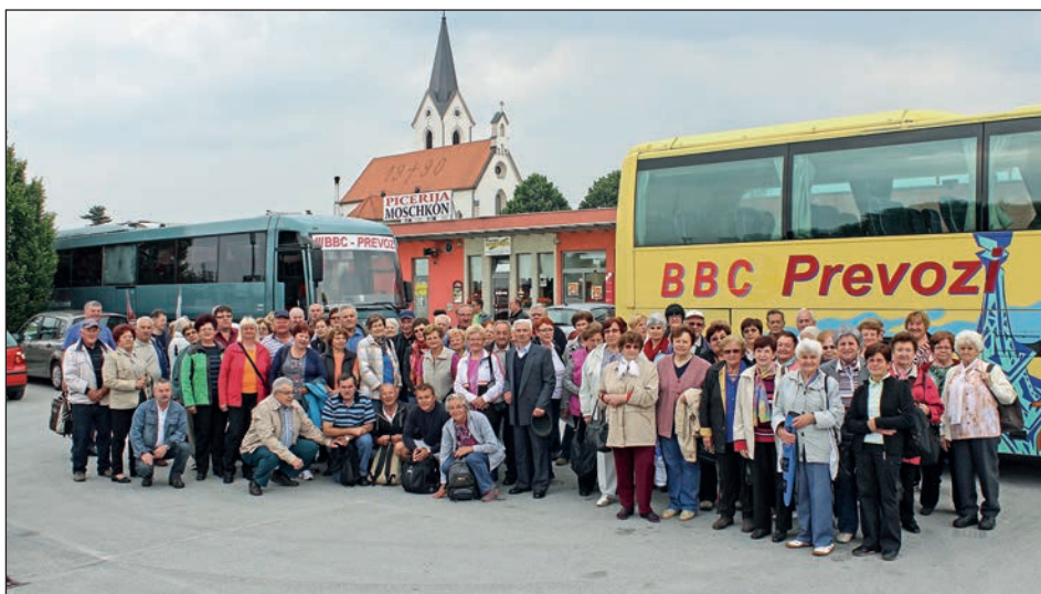
Hajdinska upokoјenska odprava pred odhodom