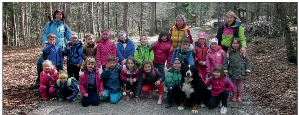
Uživali smo v lepotah narave, ki nam jih je ponujala Logarska dolina.

Med sprehodom po njem nam je pripovedoval pravljice, ki so zahtevale tudi reševanje nalog in ugank. Zelo zanimivo je bilo poslušati Sečoveljske pravljice, ker nam niso poznane. Tudi tiste, ki jih zelo dobro poznamo, so nas pritegnile k poslušanju. V zadnji hiški na koncu pravljичnega gozda nas je čakal skriti zaklad. V pokritem zaboju sta bili dve ruladi, ki sta nam odlično تکنikli. Čeprav je bil dan zelo naporen, smo imeli po večerji še dovolj moči za ples in rajanje v pižamah.