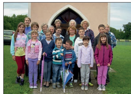
Šmarnice so bile dobro obiskane tudi na Sp. Hajdini.