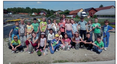
Obisk vrtnarije Zupanič

kamen v moko. Tako smo videli, kako nastane na Luni krater. Druga skupina je risala rakete, Luno in vesoljske ladje. Tretja skupina pa je izdelovala raketo. Zunaj se je medtem že stemnilo in smo lahko začeli opazovati nebo nad nami. Skozi teleskop smo gledali Luno, Jupiter in Mars. Dobro smo videli Mars, ker je