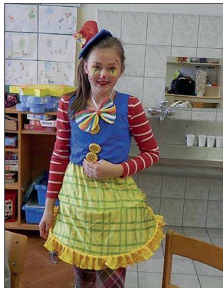
Pustno obarvane delavnice