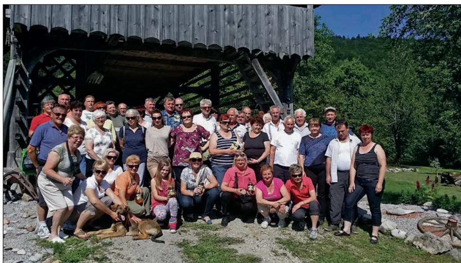
Skorbljani pri kozolcu na kmetiji Rajhenav