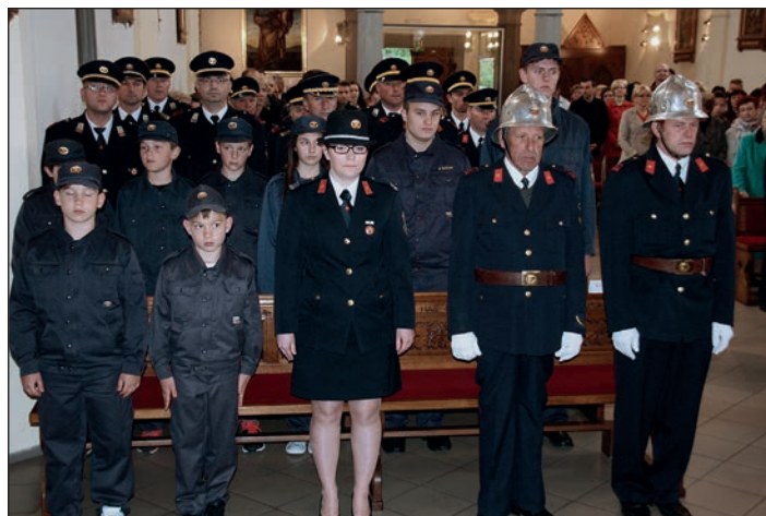
Prvič so se Florjanove maše udeležili tudi mladinci iz PGD Gerečja vas.