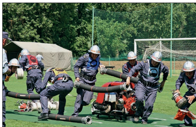
Tekmovalci v akciji

tekmovalcev in številno navzočnost gledalcev si lahko kot organizator priznamo, da smo opravili še eno uspešno misijo.«