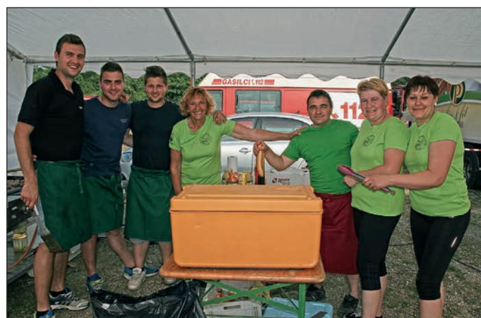
Letošnja gasilska ekipa v kuhinji, ki je ves čas tekmovanja skrbela za odlično hrano.