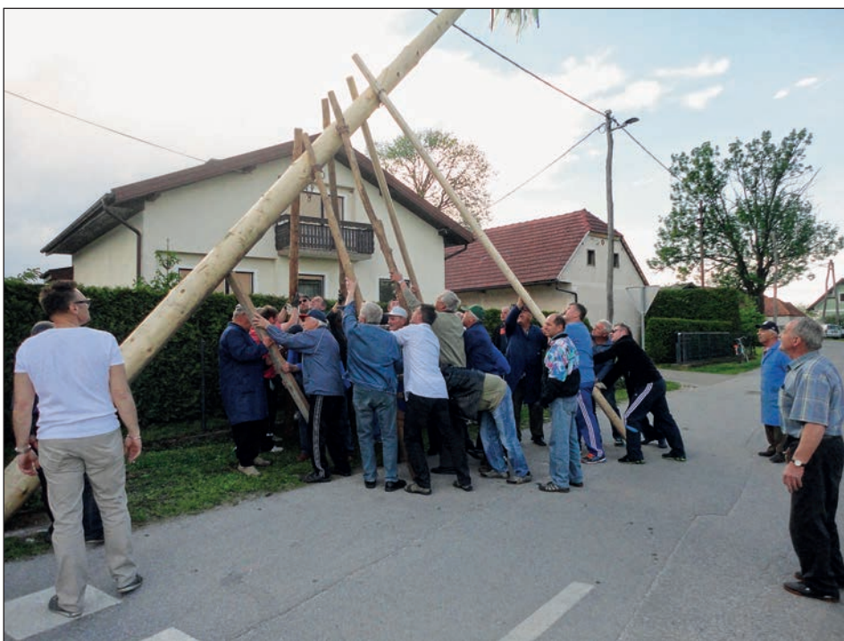
Postavitev mlaja zahteva veliko mero znanja, moči in tudi strpnosti ...

Pred gasilskim domom v Gerečji vasi je 30. aprila že pred 17. uro postalo živahno. V organizaciji VO in PGD Gerečja vas so se namreč zbrali vaščani, da bi postavili mlaj in se družno povesečili ob malici in rujni kapljici ter proslavili mednarodni praznik dela.