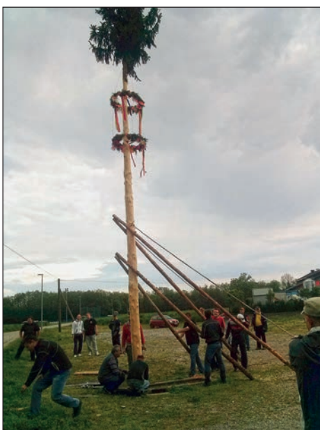
Postavitev mlaja pred domom krajanov