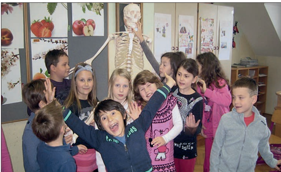
To smo mi ...