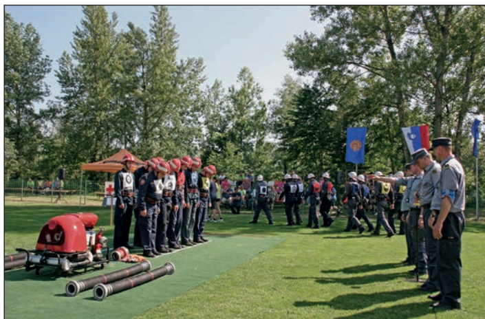
Še zadnji sodniški pregled ekipe in napotki, nato pa start