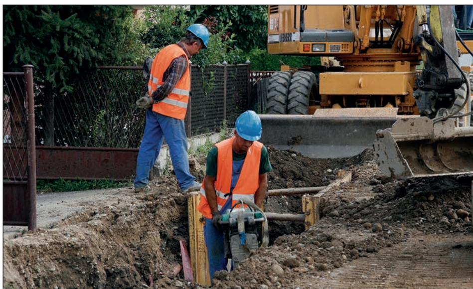
Izgradnja kanalizacijskega sistema je v občini Hajdina ena od prednostnih razvojnih nalog.

Občani, katerim je bil prispevek zaračunan po Odloku o programu opremljanja zemljišč za gradnjo in merilih za odmero komunalnega prispevka na območju Občine Hajdina (Uradno glasilo slovenskih občin, št. 34/07, 11/08), niso upravičeni do vračila zneska, čeprav bi jim bil po Odloku o programu opremljanja stavbnih zemljišč in merilih za odmero komunalnega prispevka na območju Občine Hajdina (Uradno glasilo slovenskih občin, št. 17/11) prispevek obračunan v nižjem znesku. Prav tako tisti občani, ki bi morali po novem odloku plačati več, ne bodo plačali razlike. Prispevek za kanalizacijski priklop se odmerja v skladu z vso veljavno zakonodajo.