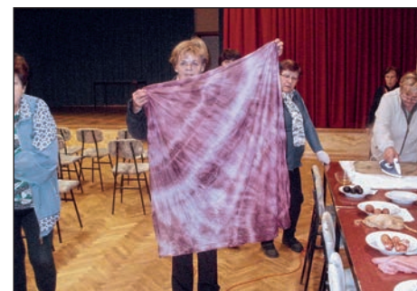
Udeleženske tečaja so bile navdušene nad odličnimi rezultati poskusnega barvanja.