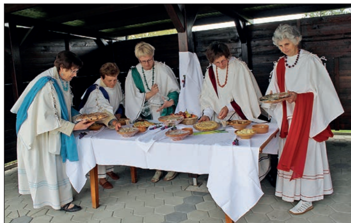
Jedi so pripravljene, gostje prihajajo, odstraniti je treba le zaščitno folijo. Rimljanke s Hajdine so bile tudi tokrat deležne velike pozornosti.