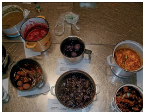
Kuhanje bombažnih tkanin in pirhov v različnih barvnih osnovah

Po receptih za barvanje, ki so jih predhodno zbrale, so najprej pripravile ustrezne surovine za posamezne barve, v katere so najprej namočile jajca, pripravile pa so tudi bombažne tkani-