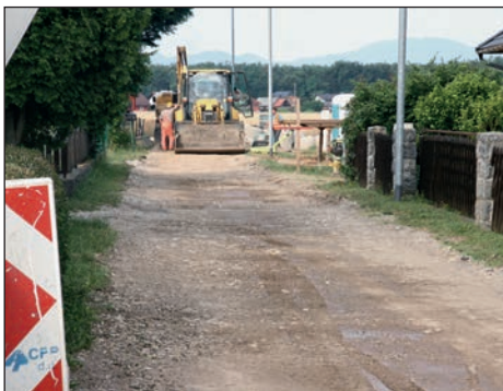
Izgradnja kanalizacije ostaja osrednja naložba občine Hajdina. Dela potekajo tudi v naselju Draženci.

V sklopu izgradnje kanalizacije v naselju Zgornja Hajdina na trasi kanalov 4.2 in 4.2.2. se je izvedla še rekonstrukcija komunalne infrastrukture tako, da se je v zemljo položilo nizkonapetostno omrežje, izgradila nova javna razsvetljava in položila v zemljo PVC-kanalizacija za telefonsko omrežje in CaTV.