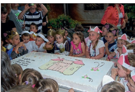
Po končani prireditvi smo komaj čakali na torto. Mm, kako je bila dobra!

V maju smo majhni in veliki v vrtcu upihnilni že četrto svečko na rojstnodnevni torti. Prireditev ob praznovanju je potekala v telovadnici OŠ Hajdina, skupaj z obiskovalci pa smo se podali med pravljичne in risane junake. V naši pravljici so oživel kralj, kraljica, princesa in viličica, ki so jih odlično odigrali otroci najstarejše, rdeče igralnice in ki so povezovali celotno prireditev. Med njihovimi pripravami na grajsko zabavo so se nam s plesom in plesno dramatizacijo predstavili otroci vseh igralnic. Najprej smo videli najmlajše otroke, ki so se z Nodiji pogumno sprehodili po parketu telovadnice in dodobra ogreli dlani obiskovalcev prireditve. Sledil je ples zvezdic Zaspank in plesna dramatizacija Volk in sedem kozličkov. Mački Muriji in muce Mace so se prav tako predstavile v plesni dramatizaciji, ob glasbi pa so se zavrtele nagajive Pike Nogavičke. Občudovali smo lahko še ples s trakovi ob prijetni, pravljичni pesmi.