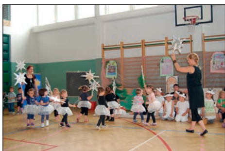
Male zvezdice in lunice iz vijolične igralnice so se zavrtele in zasijale ob glasbi Zvezdice Zaspanke.