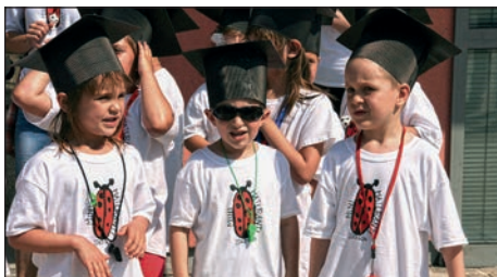
Ko se generacija 2013/14 na ogled postavi ...

tom so se na občinskem trgu pridružili še starši, dedki in babice, prijatelji, ki sta jih dobra volja in piskanje bodočih prvošolcev še kako navdušila.