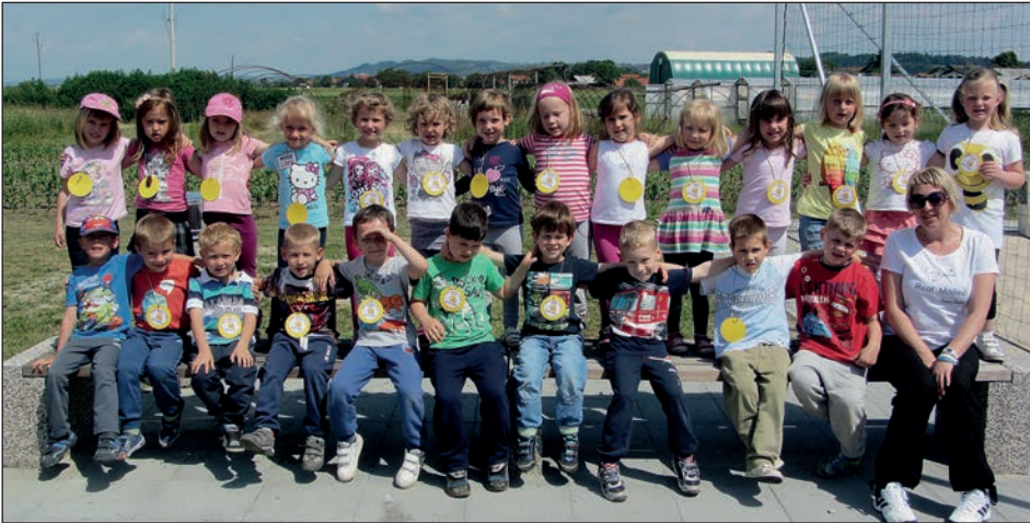
Na koncu smo bili vsi zmagovalci in vsi smo si zaslužili medalje.

in kako zelo ga potrebujemo. Otroci so izvedeli, zakaj ime Logarska dolina. Zgodba o jezeru in zmaju jih je tako pritegnila, da so govorili samo še o njem. Grelo nas je toplo sonce in otroci so bili navdušeni nad naravo, ki nas je obdajala. Na igralih pred penzionom je bilo zelo živahno. Otroci so se zabavali z badmintonom, nogometom, dekleta so imele manikiro, risali smo z barvicami in podirali keglje. Opazovali pa smo tudi ribnik, v katerem bo kmalu kvakalo veliko malih žabic. Popoldan smo skupaj s škratkom Nejkom vstopili v pravljичni gozd.