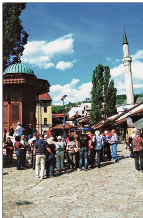
Baščaršija z znamenitim vodnjakom in minaretom

Po jutranjem preostanku ogleda Sarajeva, bili smo še na stolpu Avaz (34 nadstropij), ki je najvišja stavba v Sarajevu, smo se odpeljali v Konjic, kjer smo si ogledali podzemno atomsko zaklonišče, ki so ga gradili v letih 1953–1979. Titov bunker je 280 m pod zemljo, sestavlja ga množstvo prostorov na več kot 6500 m 2 , razdeljeno v 12 blokov z v celoti ohranjenim inventarjem (rezidenčni prostori, dvora-