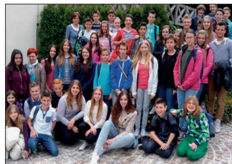
Skupinski utrinek z ekskurzije

Po ogledu krapinskega muzeja smo se odpravili na dvorec Trakoščan, kjer smo najprej imeli eno uro prosto. V tej eni uri smo se sprehajali ob čudovitem ribniku ali pa smo sedeli na terasi ob ribniku in uživali. Potem smo se odpravili v sam dvorec, ki je prečudovit. Vodič nam je povedal nekaj o zgodovini dvorca in o tem, kako je zgra-