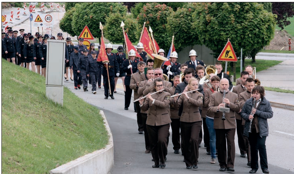
Mimohod do Martinove cerkve z godbo na pihala iz Podlehnika na čelu

Poseben nagovor je imel tudi naddekan, ki je dejal, da se je ob letošnjem žledu pokazalo, kako pomembne so močne gasilske vrste, pa tudi, da ob