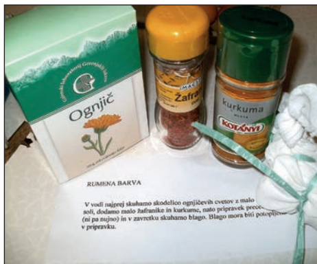
Recept in sestavine za pripravo barvne osnove

Lani je iz delovnega programa Društva žena in deklet Gerečja vas odneslo tradicionalno Bučijado, ki je po desetih poglavjih doživela svoj bogati epilog, letošnje leto pa prinaša nove in sveže ideje s področja barvanja z naravnimi barvili.