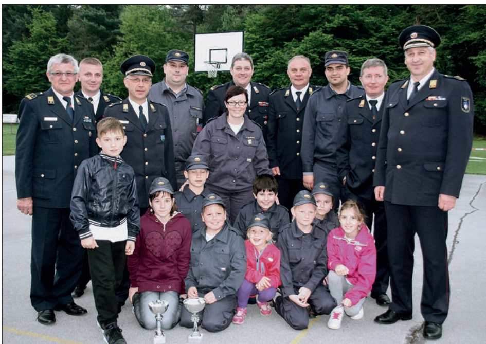
Svečani trenutek podelitve pokalov

pa so se preizkusili v vaji s hidrantom in vaji raznoterosti. Pri članih je bila najuspešnejša ekipa PGD Hajdoše B, druga je bila ekipa PGD Podgorci, tretji pa sosodje PGD Slovenja vas.