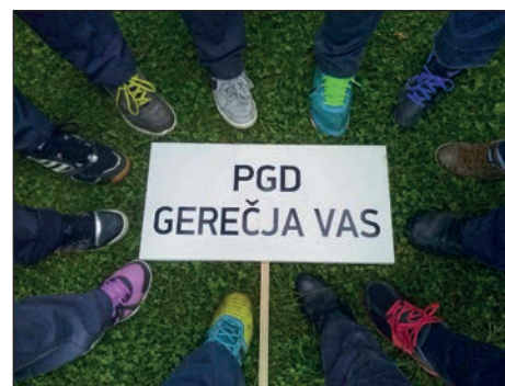
Gasilski utrinek iz Zbilj

V soboto, 31. maja, je v Zbiljah potekalo 16. srečanje slovenske in hrvaške gasilske mladine, ki se ga je udeležila tudi ekipa mladincev iz PGD Gerečja vas. Mladina se je pomerila v vaji z ovirami v ločenih kategorijah (mladinci, mladinke) in v športnih igrah, v katerih so nastopali v mešani sestavi (mladinci PGD Gerečja vas so ekipo sestavljali skupaj z mladinkami PGD Sora).