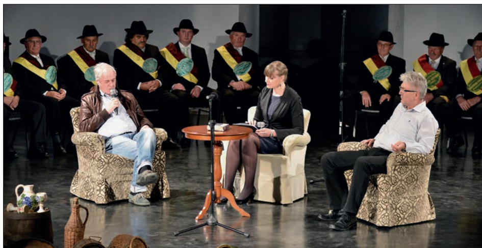
Pri prireditvi so sodelovali tudi hajdinski kletarji.