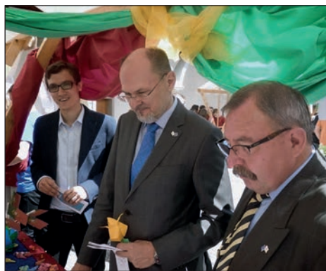
Našo tržnico je obiskal tudi Jelko Kacin.