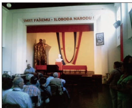
Zgodovinska dvorana II. zasedanja AVNOJ-a v Jajcu

po čudovitem kanjonu Neretve, ki daje s svojo svežino in barvitostjo obilo možnosti za kampiranje, veslanje ... Ob cesti, ki teče ob reki, je množstvo gostiln, ki vabijo na postanek. Mi smo se ustavili v Jajcu, kjer smo si ogledali muzej II. zasedanja Avnoja leta 1943 – dvorano zasedanja in stranske prostore. Med tvorci nove Jugoslavije je tudi slovenski grb. V nadaljevanju poti smo se znašli med Velikimi in Malim Plivskim jezerom, kjer so na vodnih pregradah zgradili vodenice, ki jih v Jajcu imenujejo »mlinčiči«. Končno smo prispeli v Banjaluko, ki je drugo največje mesto v BiH in je tudi prestolnica entitete skupščine Republike srbske. Program je obsegal ogled Narodne skupščine, trdnjave Kastel, Gospodsko ulico, Ban-