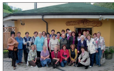
Članice hajdoškega društva žensk so uživale na popetu po Mariboru in na koncu tudi na Ribičiji.