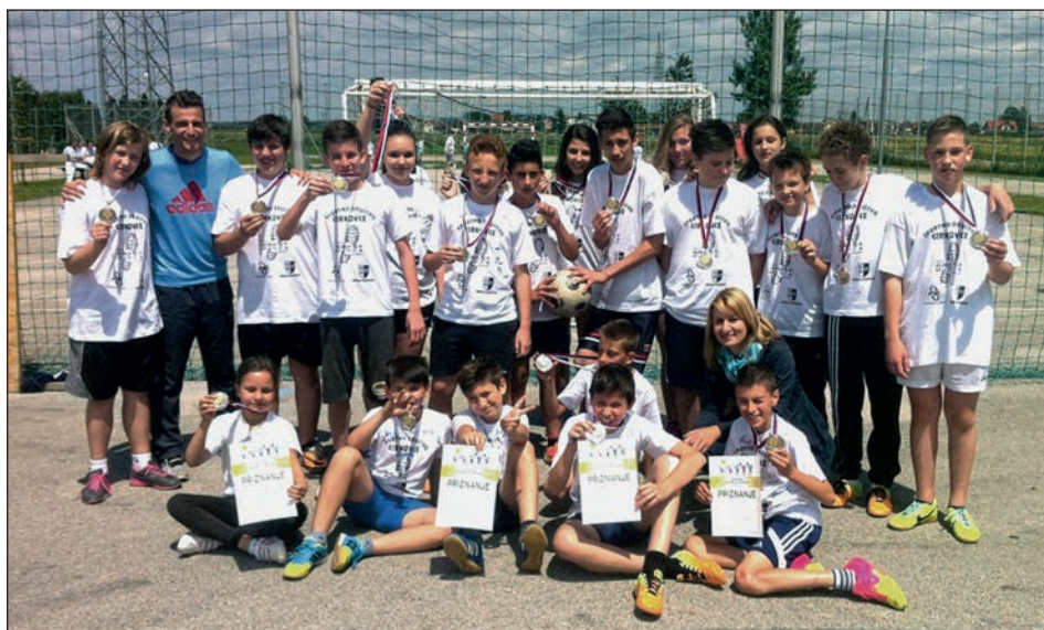
To smo mi, zmagovalci iz OŠ Hajdina.