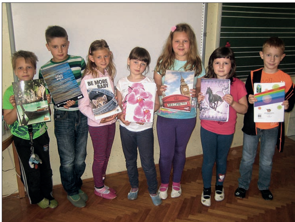
Tudi učenci 2. b pridno zbirajo zvezke.

tekmi, še posebej, ko so se pomerili »moški in mamice«. DA