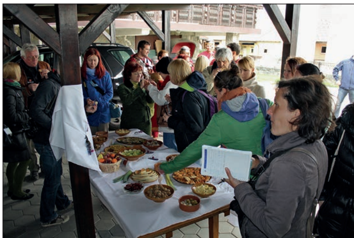
Rimska kulinarika je bila zelo zanimiva za medijske poročevalce sodobnega časa.

V turistični ponudbi bo treba poleg dobre hrane ponuditi gostom tudi dogodke, kjer se bodo srečali z živimi liki iz preteklosti, se lahko z njimi fotografirali in s seboj odnesli kanček naše zgodovine. V ozadju je pogled na pred kratkim urejeno parkirišče pri mitreju, ki bo omogočilo dostop turistov tudi z avtobusi.