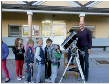
Pogled v nebo