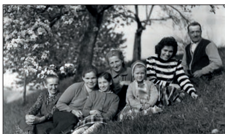
Z družino v Halozah (skrajno levo mati, skrajno desno oče)