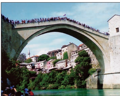
Novi Stari most v Mostarju

po čudovitem kanjonu Neretve, ki daje s svojo svežino in barvitostjo obilo možnosti za kampiranje, veslanje ... Ob cesti, ki teče ob reki, je množstvo gostiln, ki vabijo na postanek. Mi smo se ustavili v Jajcu, kjer smo si ogledali muzej II. zasedanja Avnoja leta 1943 – dvorano zasedanja in stranske prostore. Med tvorci nove Jugoslavije je tudi slovenski grb. V nadaljevanju poti smo se znašli med Velikimi in Malim Plivskim jezerom, kjer so na vodnih pregradah zgradili vodenice, ki jih v Jajcu imenujejo »mlinčiči«. Končno smo prispeli v Banjaluko, ki je drugo največje mesto v BiH in je tudi prestolnica entitete skupščine Republike srbske. Program je obsegal ogled Narodne skupščine, trdnjave Kastel, Gospodsko ulico, Ban-