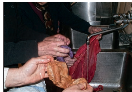
Izpiranje pobarvanih tkanin, s katerih odstranimo ostanke zelenjave oz. začimb, v katerih se je obarvala tkanina.

z barvanjem, ampak tudi s krojenjem in šivanjem gospodinjskih tekstilij in oblačil, ki jih bodo ob koncu leta predstavile v obliki »modne revije«.