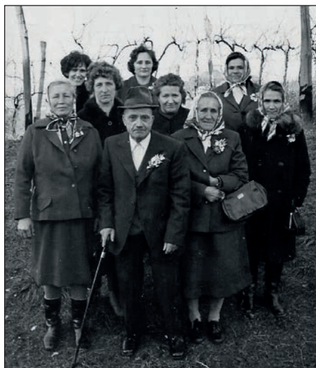
Zlata poroka očeta in matere