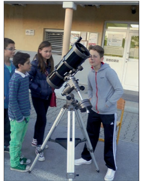
Radovednost je lepa čednost.