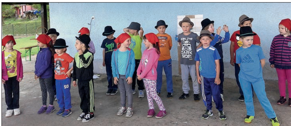
Utrinek s prvega šolskega piknika

Namen našega prvega piknika je bilo druženje, zabava in igra. Ob tem smo se hladili z osvežilno pijačo in dobro nasitili z dobrotami z