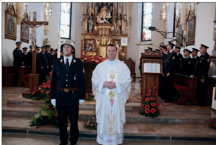
Naddekanov sprejem v župnijski cerkvi je bil pristen, kot zmeraj doslej.