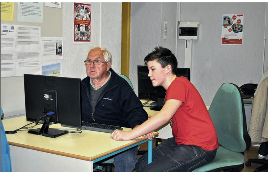
Utrinek z računalniške delavnice

ka postavlja na rob družbe. Ker se na OŠ Hajdina zavedamo pomembnosti prenosa znanja s starejših na mlade in želimo graditi prihodnost, ki bo lepša za vse generacije, smo se odločili, da bomo tudi mi nekaj naredili za starejše. Odločili smo se, da jim bomo pomagali pri premagovanju ovir na področju rokovanja z računalnikom, mobilnim telefonom, svetovnim spletom in drugo komunikacijsko tehnologijo. Odločili smo se, da si bomo