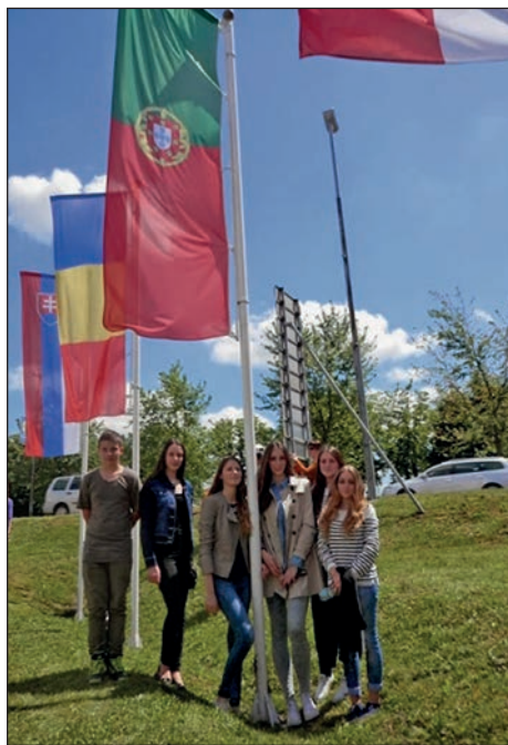
Skupinska fotografija pri portugalski zastavi