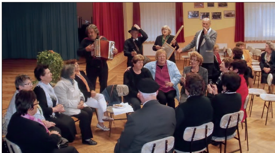
Po uradnem delu glasbenega večera se znajo pevci družiti na drugačen način.

Na praznični velikonočni ponedeljek, 21. aprila, se je s pomladanskim tradicionalnim glasbenim večerom pod naslovom Pesem družini nas začelo novo obdobje delovanja Mešanega pevskega zboru DŽD Gerečja vas, ki pod okriljem DŽD deluje že od leta 2002. Poleg rednih tedenskih vaj je MePZ v preteklem letu zabeležil 23 javnih nastopov, njihova gostovanja in druženja pa na gostiteljski oder pripeljejo vedno nove nastopajoče.