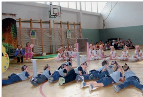
Otroci rumene igralnice so skozi igro in ples predstavili glasbeno pravljico Maček Muri. Spoznali smo mačje mesto, muce Mace in mačke Murije.