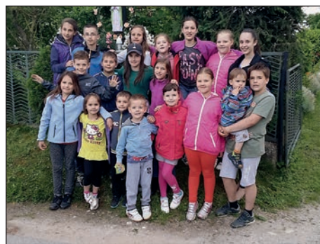
Otroci so komaj čakali šmarnice.