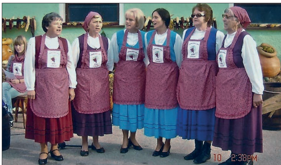
Z ljudskimi pevkami prepeva že 18 let.