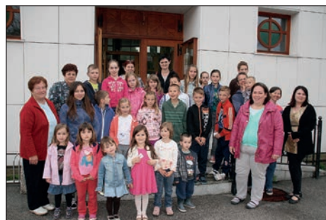
Slovenjevaški šmarničarji pred podružnično cerkvijo