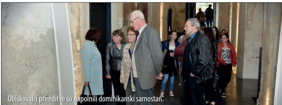
Obiskovalci prireditve so napolnili dominikanski samostan.