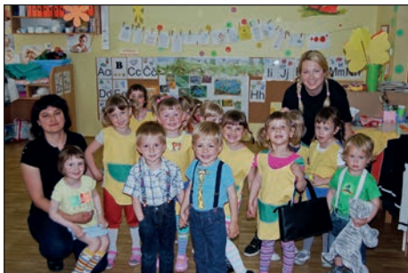
Pike Nogavičke iz zelene igralnice so se predstavile s plesom.