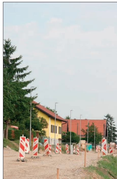
Na Zg. Hajdini, kjer je v fazi modernizacije lokalna cesta, trenutno potekajo elektro priklopi posameznih gospodinjstev na novo položene zemeljske kable, kar bo omogočilo odstranitev zračnih vodov.