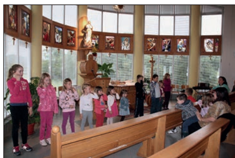
Petje in dobra volja sta vsak majski večer spremljala šmarnice v slovenjevaški cerkvi.