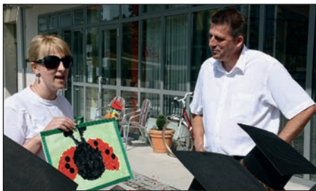
Pikapolonica za župana

V znak pozornosti so otroci županu izročili risbico pikapolonice in nekaj semen, iz katerih bodo vzklile sadike, in te bodo lep spomin na prijetno družanje z malčki. Letošnjim minimaturan-