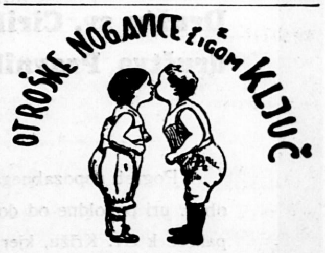
Otroške nogavice z igrom ključ