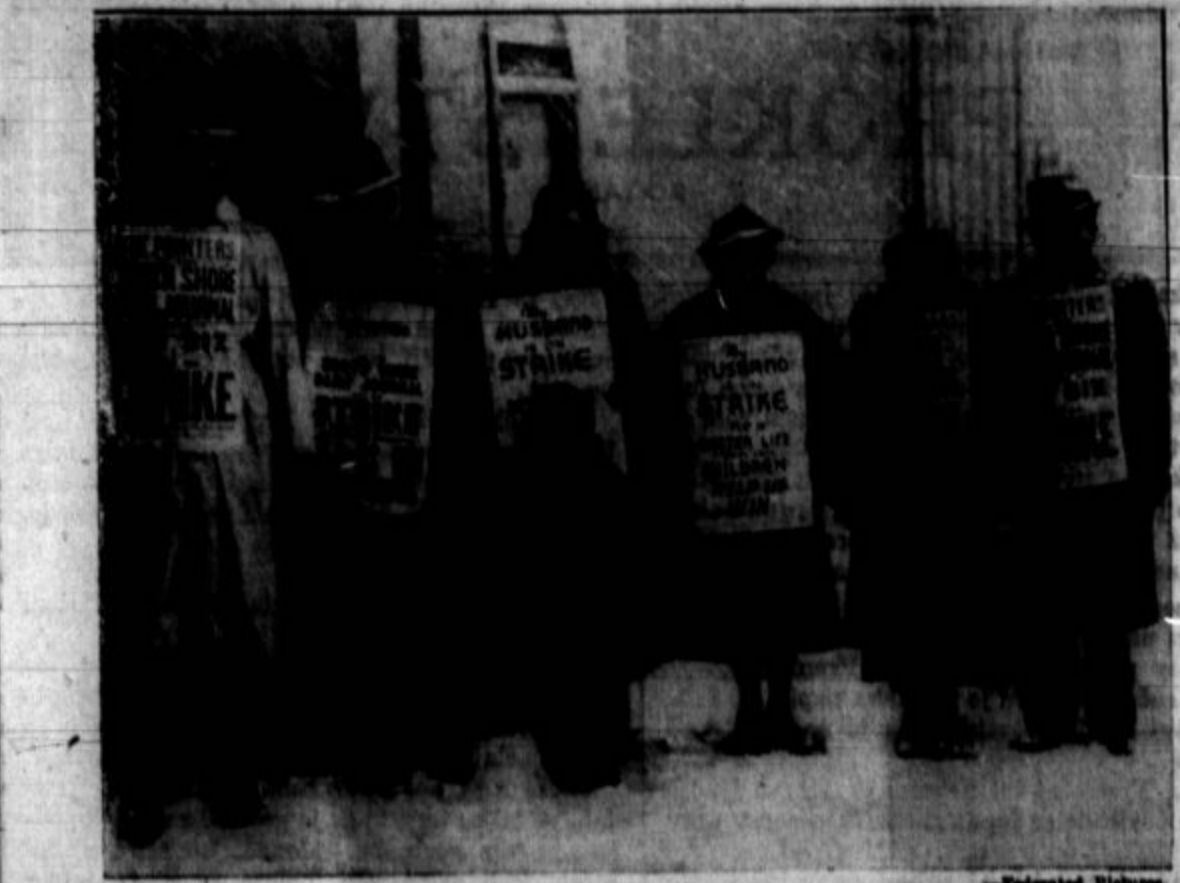
Tiskarji in časopisni delavci piketirajo pred uradom lista "Daily Journal", Flushing, L. I., po izbruhu stavke.

(Nadaljevanje v 1. strani.) trole, ki so bili prijeti po fašistični okupaciji Malage, toda štirje so bili obsojeni v dosmrtno ječo, eden pa je dobil šest let zapora, ko se je neki duhoven zavzel zanj in izpovedal, da je obtoženec rešil življenje nekaterim prebivalcem in da je storil vse, kar je mogel, da bi rešil druge. Vsi so prišli pred vojno sodišče na obtožbo, da so oni od-