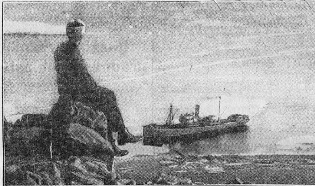
Ruski ledolomilec »Malygin«.

nihče primoran stanovati v teh hotelih, toda sobe v drugih hotelih so navadno tako zanikrne, da se tujec hočeš-nočeš odloči za »valutni hotel«. Pa tudi »valutne trgovine« dobro uspevajo, ker tujec rajši plača blago znatno