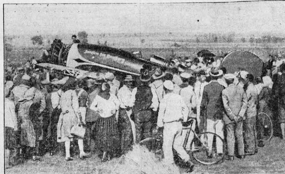
Zasilni pristaneč ogrskih prekoceanških letalcev pri Budimpešti

Na sliki vidimo odhod avtomobilov v silnem dežju.