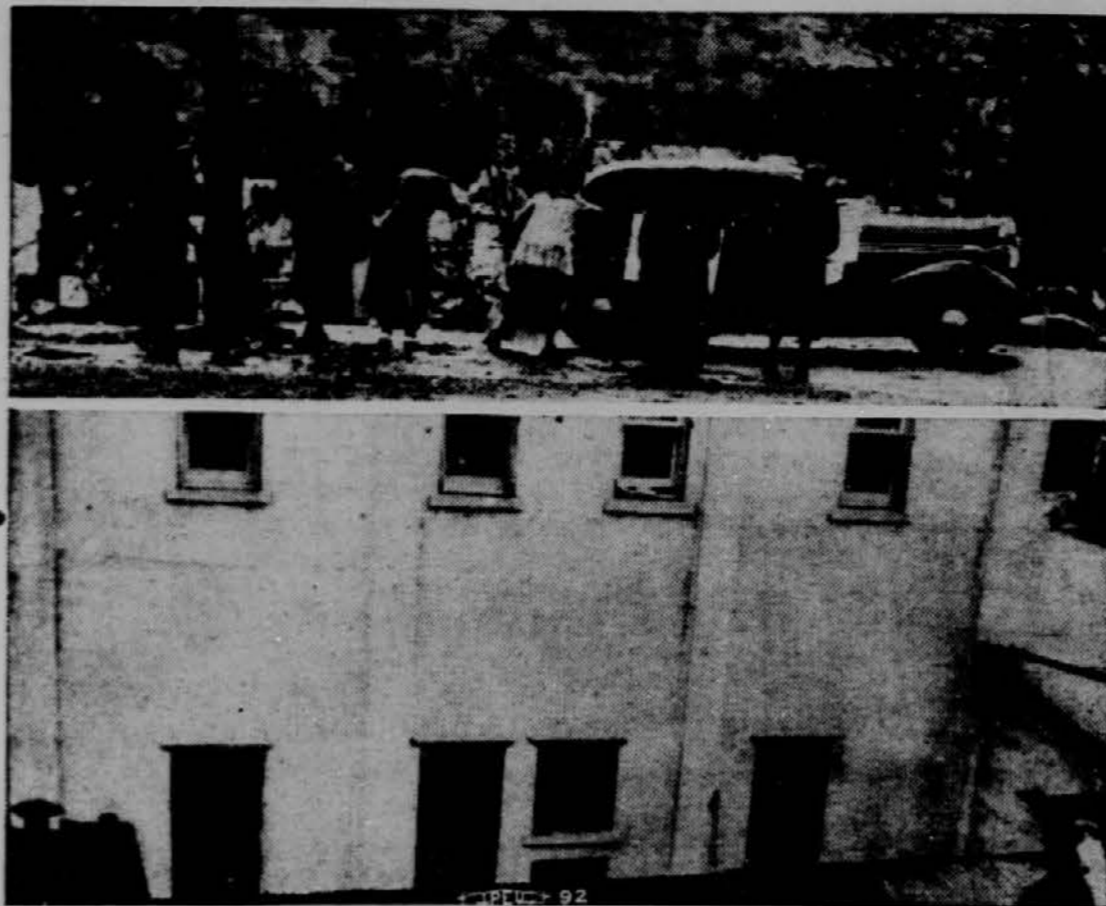
Spodnji del slike nam predstavlja okrajno ječo v Redding, Cal., kamor so zaprli 88 štrajkerjev, članov Mine, Mill and Smelters unije. Ko se je to zgodilo, so žene zavzele njihova mesta ter začela piketirati.