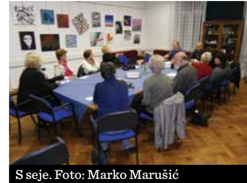
S seje.