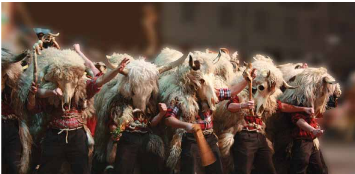
Nagrajena fotografija Ire Petris (str.10).