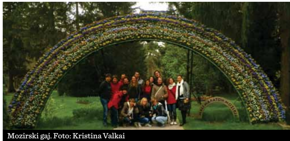
Mozirski gaj.