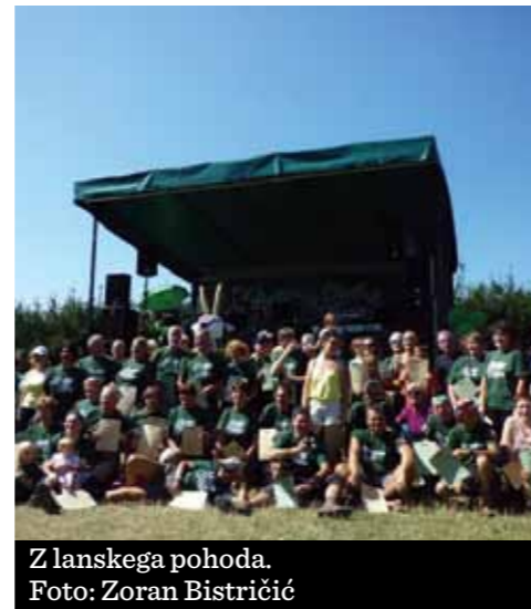
Z lanskega pohoda.

♦ Zoran Bistričić, prevod Jasna Zazijal - Marušić