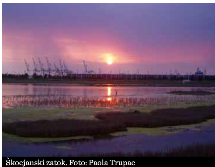
Škocjanski zatok.