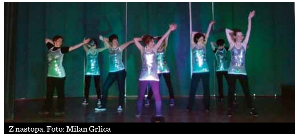
Z nastopa.