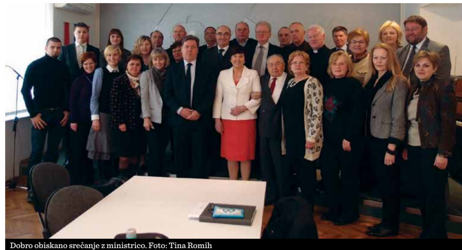
Dobro obiskano srečanje z ministrico.