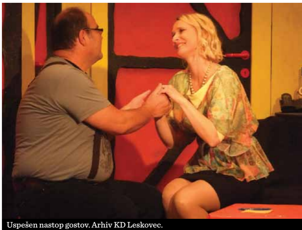
Uspešen nastop gostov.