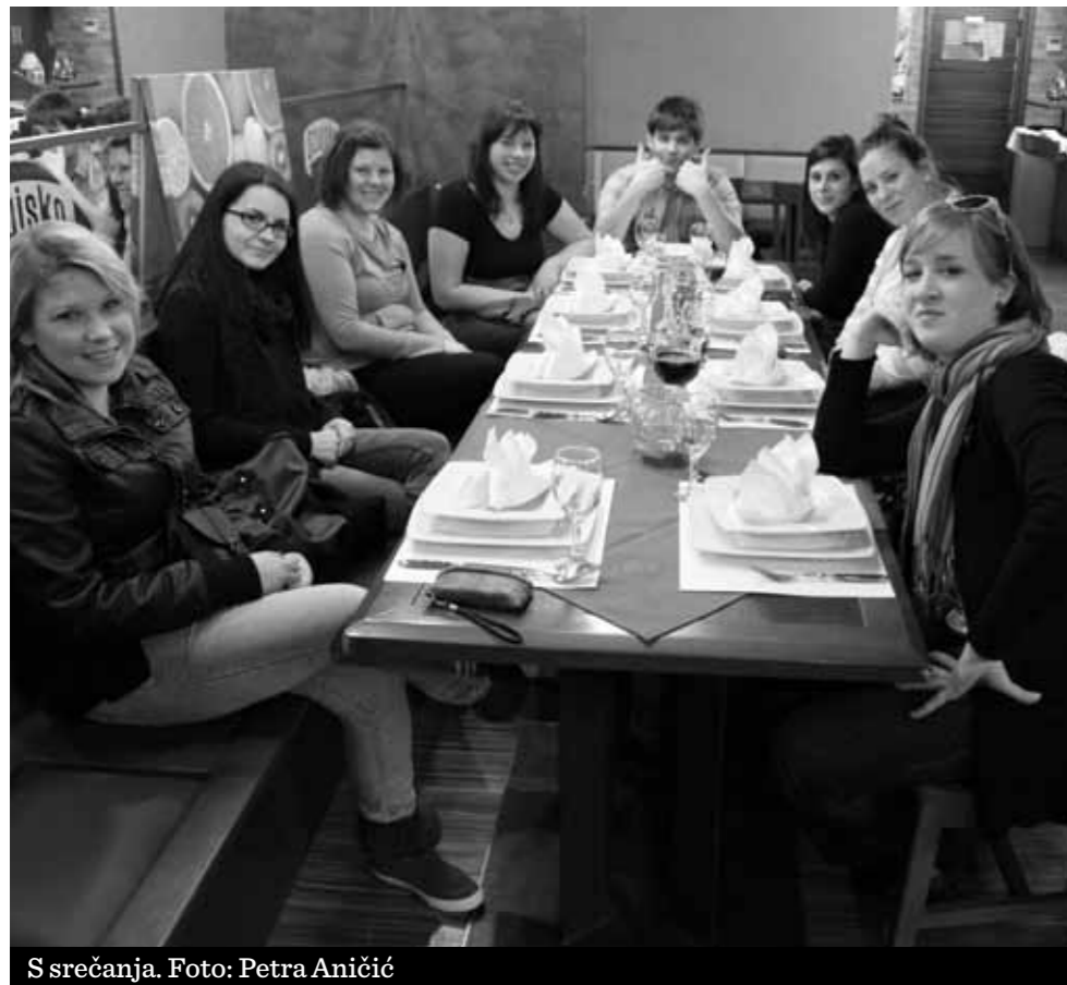
S srečanja.