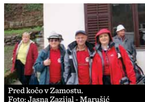
Pred kočico v Zamostu.

Prva skupina je prišla mokra, počasnejše je ujela toča. Topla enolončnica je prijetno zadišala vsem pohodnikom, na stolih okoli peči so se sušile mokre vetrovke. Predavanje o čemažu je že opisal Zoran. Na koncu je prišel harmonikar in zagodel nekaj poskočnih pesmi. • Jasna Zazijal - Marušić