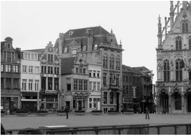
Mechelen, staro mesto jedro.