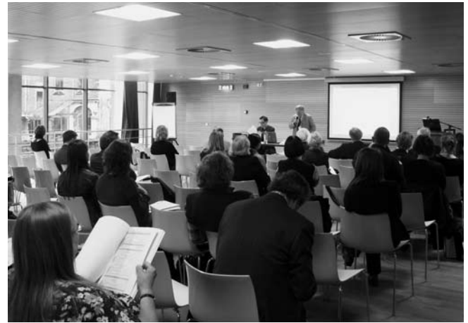
Delavnica o čezmejnih povezavah.

Več informacij o konferenci je na spletni strani www.heritageorganisations.eu . Eden od sklepov, glede na nepričakovano številčno udeležbo, pa je bil, da bi bilo vsekakor smiselno nadaljevati s tovrstnimi srečanji evropskih dediščinskih NVO tudi v prihodnje, vsakič v drugi državi gostiteljici.