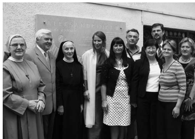
Po odkritju spominske plošče.

Foto: Barbara Brezigar, Aleksandrija, november 2007