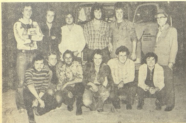
Mladinci pred naloženim tovornjakom