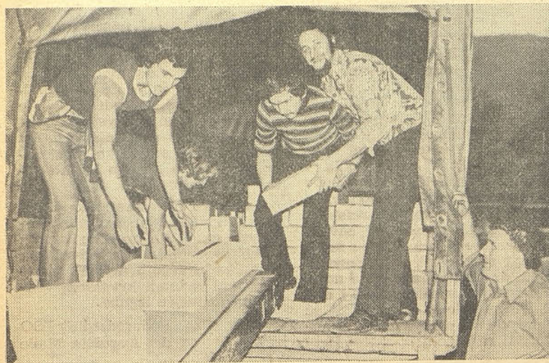
Tik pred zdajci