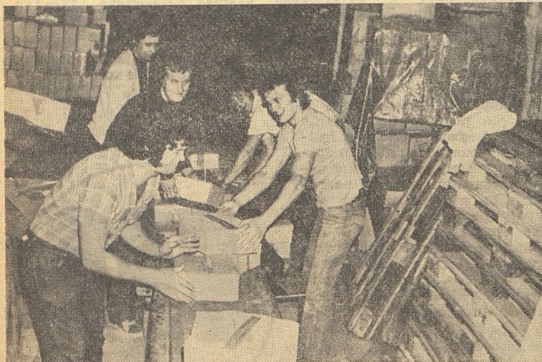
Veselo razpoloženje ob delu