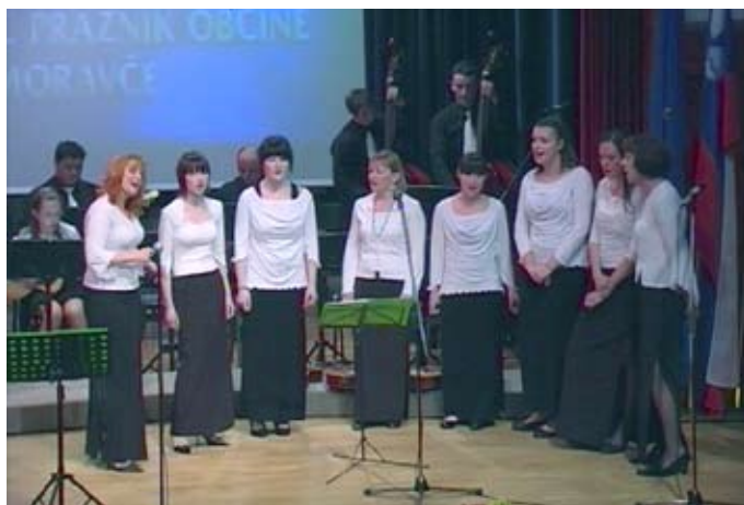
Ženska klapa Antares