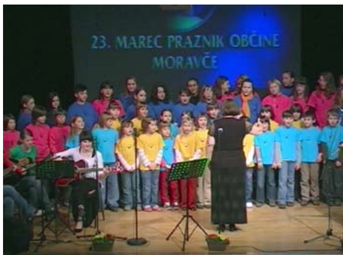
Otroški pevski zbor Muc-art in Vega bend