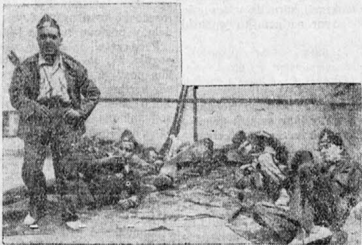
RDECI MILIČNIKI PO FRANC OVI OFENZIVI NA MADRID.

Coue, to je bil zdravnik, pri katerem so morali bolniki živeti v domišljiji, da jim gre dan za dnem bolje, dasiravno je bilo morda ravno obratno. Nekoč je vprašal svojega asistenta po zdravju nekega bolnika. »Zelo je slab!« je bil odgovor. »Tako vendar ne smete reči, pravi zdravnik.« Bolnik si domišlja, da mu je vedno slabše; to si pravi odgovor. Naslednjega dne prejme zdravnik Coue na isto vprašanje po istem bolniku naslednji odgovor: »Bolnik si domišlja, da je umrl!«