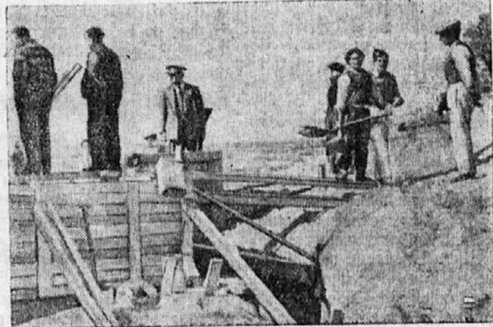
RDECI MILIČNIKI GRADIJO NOVE OKOPE SREDI MADRIDA.