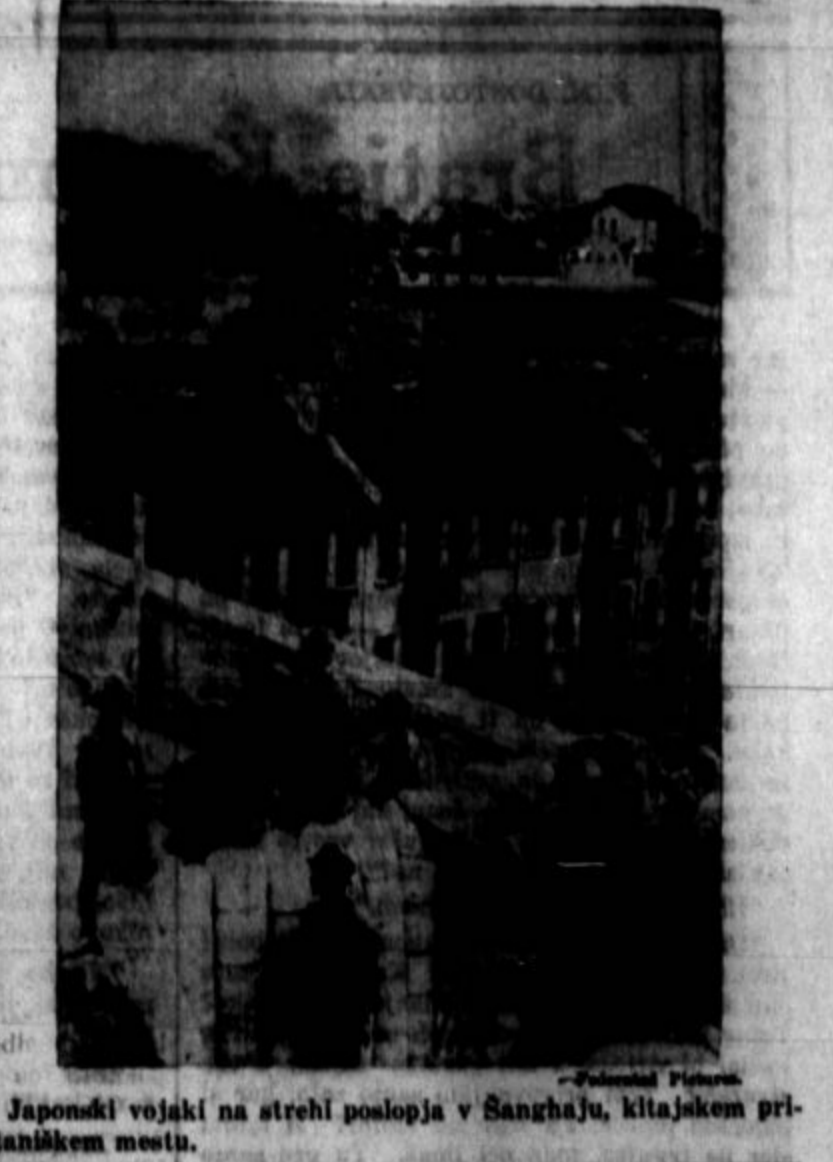
Japonski vojniki na strehi poslopja v Sanghajju, kitajskem pristaniškem mestu.

Vprašanje prostitucije postaja tudi v Bolgariji vsak dan bolj pereče... Prostitucija na Bolgarskem