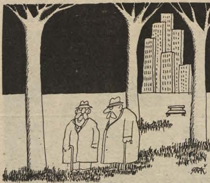
— Pozimi je nam upokojencem najhuje! Kurjava je draga, v postelji nas pa nihče več ne greje.