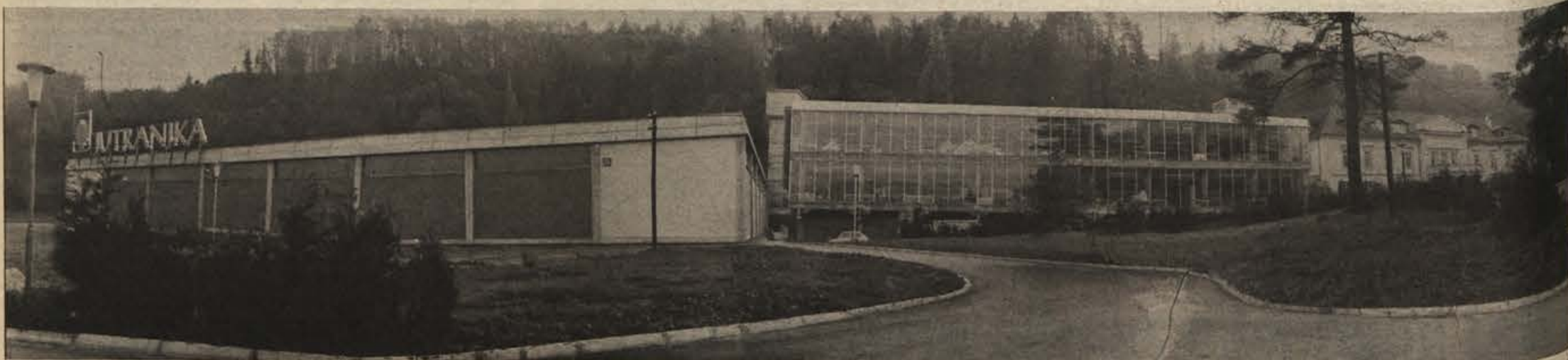
Proizvodni prostori v Sevnici

Cenjenim gostom in vsem občanom čestitamo za občinski praznik!