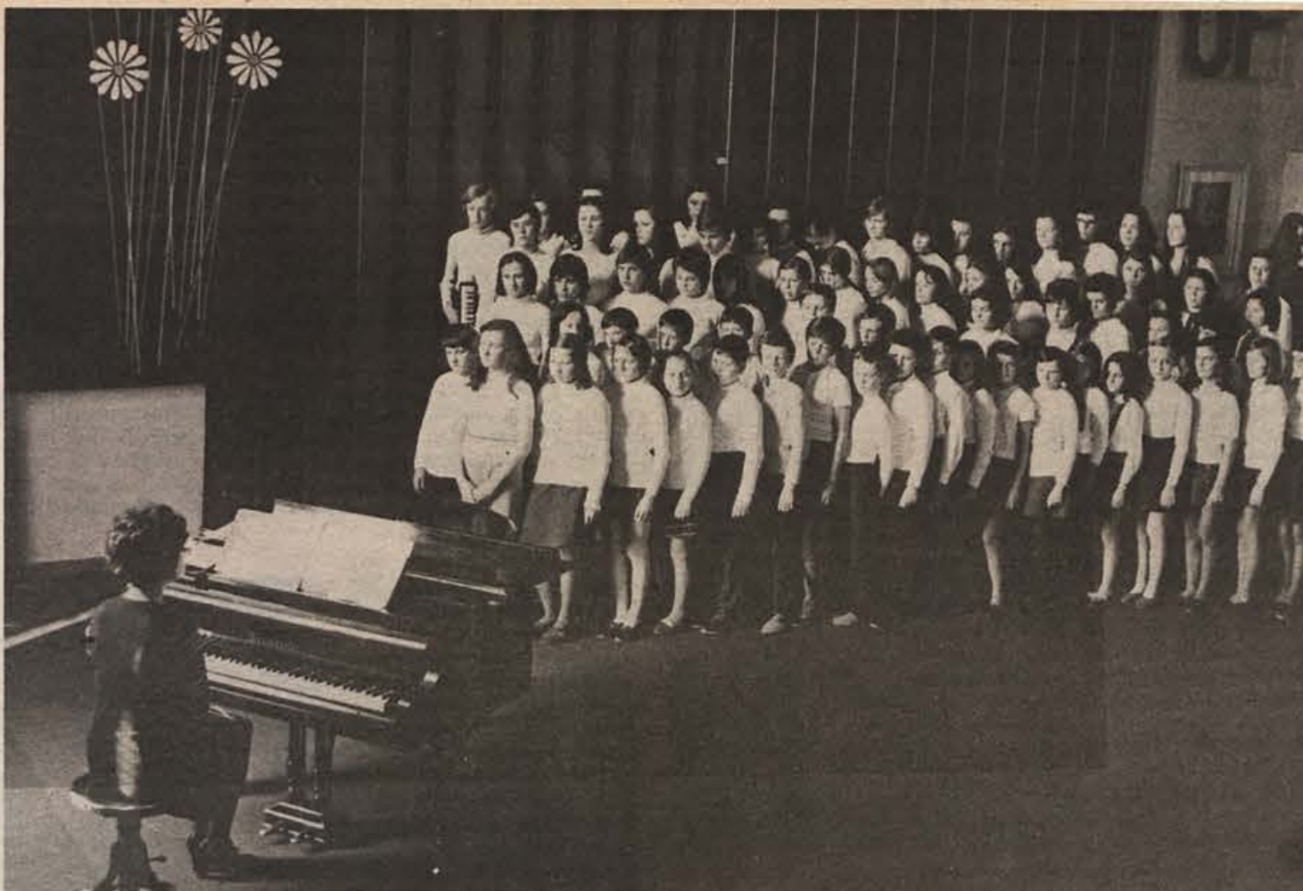
Prvi koraki – kultura postaja nepogrešljiv sestavni del življenja.

– zdravstveni dom Novo mesto 30.000.000 din – kuhinja in pralnica splošne bolnice Novo mesto 9.000.000 din