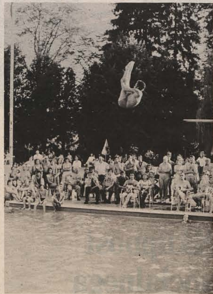
S tekmovalja v skokih v Dolenjskih Toplicah

Tako pridejo v poštev Stadion bratstva in enotnosti, telovadnice, odkrita igrišča pri šolah, prenos teniški igrišč ipd. Stadion bratstva in enotnosti je predviden za dokončno ureditev v letih 1977 in 1978. Stadion je nujno graditi, prekriti tekališča, zaletišča in ostale objekte z umetno maso. Zato je potrebno zagotoviti za vsako leto gradnje po 4.000.000 din. Skupna vlaganja v objekte znašajo v tem obdobju 8.000.000 din.