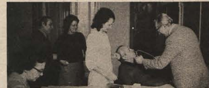
Preventiva, kako zmanjšati prepogostne izostanke z dela.

Zdravstveno varstvo je sestavni del družbene reprodukcije, važen dejavnik družbenega in osebnega življenjskega standarda, dejavnik delovne produktivnosti in obrambne sposobnosti naroda. Uresničujoč svojo ustavno pravico si delavec in zavarovanci z družbenim dogovarjanjem zagotavljajo oblike in obseg zdravstvenega varstva. Zavestne odločitve in načrtni pristop predstavlja program zdravstvenega varstva, ki opredeljuje dolžnosti in pravice uporabnikov in izvajalcev zdravstvenega varstva ter osnovo za medsebojno menjavo dela.