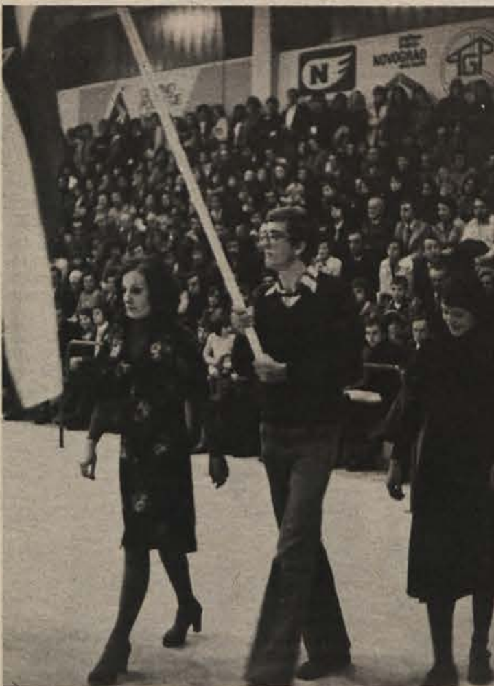
Novo mesto je za letošnji občinski praznik dobilo novo športno dvorano. Posnetek je z otvoritvenega nastopa.

c) v zvezi za športno rekreacijo, ki bo razvijala rekreativno dejavnost, pomembno za ohranjanje in razvijanje delovnih in obrambnih sposobnosti občanov in delovnih ljudi. Vse te nosilce telesnokulturne dejavnosti pa bo združevala občinska konferenca za telesno kulturo.