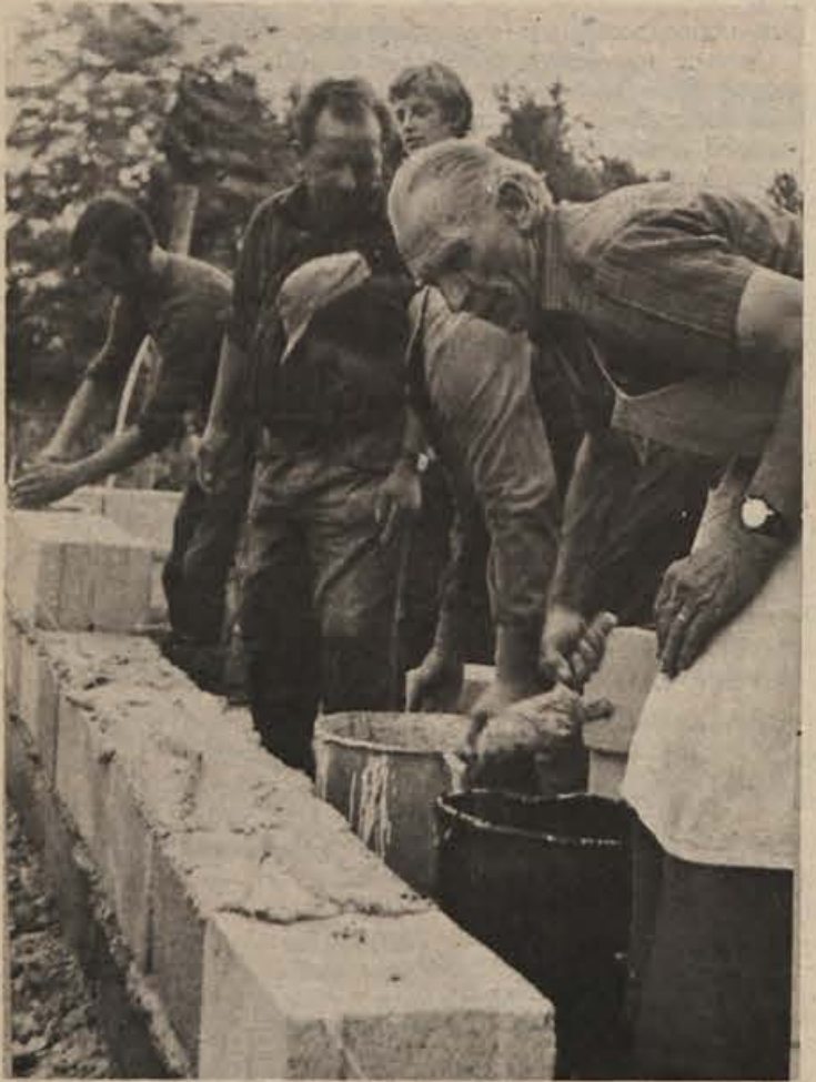
Tudi udarniško delo je oblika krajevnega samopriskveka. V Birčni vasi so tako zgradili prizidek osnovni šoli.

Udeleženci ugotavljajo, da ob upoštevanju globalnih okvirov skupne porabe in medsebojno usklajenih programov samoupravnih