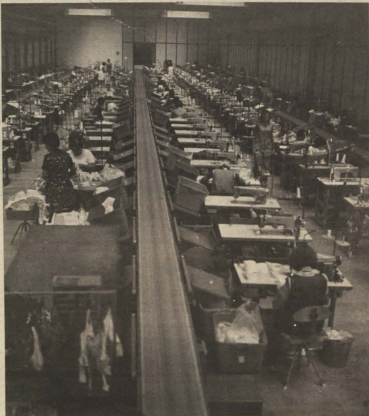
Pogled v šivalnico sevniške Lisce

PRIPOROČAMO NAŠE IZDELKE IN HKRATI ČESTITAMO ZA PRAZNIK OBČINE!