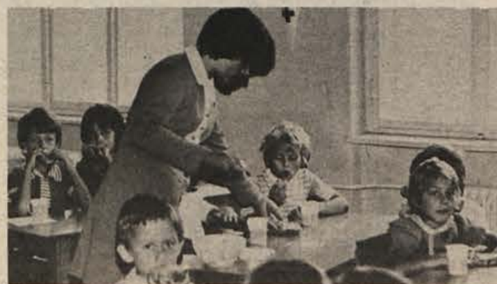
Medtem ko starši delajo ...

Če upoštevamo, da je bilo v letu 1975 odklonjenih 395 otrok, bi bilo nujno, da se predlagani program realizira. Z izgradnjo načrtovanih vrtcev bi v občini imeli v organiziranem otroškem varstvu 1300 otrok oziroma 18,8 %, kar bi bilo še vedno 1,2 % pod republiškim povprečjem.