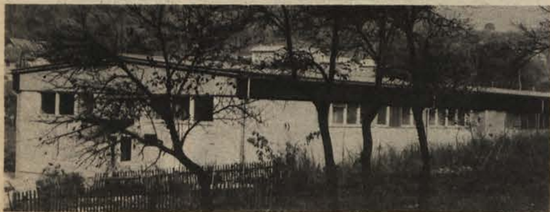
Prostori TOZD Dol pri Hrastniku