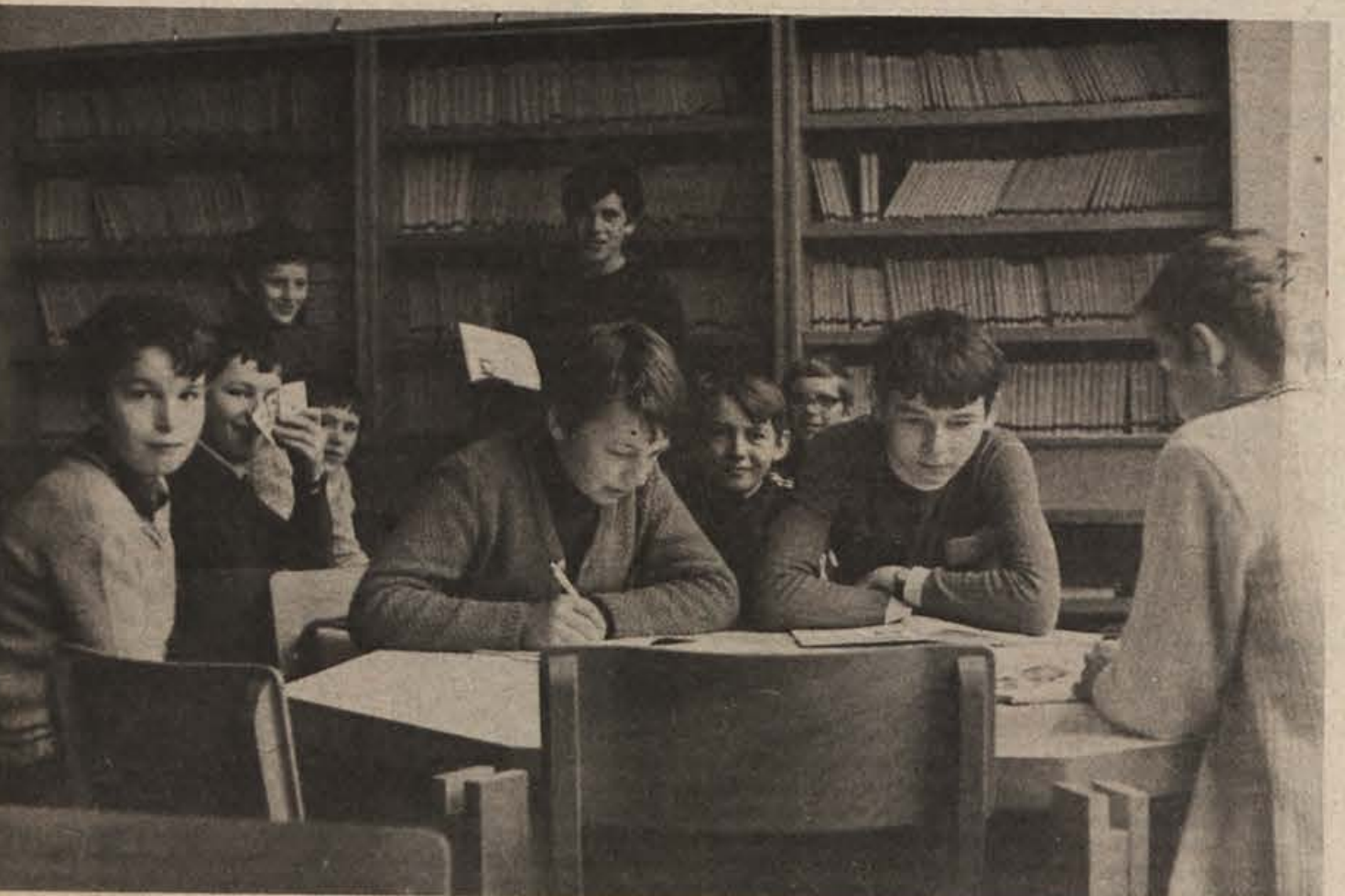
Solsko varstvo v osnovni šoli na Grmu.

Kulturna skupnost bo v letu 1976 financirala gradnjo paviljona NOB in ljudske revolucije, ki bo imel 1.100 m 2 uporabne površine; usposabljala in adaptirala bo kulturno-prosvetne domove v krajevnih skupnostih ter posodobila obstoječi kulturni dom v Novem mestu.