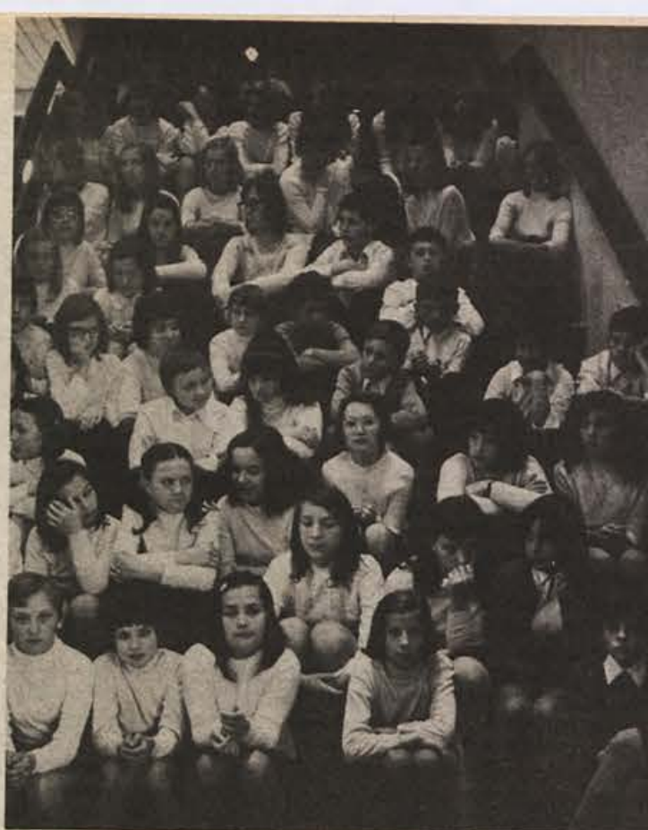
Mladost — enkratna, nepovratna

V dodatnem ali dogovorjenem delu programa, ki ni obvezen in ni enoten za vso republiko, imamo letos tudi financiranje osnovne dejavnosti glasbene šole. Ta naloga je bila do sedaj v enotnem — obveznem programu.