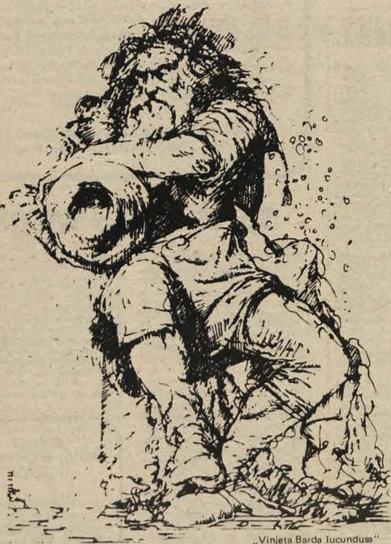
„Vinjeta Barda Iucundusa“

JUGOSLAVIJA 63320 Velenje, Prežihova 3, tel. 850-422