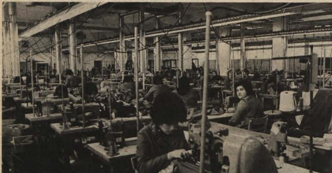
Nova šivalnica TOZD Orlica v Brežicah