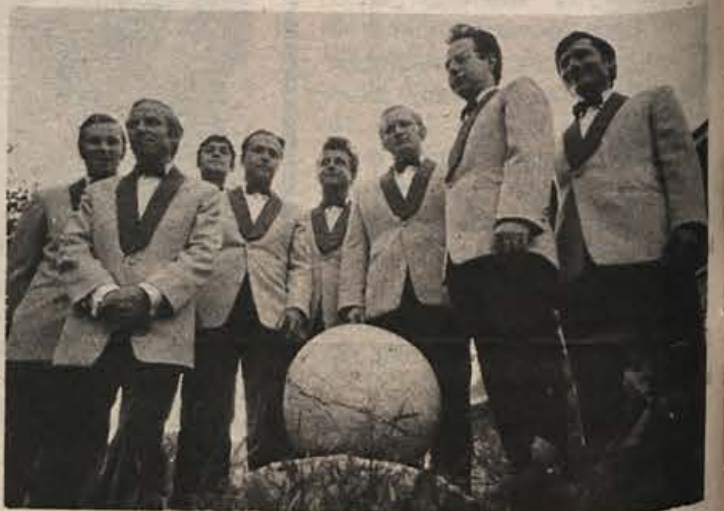
Dolenjski oktet, ki se je z nekaterimi nastopi že uveljavil.

— Dolenjski muzej z oddelki za arheologijo, za novejšo zgodovino s posebnim poudarkom na zgodovini NOB in socialistične iz-