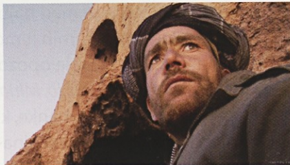
The Giant Buddhas

Potreba po takojšnji sliki je stara. Legendarni švicarski fotograf René Burri mi je razlagal, kako frustriran je bil leta 1967, ko je bil v Izraelu na Sinaju, da bi spremljal šestdnevno vojno, in je nekega večera prišel domov, vzel zvitek filma iz fotoaparata, in medtem ko se je ukvarjal z njim, fotografije niso bile še niti razvite, zagledal natanko iste podobe na televiziji. In zdaj pride ta veliki »toda«. Še vedno verjame, in jaz takisto, da tudi če nisi prvi, a imaš sliko z veliko močjo, emocijo in