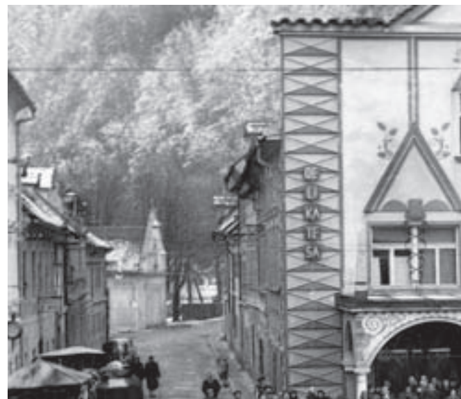
V tej impozantni zgradbi so leta 1963 odprli prenovljen lokal Delikatesa. Ponojal je tudi legendarno francosko solato in šunknen žemljice. / FOTO: ARHIV MMK

Bili pa smo tudi solidarni. Ob katastrofalnem potresu, ki je opustošil Skopje, so delovne organizacije, društva in posamezniki darovali po svojih zmogljivostih. Poleg dnevnega zasluzka je podjetje Titan prispevalo ključavnice in ključce, Svilanit 5 ti-