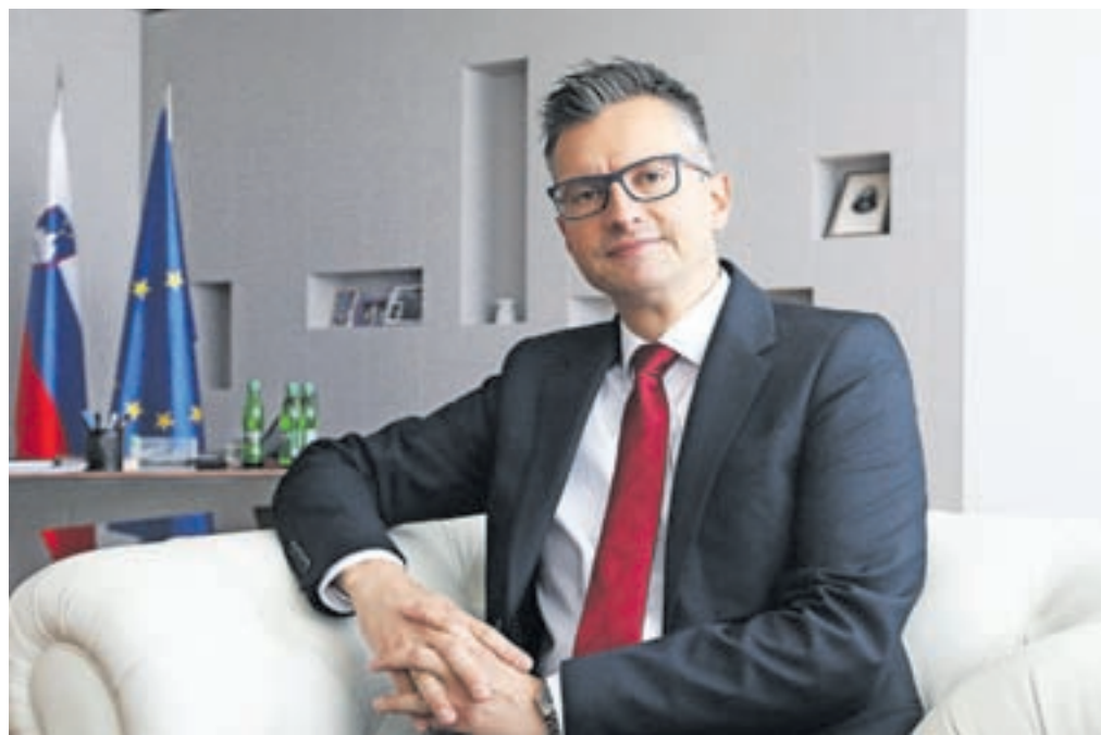
Minister za obrambo Marjan Šarec

Zagotovo se bo kaj našlo, o tem bomo spregovorili na državni analizi, podobno kot po lanskem požaru na Krasu. Vse pomanjkljivosti bomo v prihodnje poskusili čim bolj odpraviti.