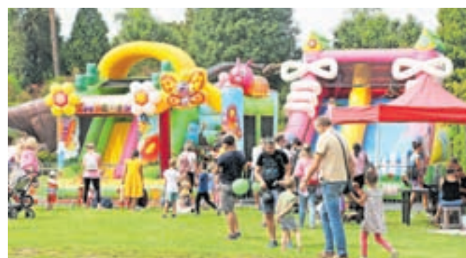
Dežela napihljivih igral