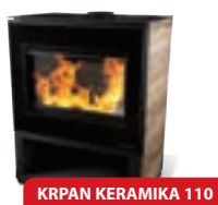
KRKAN KERAMIKA 110