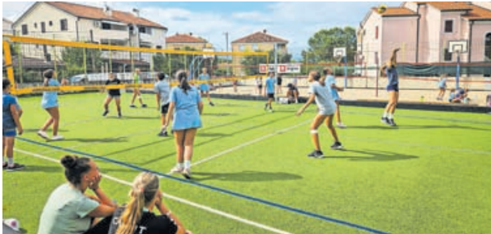
Odbojarski tabor Calcita Volleyja na Krku

»Tabor smo izkoristili tudi za uvodne treninge v novo sezono. Otroci so trenirali dvakrat dnevno, treningi pa so bili prilagojeni starosti in znanju udeležencev. Imeli smo tudi predavanje o športni prehrani in življenju športnika. Dnevi na taborih tako hitro minevajo. Izjemno sem vesela, da smo se vrnili z nasmehi na obrazih. Srečna sem, da lahko delam z mladimi in obetavnimi špor-