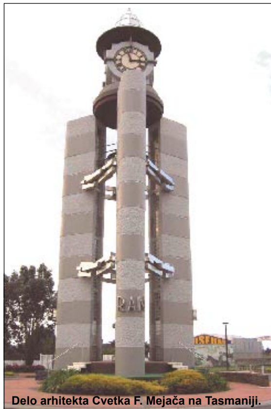
Delo arhitekta Cvetka F. Mejača na Tasmaniji.

Trije stebri, ki rastejo iz zemljepisne podobe Tasmanije, predstavljajo tri rodove: avstralsko kraljevo mornarico, avstralsko pešadijo in avstralsko kraljevo zračno silo. Vsak steber je predstavljen kot knjiga, stekleni kvadrati pa predstavljajo strani, kjer so napisana imena padlih.