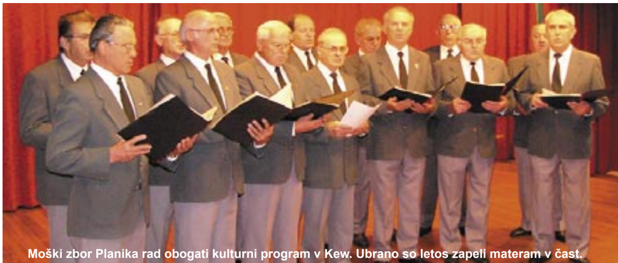
Moški zbor Planika rad obogati kulturni program v Kew. Ubrano so letos zapeli materam v čast.