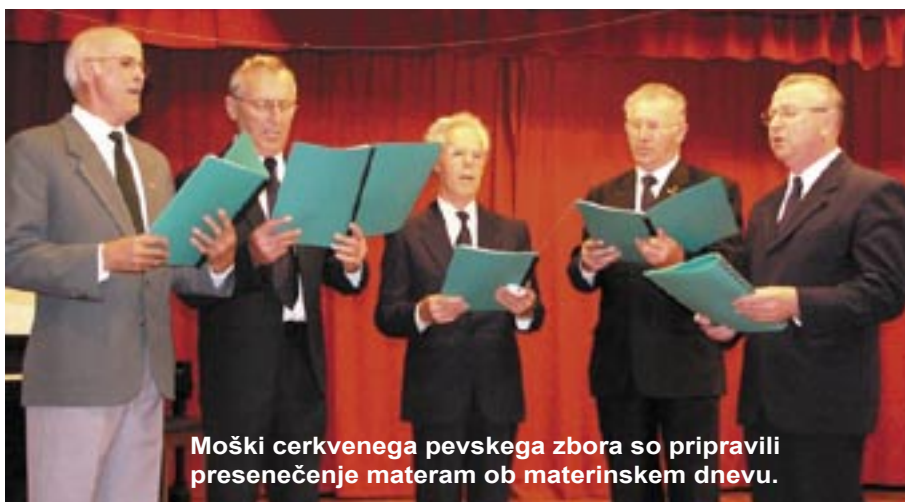
Moški cerkvenega pevskega zbora so pripravili presenečenje materam ob materinskem dnevu.

Pastoralni svet predstavlja vse mnogotere dejavnosti slovenskega misijona v Melbournu, jih načrtuje, usklajuje in vodi skupaj z duhovnikom in pastoralno sodelavko ali s tistimi, ki ju nadomeščajo. V primeru, da voditelj ali duhovnik, ki