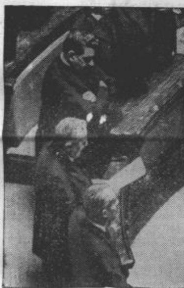
Za njim je govoril o našem blagopokojnem kralju bivši ministrski predsednik g. Gaston Doumergue (na levi stoji g. Herriot)