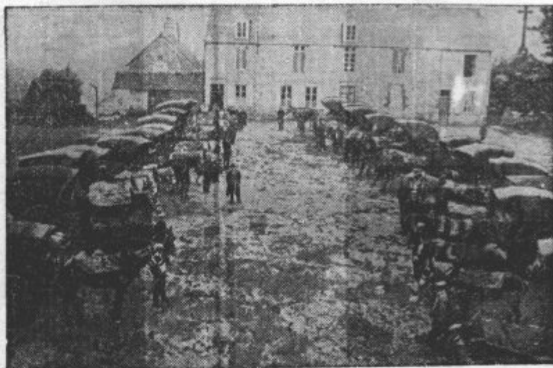
NE ZMOREJO DAVKOV V GOTOVINI. Poljedelci iz francoskega okraja Orna so pripeljali davkarji v Dorndorfu cele vozove žita namestu denarja. Nizke cene kmetijskih pridelkov jim onemogočajo plačevanje davkov v gotovini.