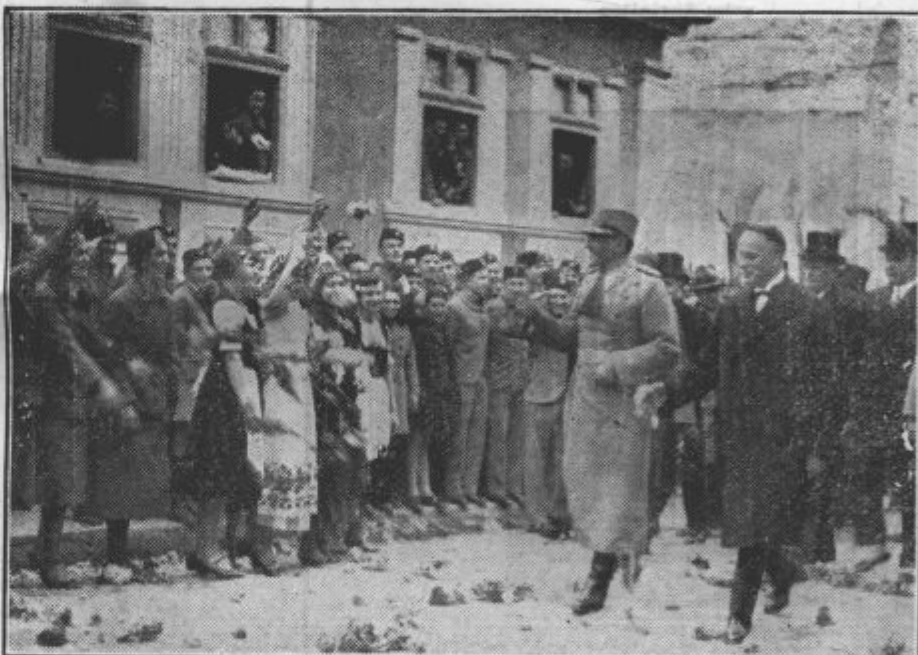
Kralja Aleksandra pozdravlja narod v Kragujevcu