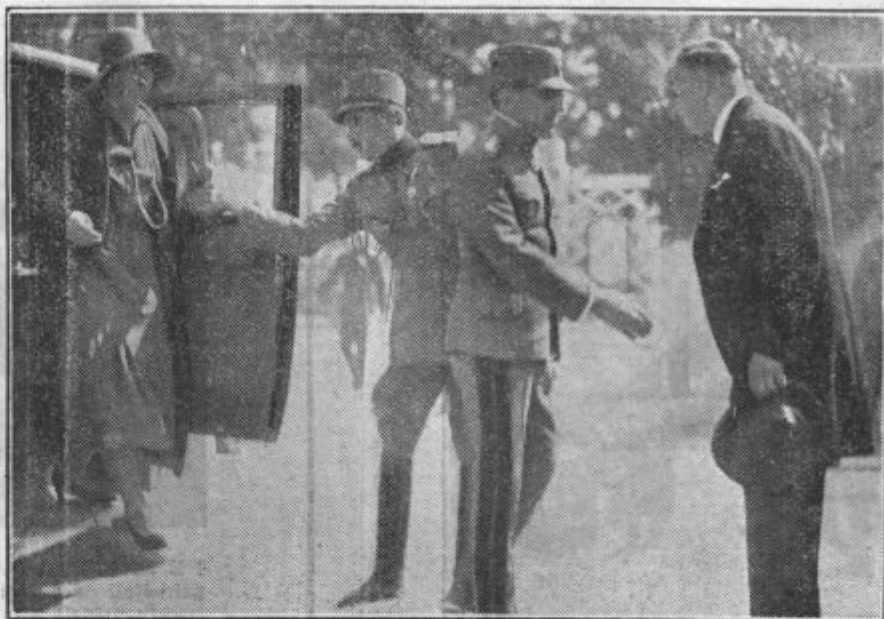
Blagopokojni kralj ob otvoritvi lovske razstave v Ljubljani