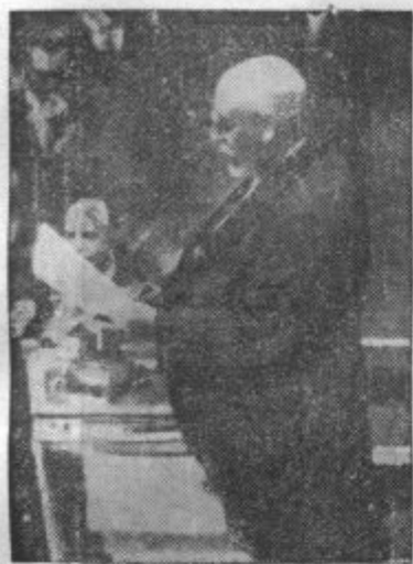
Pretekli torek je francosko narodno predstavništvo priredilo svečano manifestacijo francosko-jugoslovenskega zaveznitva. V parlamentu je imel spominski govor o Viteškem kralju Aleksandru I. Zedinitelju predsednik parlamenta g. Ferdinand Bouisson.