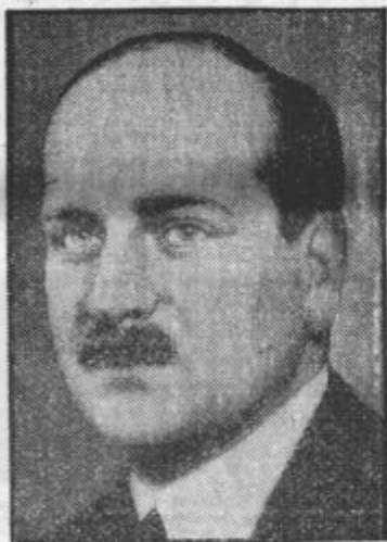
Nova francoska vlada. Ministrski predsednik Pierre Etienne Flandin, ki je sestavil novo vlado narodne koalicije v Parizu.