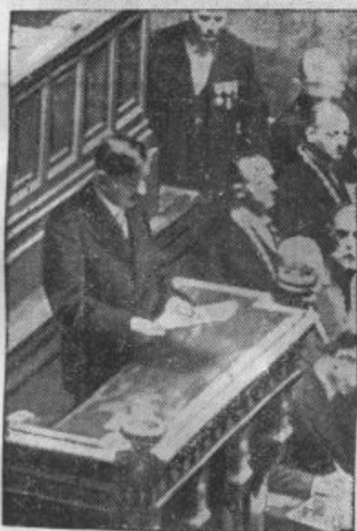
V senatu je imel komemorativni govor v istem smislu zunanji minister g. Pierre Laval.