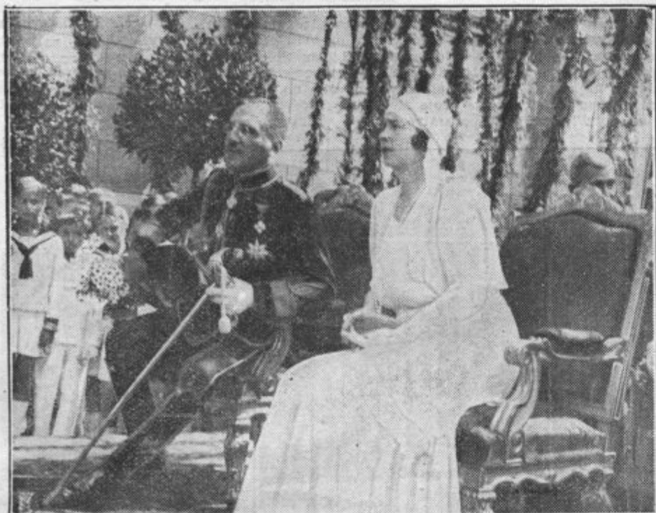
Kraljevska dvojica na obisku v Zagrebu