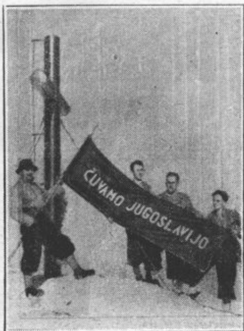
Sportna prisega na škrlatici. Skupina štirih jeseniških turistov je z žalno zastavo prisegla na vrhu škrlatice