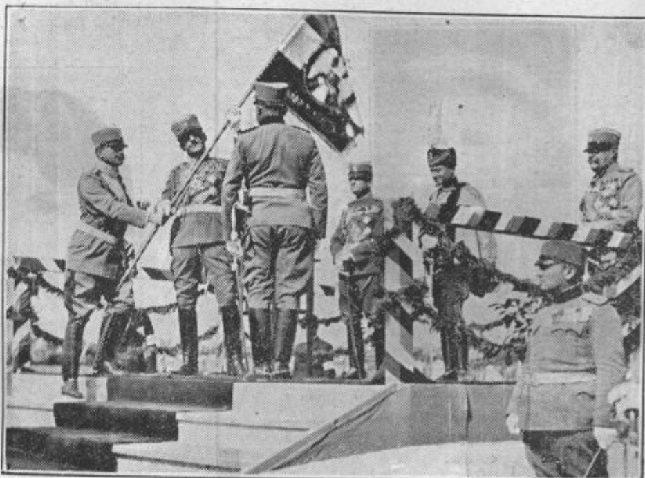
Kralj Zedinitelj izroča svojim polkom nove zastave