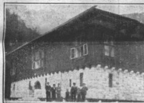
Kraljev lovski dvorec ob Kamniški Bistrici