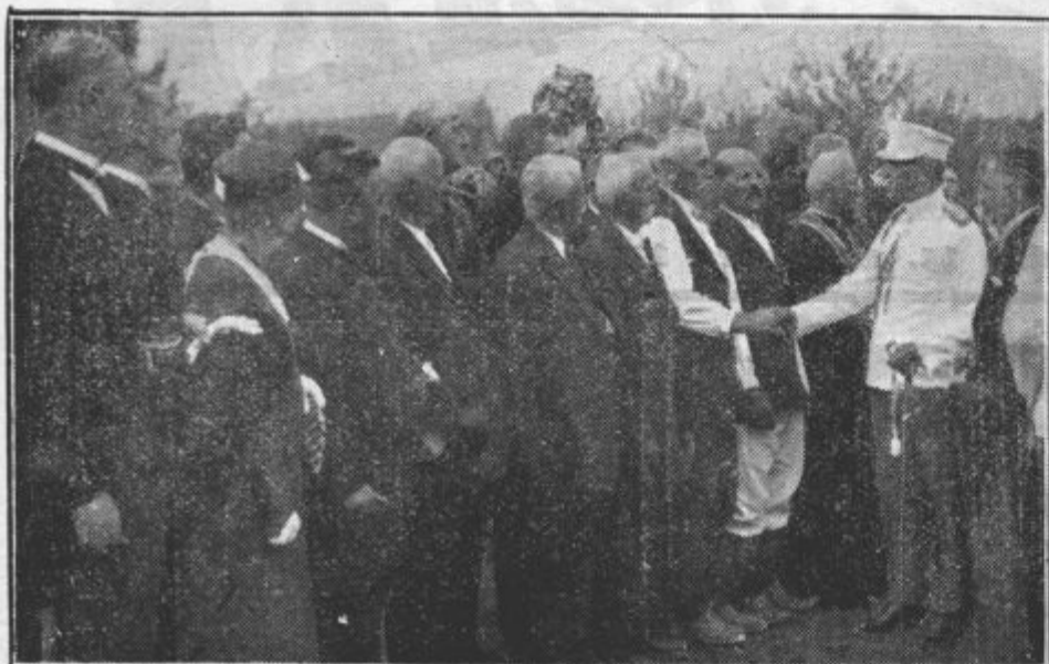
Blagopokojni kralj Aleksander se pogovarja s kmeti