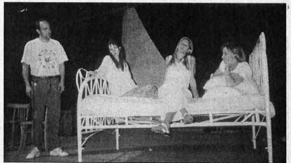
Slovensko gledališče v Buenos Airesu je z uspehom prikazalo igro Čehova „Tri sestre“. Ponovili jo bodo še to soboto in nedeljo.