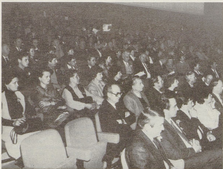
Udeleženci zaključne prireditve ob 25-letnici Hmezada 26. XII. 1986