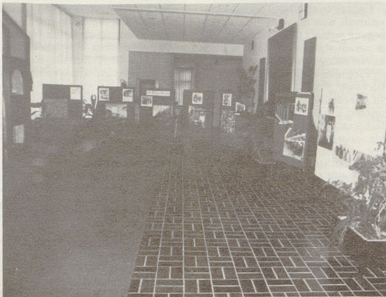
V avli Kulturnega doma v Žalcu je uredništvo Hmeljarja pripravilo priložnostno raz- stavo fotografij s prikazi dejavnosti Hmezada in s praznovanja 25-letnice Hmezada in zbora kolektiva v septembru 1986