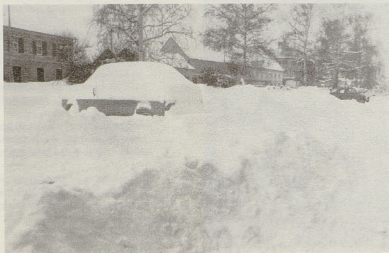
Debela snežna odeja v Žalcu