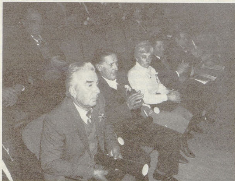
Ploskanje ob zaključku 25-letnice in novim nalogam