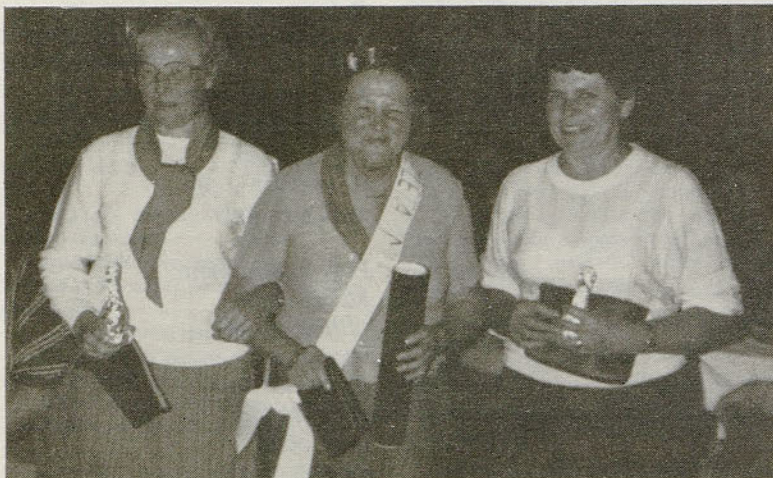
Miss izletov gotoveljskih mlekaric s spremljevalkama

Prodajam njive - 4.300 m 2 po ugodni ceni. Prednost nakupa imajo kmetje kooperanti. Podobnik, Ložnica 6, Žalec