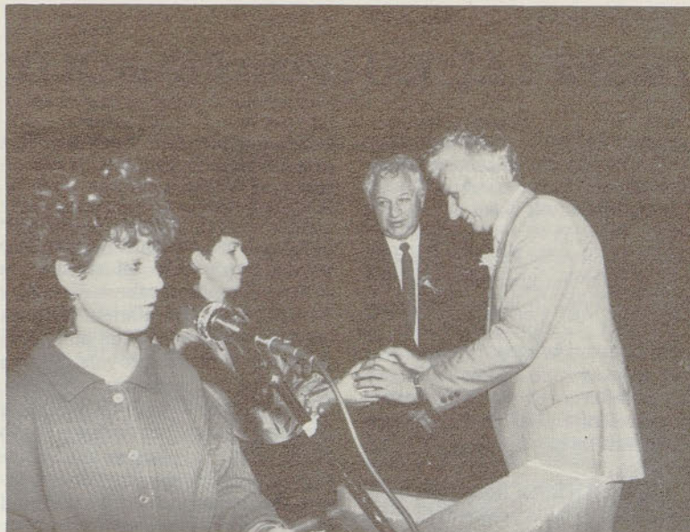
Plakete, posebne plakete in priznanja je za 25-letnico Hmezada prejelo kar 276 delavcev, sodelavcev in poslovnih prijateljev