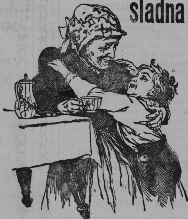
Stara mamica, se meri.

Že leta sem izpričano izvrstna primes k bobevi kavi. — Pri živčnih, srcnih, želodčnih boleznih, pri pomanjkanju krvi eto. zdravniško priporočena. — Najprijubljenjša kavina pijača v stotisočero rodovinah.