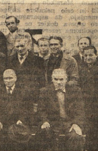
Skupina nagrajenih vinogradnikov iz Campor