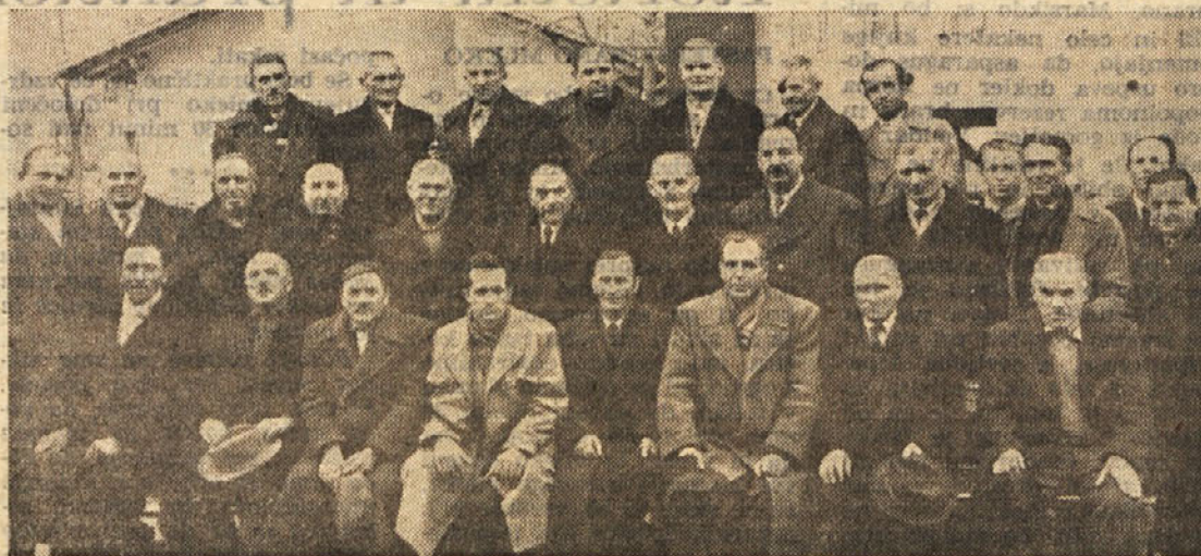
Pred petnajstimi leti na Opčinah. Člani prvega glavnega odbora Kmečke zveze