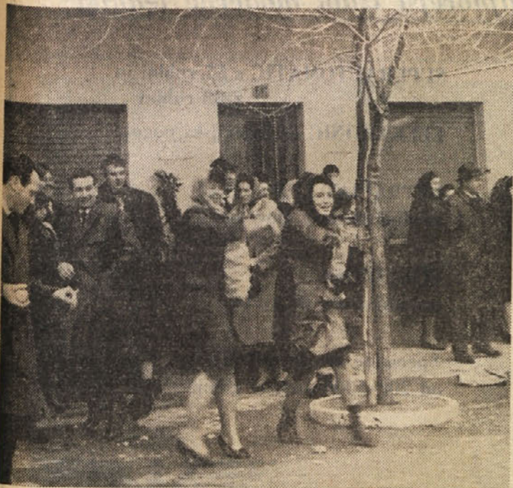
Boljunska dekleta «streljajo» na fante

Delitev darilnih zavojev - Tudi letos tradicionalno «Štefanovo lučanje»