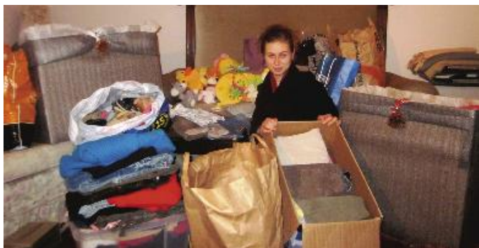
Članica BMC pri sortiranju »daril«.

V Blejskem mladinskem centru smo novembra organizirali humanitarno akcijo zbiranja otroških oblek, igrač in šolskih pripomočkov. Polne zbiralne škatle, ki so stale v osnovnih šolah Bled, Bohinjska Bela, Ribno, v vrtcu Bled ter v Cocktail baru Apropos, so nas prijetno presenetile in dokazale, da Gorenjci znamo pomisliti na drugege.