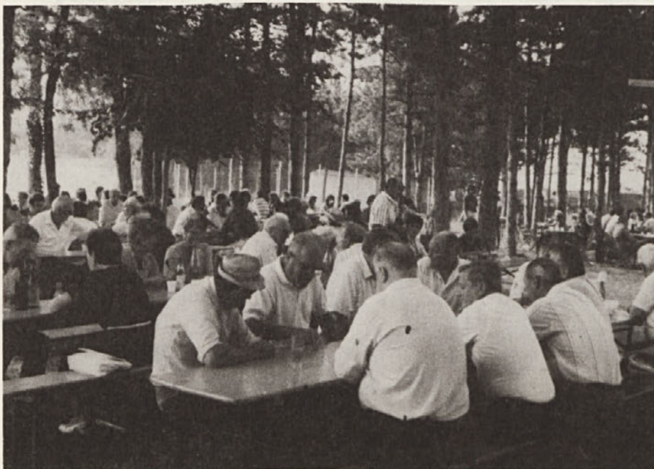
V Trebčah je prelep gozdič pri nogometnem igrišču v začetku meseca gostil praznik kar devet dni. Praznik našega tiska je bil sicer zdužen s praznikom športnega društva Primorec.

V tej logiki je na Tržaškem udarna sila socialistična stranka, ki je očitno že prevzela običaje in mišljenje svoje trajne zaveznice, Liste za Trst. Celu za slovenske socialiste je govoriti slovensko na seji rajonskega sveta v Škednju nepotrebno izzivanje. V isti sapi pa prihaja na dan alternativni predlog, oziroma ponudba manjšini, naj se pač sprijazne s tem, da zaščitnega zakona še dolgo ne bo dobila in naj zato sprejme ukrep, ki bi Slovincem dal takoj na razpolago tistih 24 milijard, ki jih vsebuje finančni