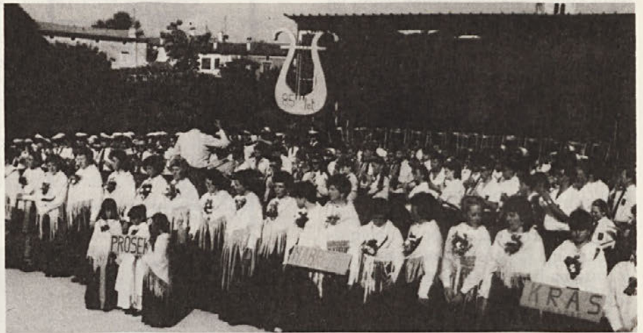
Sredi minulega meseca so na Proseku praznovali 85-letnico godbe na pihala Prosek Kontovel.