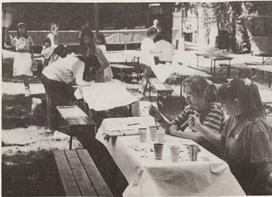
V Bazovici je bil letos prvič praznik združevanja, pri katerem so sodelovala razna slovenska in italijanska društva. Na sliki mladinski extempore.

V politiki smo in moramo biti – tako se mi zdi – bolj zaskrbljeni zaradi razlik, ki ne izhajajo iz biologije. Pomembnejša od razlike med moškim in žensko se mi zdi razlika med nadrejenim in zapostavljenim človekom, pa naj bo nadrejeni (oz. zapostavljeni) moški ali ženska.