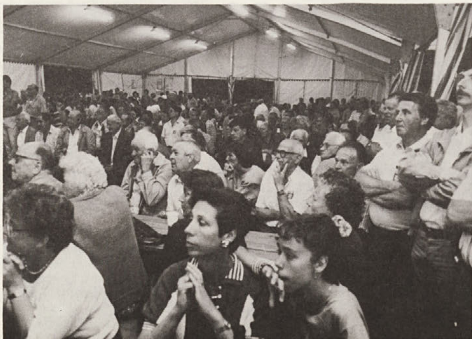
Dolinski praznik tiska je bil tudi tokrat zelo lepo obiskan. Na sliki gledalci folklorne skupine iz Makedonije, ki je žela velik uspeh.

Naj mi bo o tem dovoljeno tudi osebno pričevanje. Spominjam se, kako smo se sprli v Strassburgu, lansko jesen, pri izbiri delegatov iz Evrope (predsem ZRN in Beneluksa) za vsedrjavno kon-