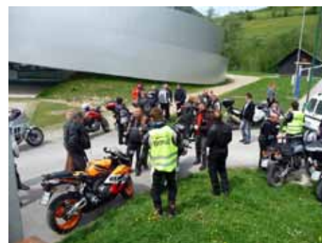
Prihod v Vitanje