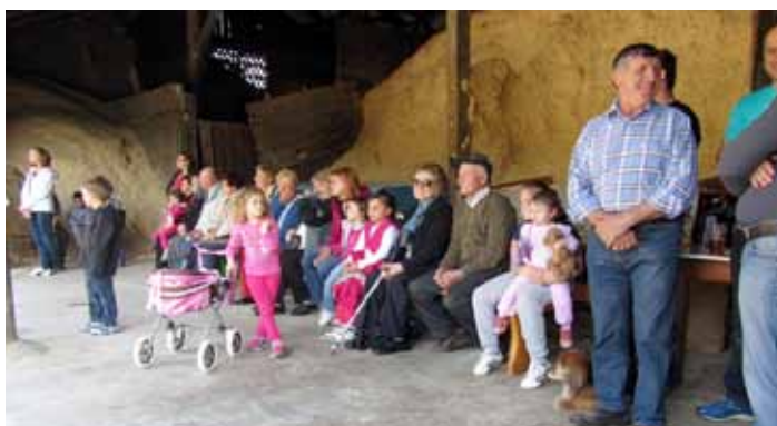
Veliki in mali gledalci v Javorjah