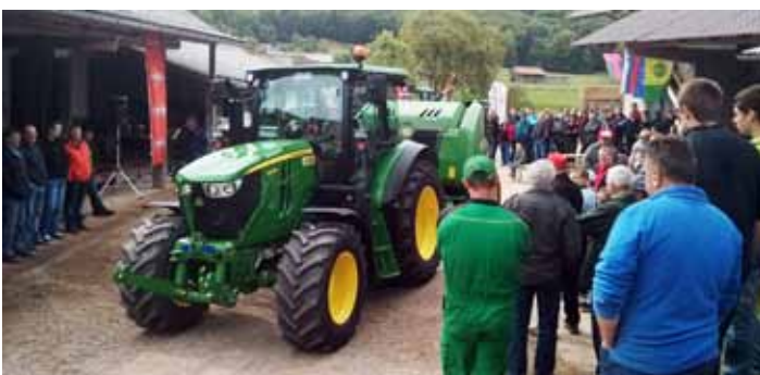
V nedeljo, 4. maja, je Strojni krožek Radomlja v Vidmu pri Lukovici organiziral tradicionalno srečanje.