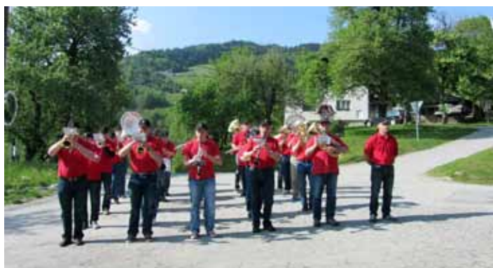
Godbeniki v Javorjah