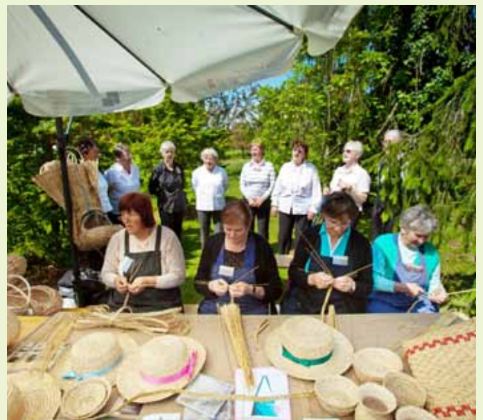
Pletilje slamnatih kit iz KUD Fran Maselj Podlimbarski