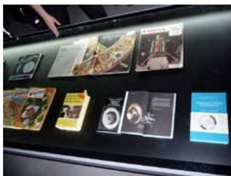
Ekskluzivna izdaja knjige Problem vožnje v vesolju

za vesoljske telebane, ki smo se s tem srečali prvič, pa tudi za tiste, ki jih zadeve malo bolj podrobno zanimajo in o tej temi že več vedo. KSEVT je bil tokrat naš glavni postanek v okviru vsakoletne otvoritvene vožnje. Proti Vitanju se nas je dopoldne izpred Kava bara Lenček v Šentvidu odpravilo prek 30 motorjev. Vreme nam je bilo izjemno naklonjeno, prav tako