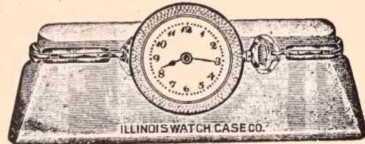
ILLINOIS WATCH CASE CO.